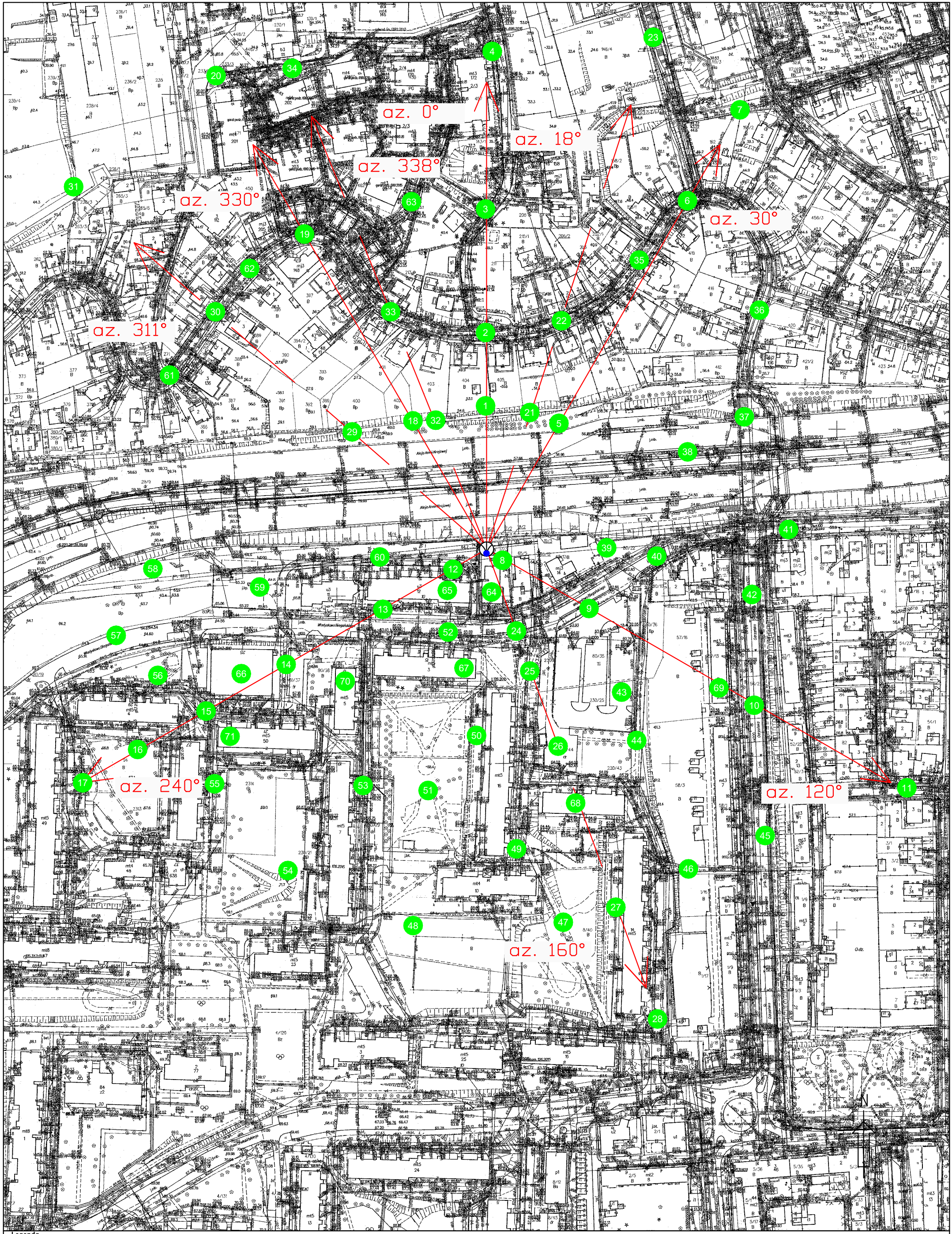
Rys.1 Lokalizacja pionów pomiarowych