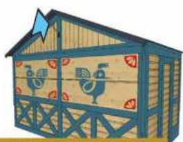
KOMISJA SPORTU I TURYSTYKI RADY MIASTA GDAŃSKA