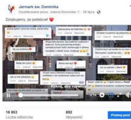
KOMISJA SPORTU I TURYSTYKI RADY MIASTA GDAŃSKA

Z nowości online-owych będziemy dużo bardziej aktywni.