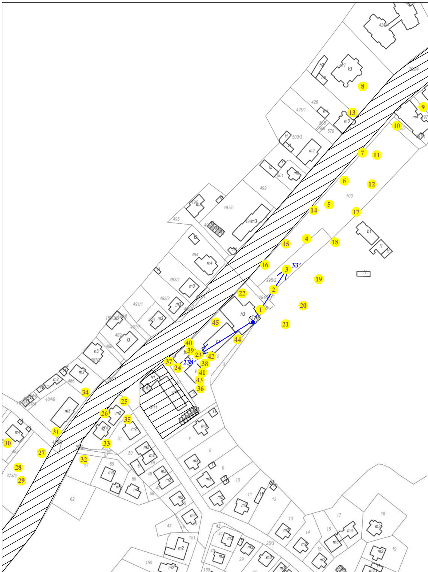
Rys. 2 Lokalizacja pionów pomiarowych

Legenda: brak dostępu antena radiolinowa źródło PEM pion pomiarowy antena sektorowa