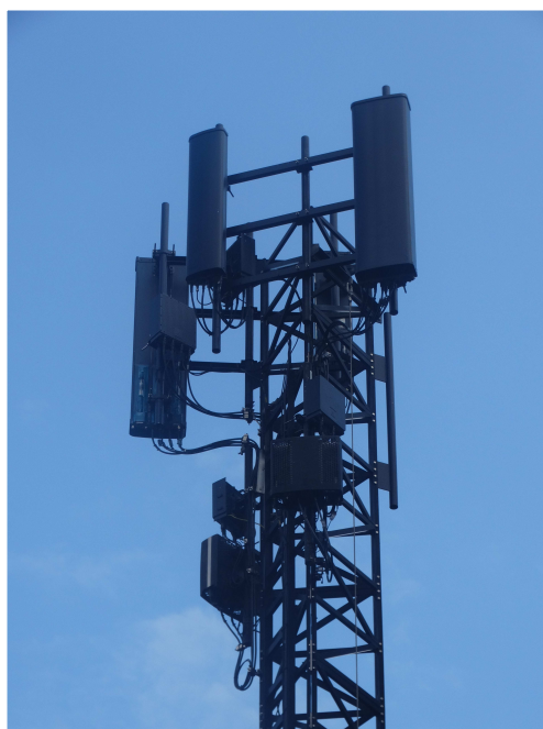
Rys. 3 Widok badanego obiektu