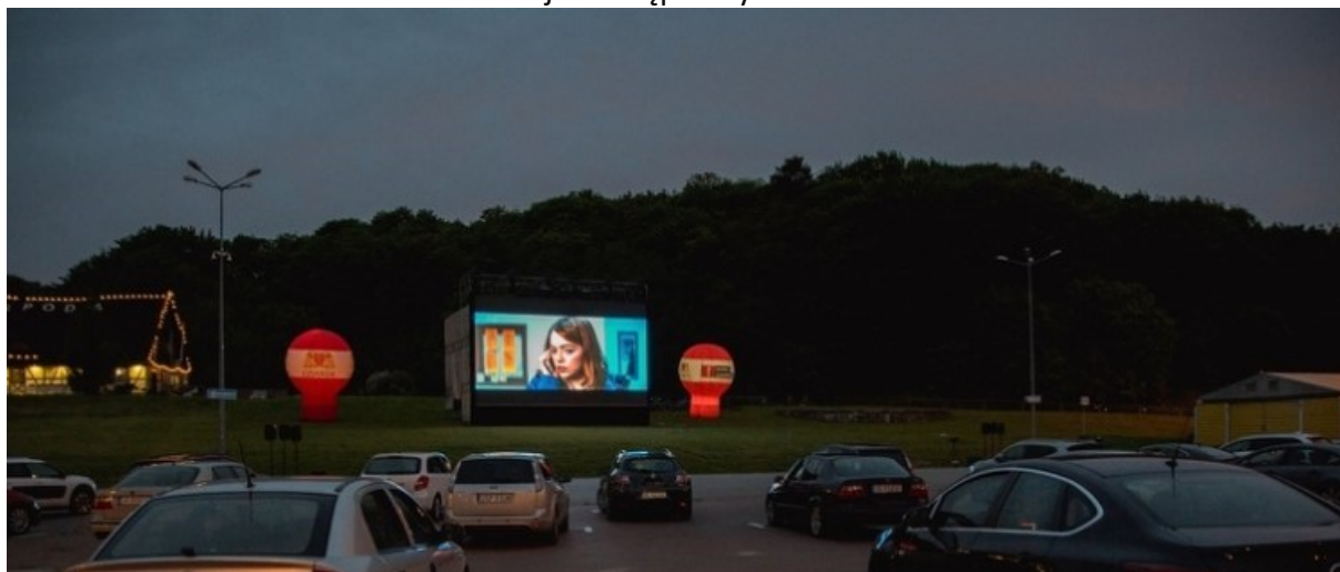
Rycina 2. Święto Gdańska. Kino samochodowe dla dorosłych na Placu Zebrań Ludowych.