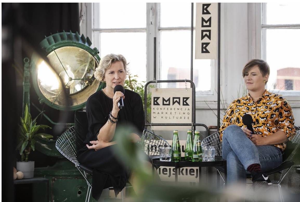
Rycina 7. Konferencja Marketing w kulturze – ogólnopolskich spotkań osób zajmujących się promocją, komunikacją i marketingiem w instytucjach kultury.