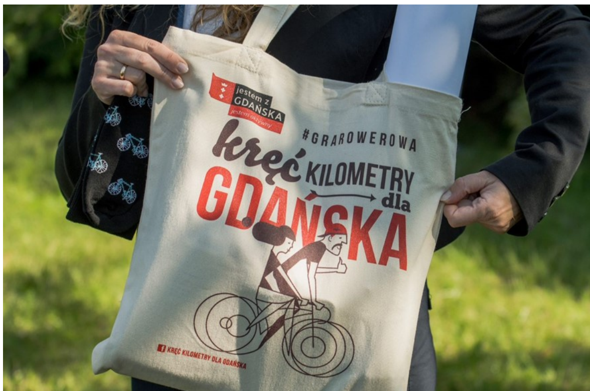
Rycina 7. Kampania społeczna Rowerem do pracy i szkoły – Kręć kilometry dla Gdańska. na zdjęciu prezentacja torby bawełnianej z nadrukiem – grafiką projektu.