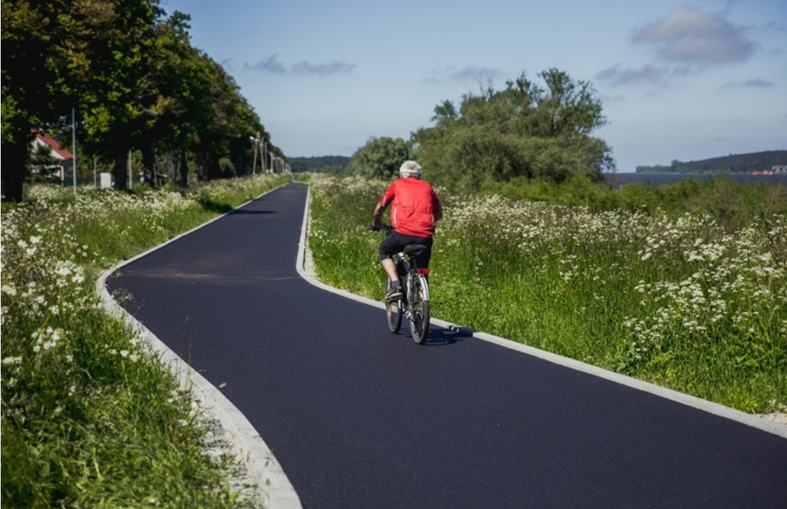
Rycina 1. Nowo wybudowany fragment Wiślanej Trasy Rowerowej – odcinek Świbno - Przegalina.