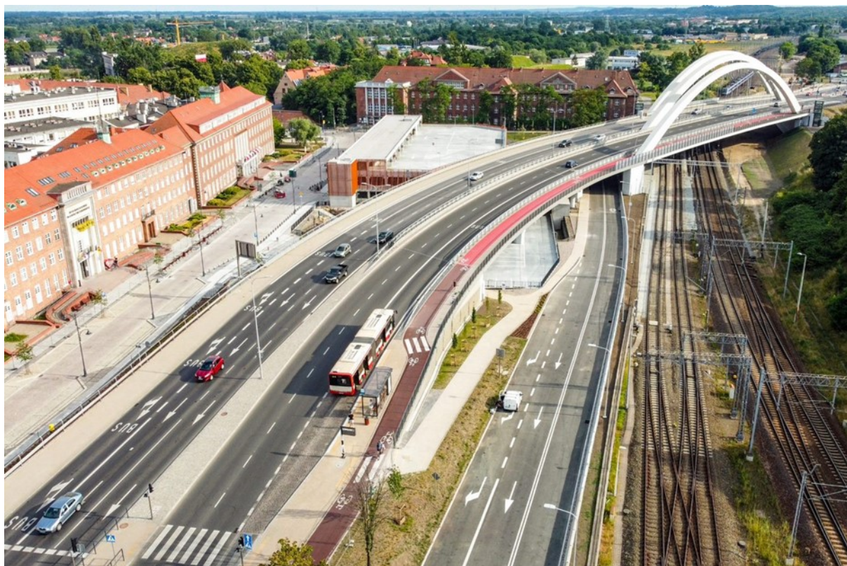
Rycina 5. Zdjęcia z lotu ptaka prezentujące wiadukt Biskupia Górka po przebudowie wraz z nową infrastrukturą drogową oraz parkingiem kubaturowym.