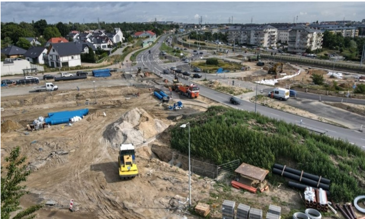
Rycina 3. Zdjęcia z lotu ptaka prezentujące prace budowlane przy linii tramwajowej Nowa Warszawska, w miejscu skrzyżowania z aleją Havla.