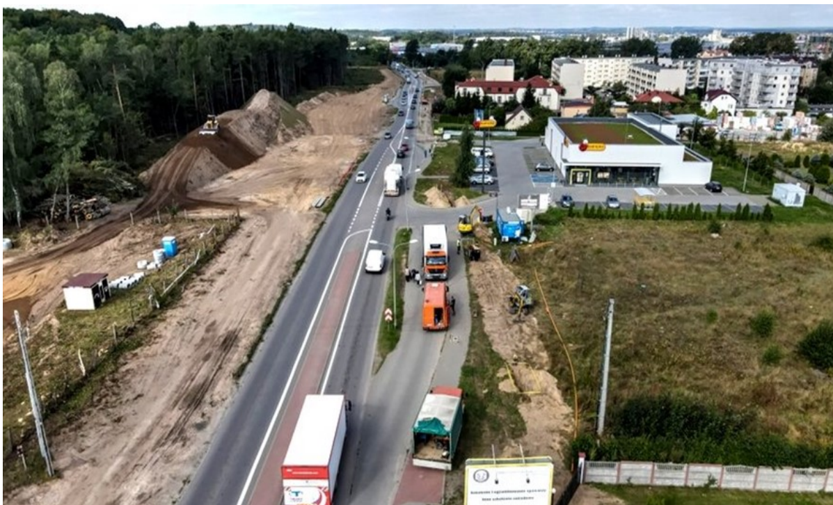
Rycina 6. Rozbudowa ul. Kartuskiej na odcinku od ulicy Otomińskiej do skrzyżowania z ulicą Nowatorów.

miasta oraz umożliwi łatwiejszy dojazd do terenów inwestycyjnych w dzielnicy Kokoszki. Jej koszt to ponad 37 mln zł.