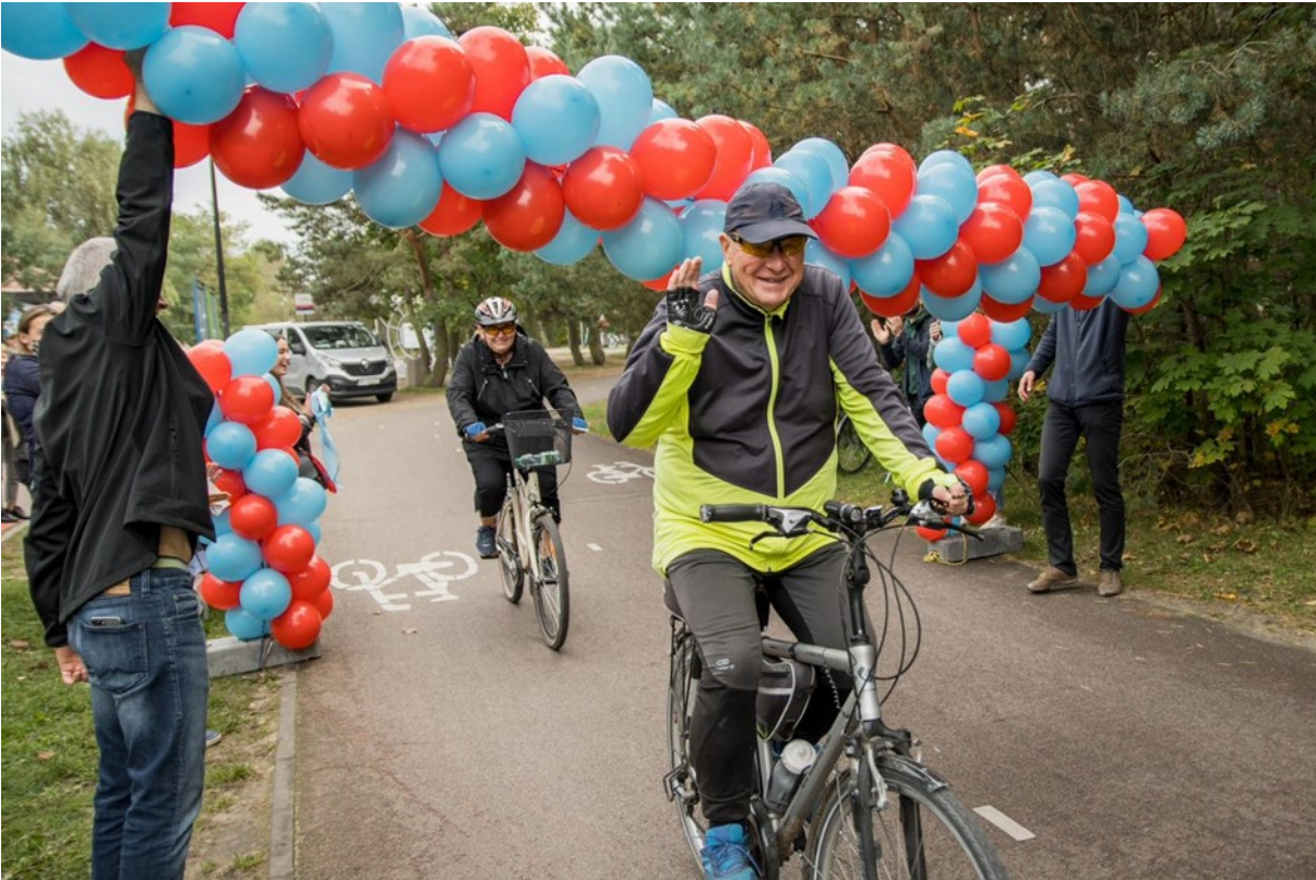
Rycina 8. Milionowy rowerzysta w Pasie Nadmorskim, którego wyznaczono precyzyjnie dzięki zamontowanemu na stałe w okolicy moła licznikowi przejazdów rowerowych.