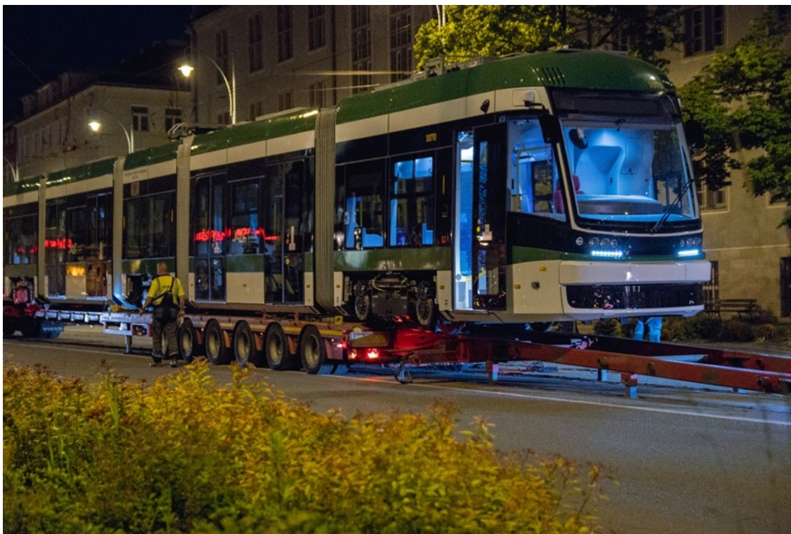
Rycina 4. Nocna dostawa biało-zielonej Pesy Jazz Duo w ulicy Nowe Ogrody – miejsca wpięcia nowych pojazdu w trakcję i szyny.