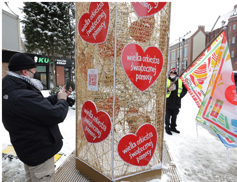
30. finał WOŚP odbędzie się 30 stycznia

rzeczywistości. Wszyscy jednak wiemy, o czym serduszko mówi, co nam przypomina. Można je spotkać w sferze najwyższego sacrum: w kościołach zdobione są nim figury Jezusa i Maryi. Każda katoliczka i każdy katolik wie, że większej miłości do ludzi na tym świecie nie ma. Że to wzór, do którego mamy dążyć, bo taki jest nasz moralny obowiązek. Piszę "każdy wie", ale w domyśle należy raczej czytać "każdy niby-wie".