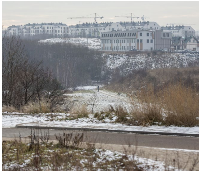
Widok na tereny pod I etap budowy Nowej Świętokrzyskiej

Pierwszy wniosek, to kluczowa inwestycja dla południowej części Gdańska – budowa I etapu Nowej Świętokrzyskiej na odcinku