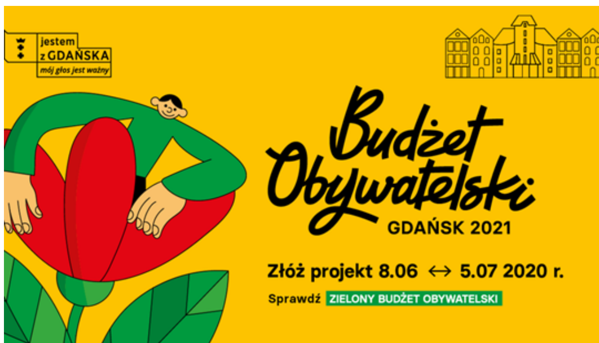
ryc. 3. W 2020 r. mieszkańcy po raz ósmy mieli możliwość zgłaszania i wyboru projektów w ramach Budżetu Obywatelskiego.