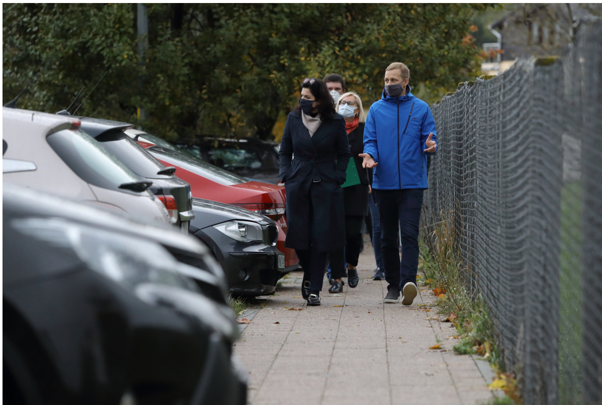
ryc. 4. Roboczy spacer po dzielnicy Piecki-Migowo z udziałem prezydent Aleksandry Dulciewicz i przedstawicieli rady dzielnicy.