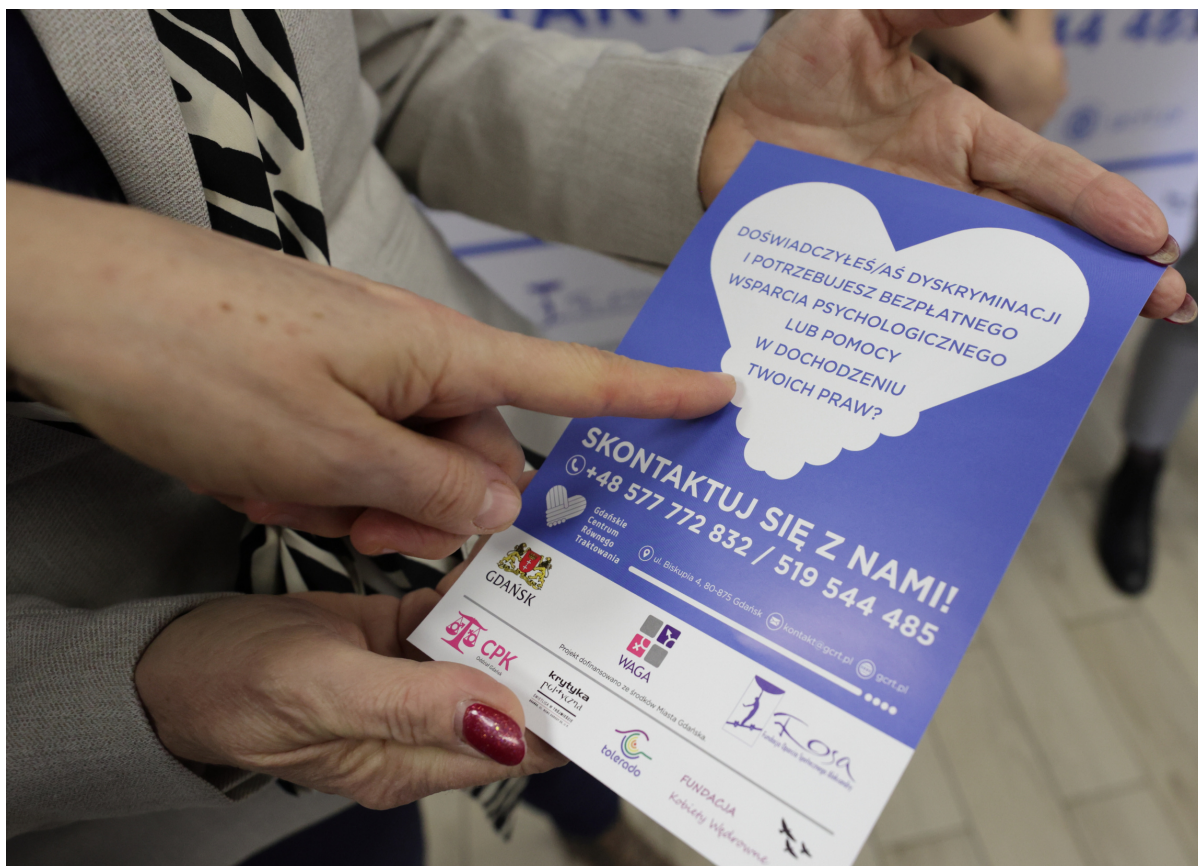
ryc. 1. W październiku 2020 r. nastąpiło wznowienie działalności Gdańskiego Centrum Równego Traktowania, zapewniającego wsparcie osobom doświadczającym dyskryminacji.