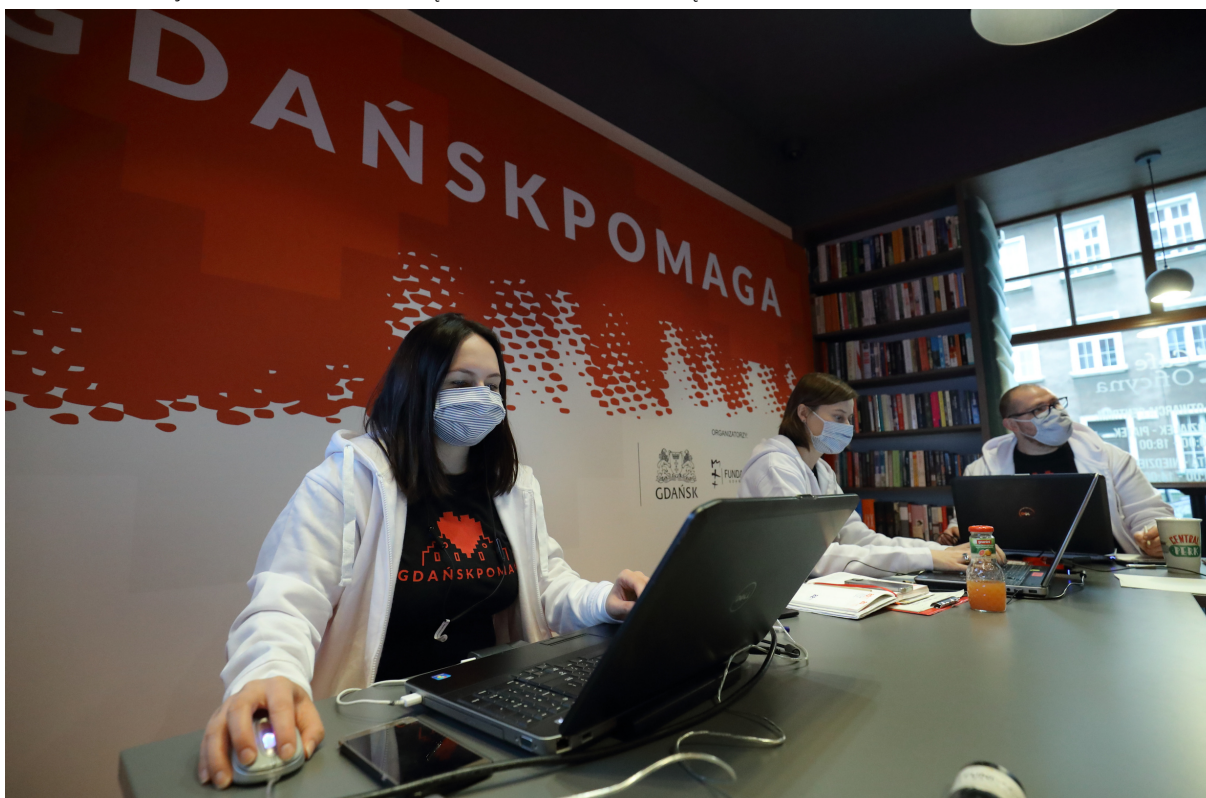
ryc. 5. Gdańskie organizacje pozarządowe zaangażowały się w realizację akcji #GdańskPomaga. Efektem wspólnych działań było powstanie gdańskiego systemu wsparcia mieszkanek i mieszkańców w czasie pandemii.