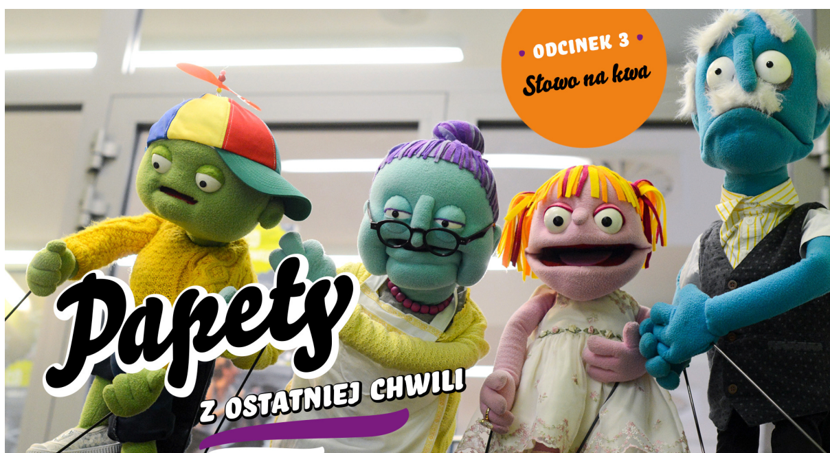
ryc. 1. „Papety: z ostatniej chwili” są jednym z elementów obecności Miniatury online pod hasłem Miniatura dzieciom w sieci. Jest to odcinkowy program dla najmłodszych z wykorzystaniem teatralnych lalek.