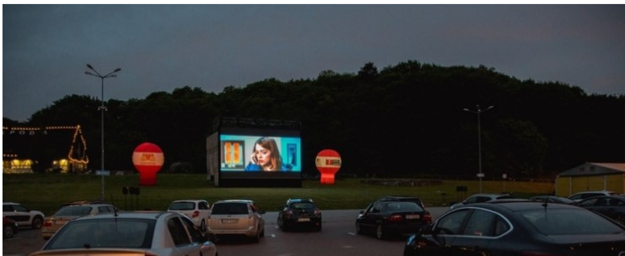
ryc. 2. Święto Gdańska. Kino samochodowe dla dorosłych na Placu Zebrań Ludowych.