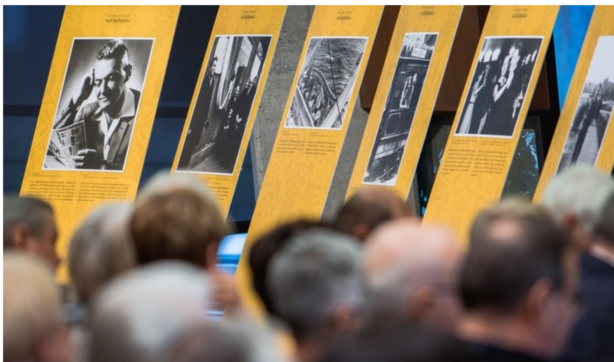
ryc. 4. Symposium LECH BĄDKOWSKI I JEGO IDEE oraz wystawa dedykowana pisarzowi, publicyście i działaczowi społecznemu, Europejskie Centrum Solidarności.