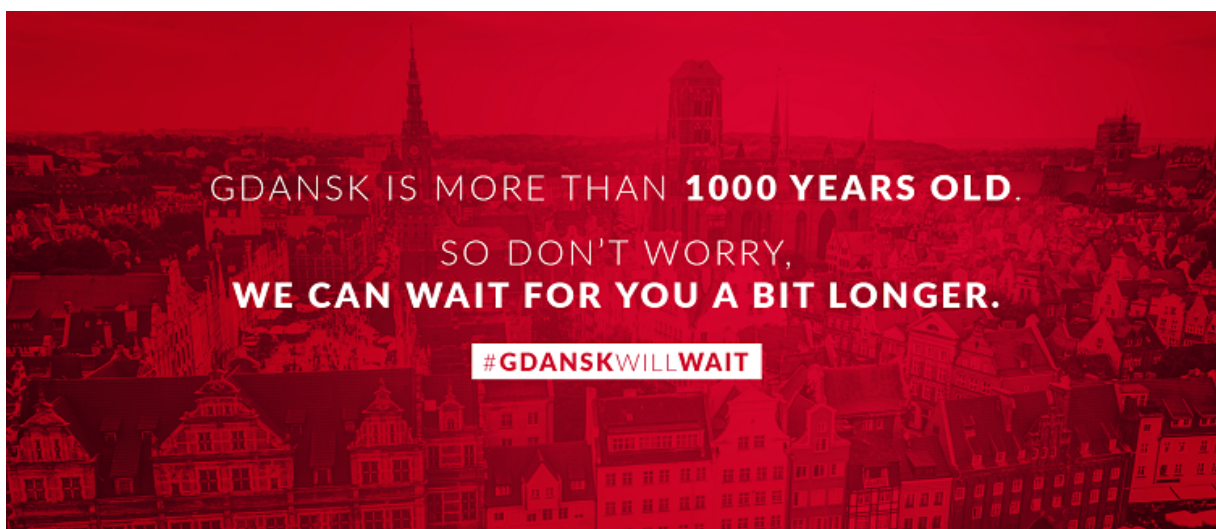
ryc. 6. Grafika promująca działania pod hasłem #CityWillWait związane z przeciwstawianiem się kryzysowi wywołanemu przez pandemię koronawirusa, które realizowały metropolitalne organizacje turystyczne w Gdańsku, Warszawie, Poznaniu i Łodzi. Mat. Gdańska Organizacja Turystyczna