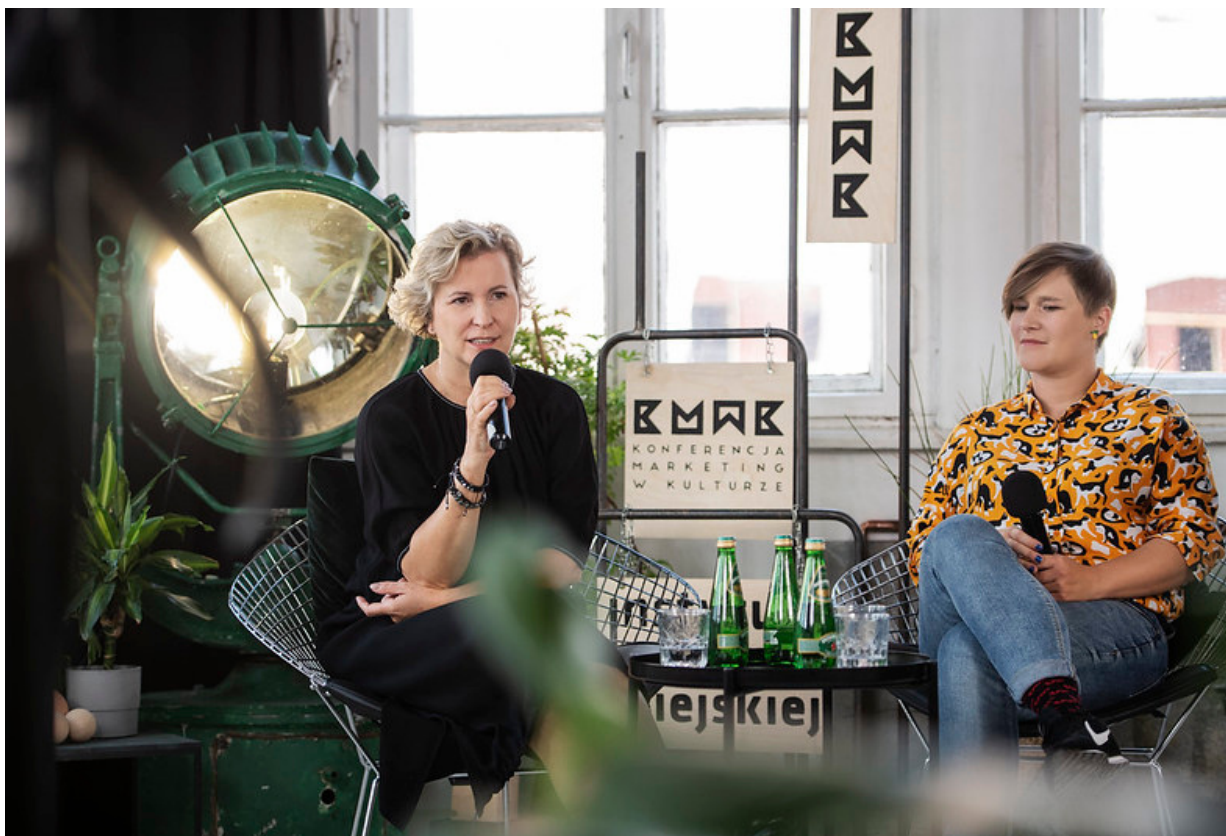
ryc. 7. Konferencja Marketing w kulturze – ogólnopolskie spotkania osób zajmujących się promocją, komunikacją i marketingiem w instytucjach kultury.