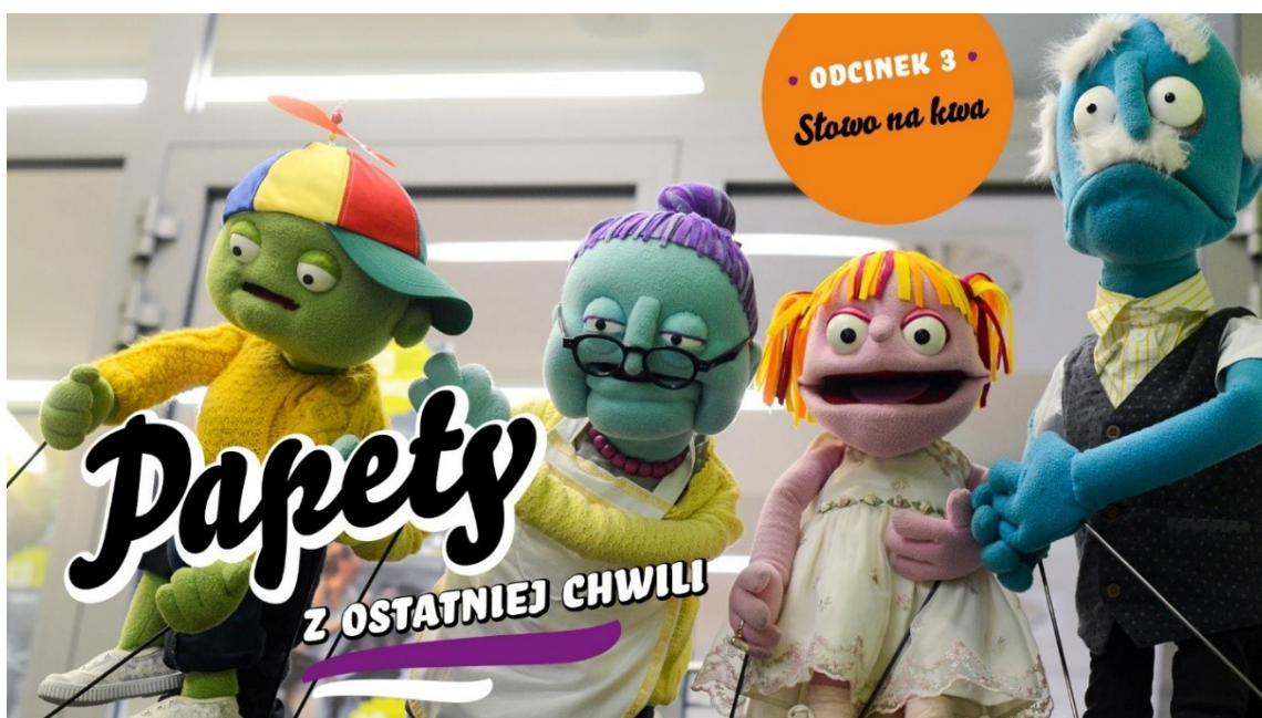
Rycina 1. „Papety: z ostatniej chwili” są jednym z elementów obecności Miniatury online pod hasłem Miniatura dzieciom w sieci. Jest to odcinkowy program dla najmłodszych z wykorzystaniem teatralnych lalek. Materiał: Teatr Miniatura / gdansk.pl