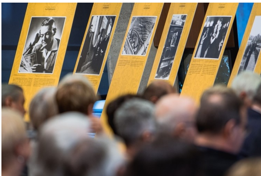
Rycina 4. Symposium LECH BĄDKOWSKI i JEGO IDEE oraz wystawa dedykowana pisarzowi, publicyście i działaczowi społecznemu, Europejskie Centrum Solidarności.