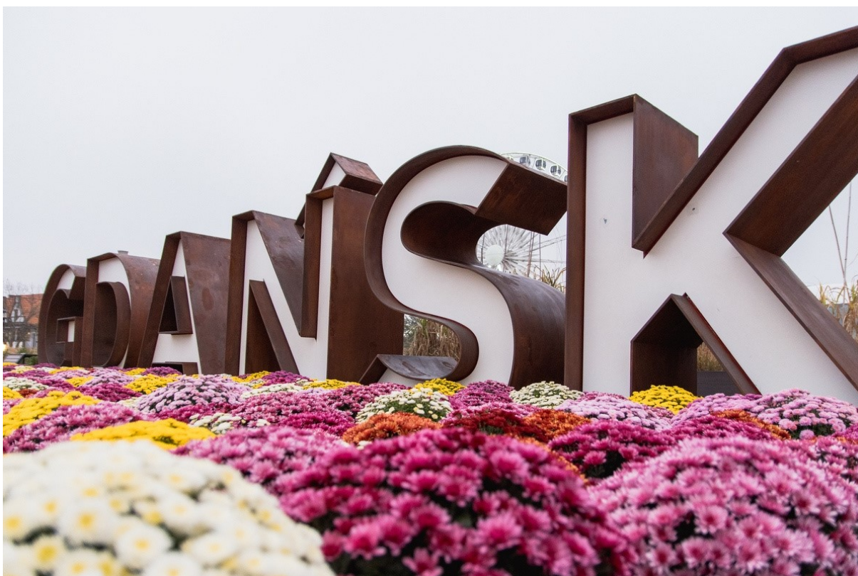
Rycina: 3. Wsparcie dla lokalnych przedsiębiorców.