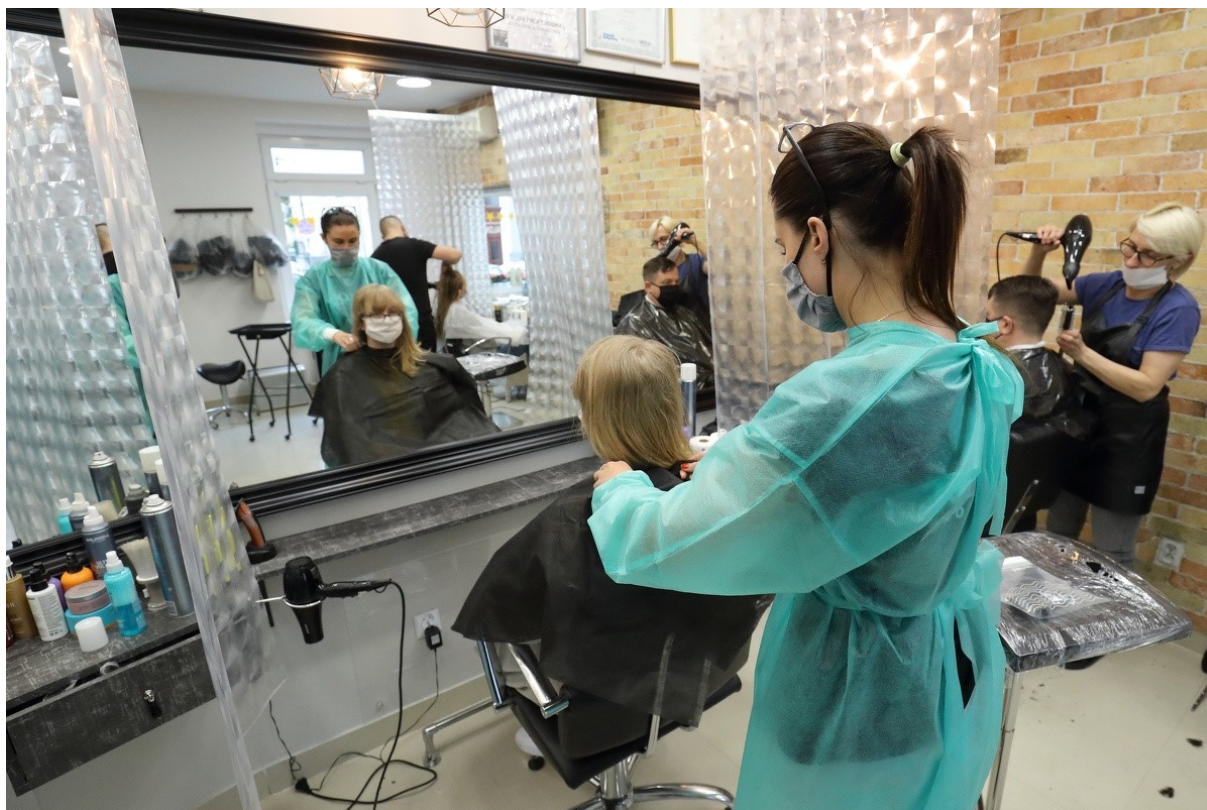
Rycina: 1. Otwarte zakłady fryzjerskie po zniesieniu obostrzeń związanych z pandemią koronawirusa.