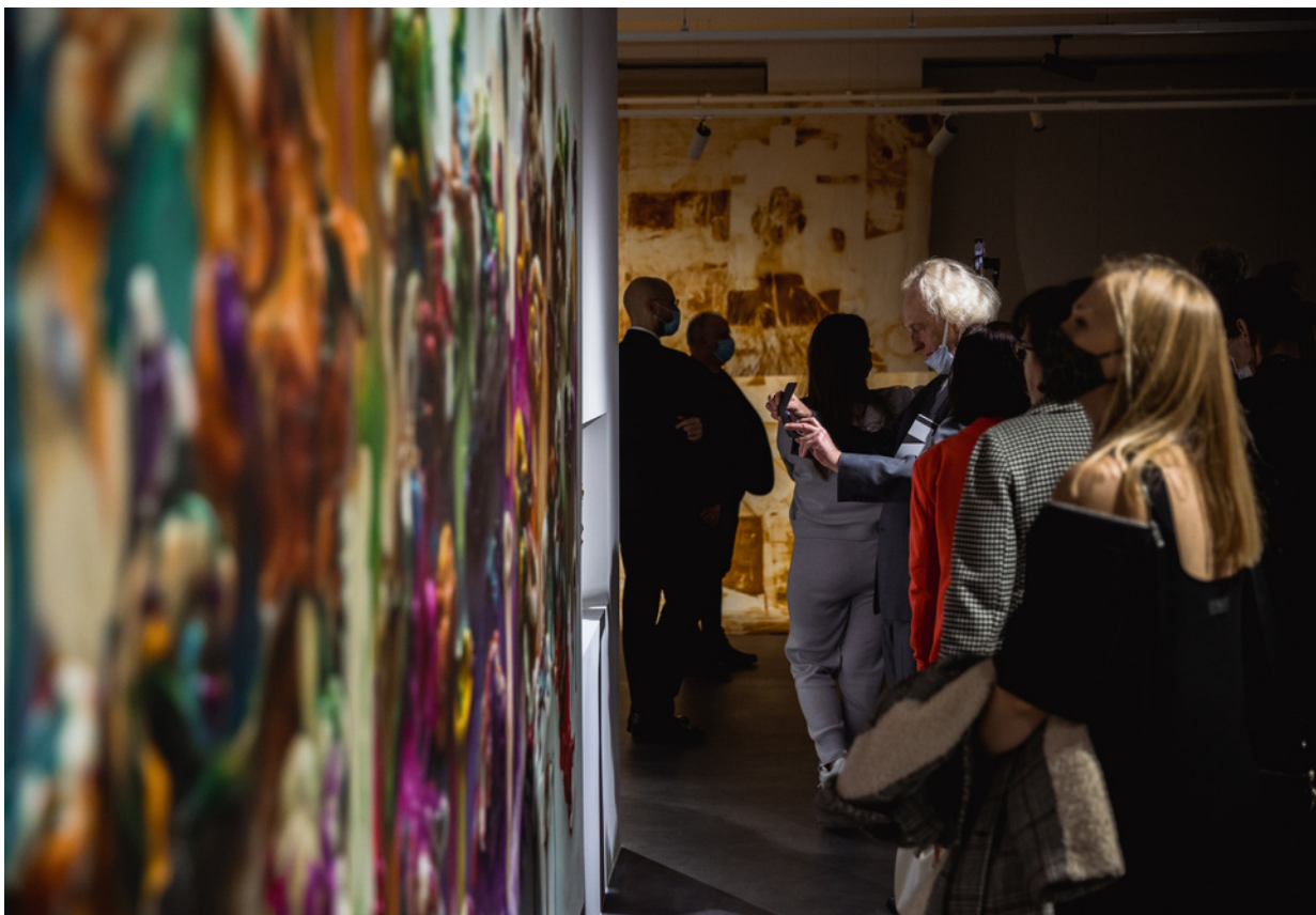
ryc. 9. Uroczyste otwarcie Nowego Muzeum Sztuki NOMUS, oddziału Muzeum Narodowego w Gdańsku.