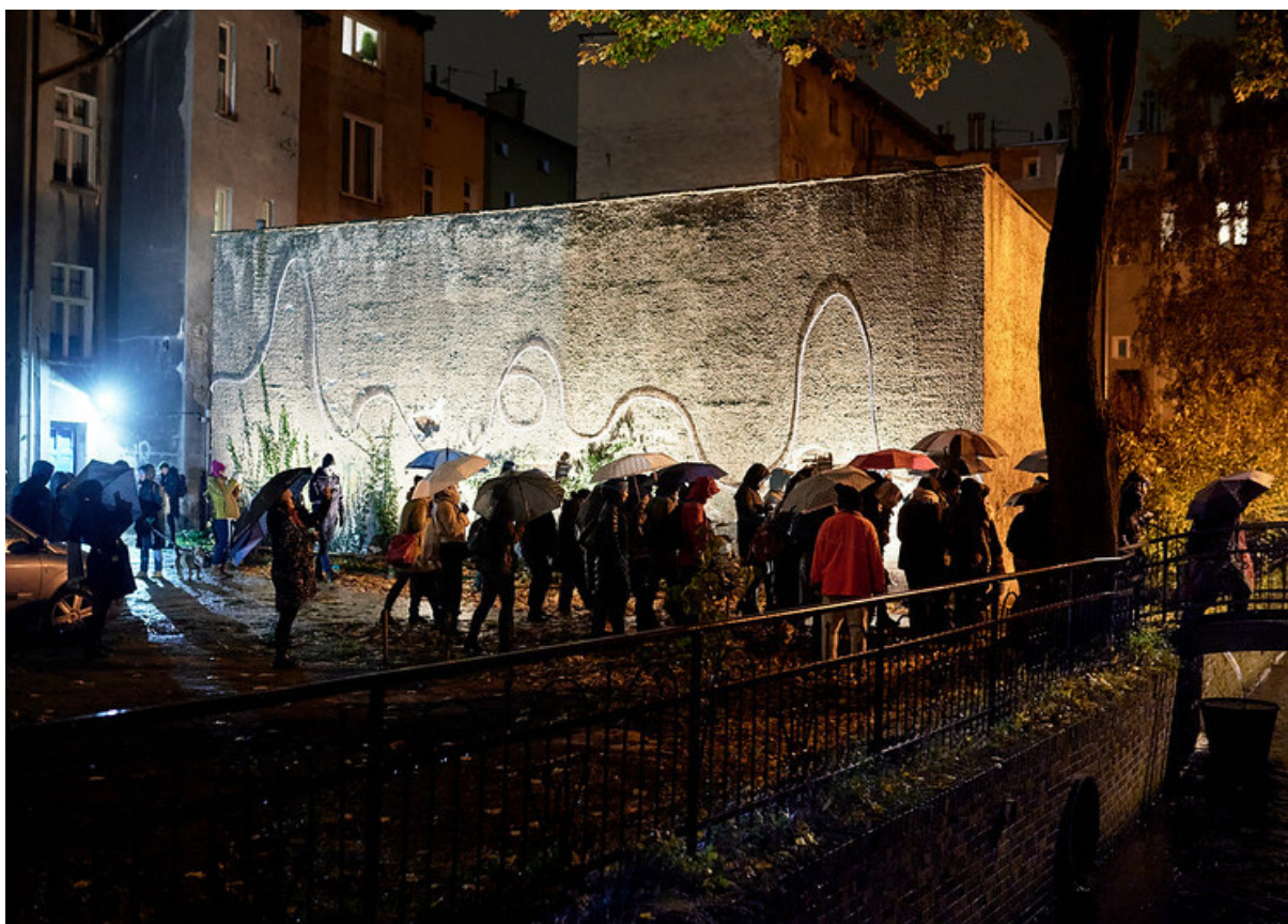
ryc. 2. Narracje #12, Dolny Wrzeszcz. Hasło edycji z 2021 r. brzmiało „Gdańsk 2080. Kongres Futurologiczny”.