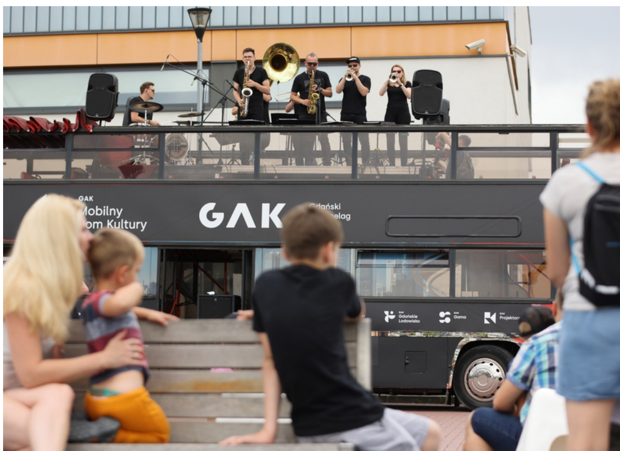
ryc. 1. Koncert w ramach Mobilnego Domu Kultury w Kokoszach, lato 2021.