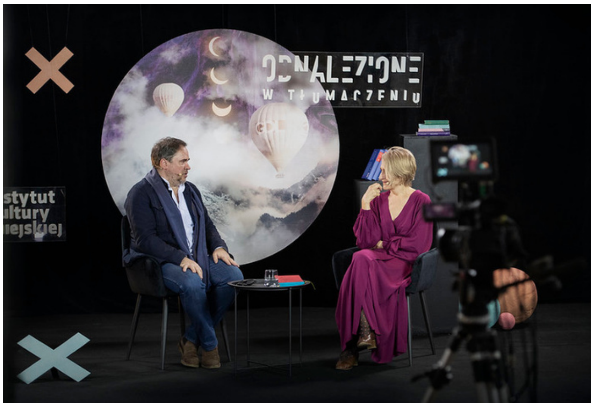
ryc. 3. 5. edycja Gdańskich Spotkań Literackich „Odnalezione w tłumaczeniu” w 2021 r. odbyła się w formule online. Motywami przewodnimi festiwalu była fantastyka, surrealizm i wyobraźnia.