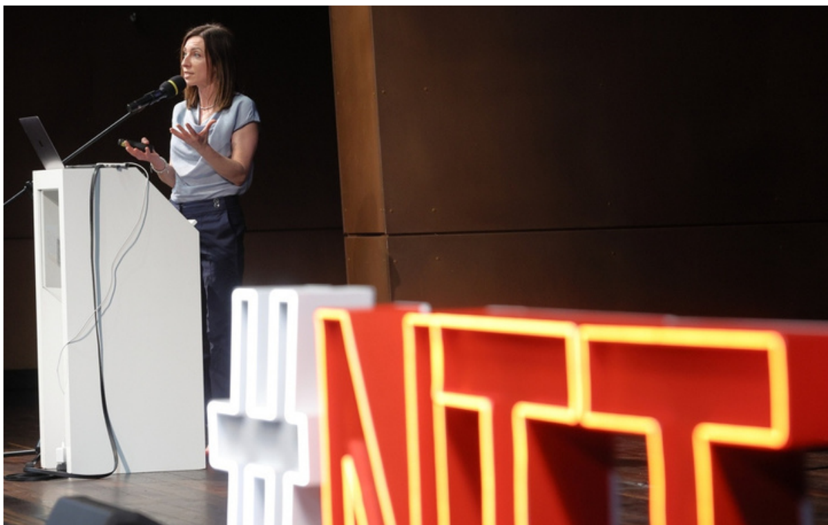
ryc. 11. Konferencja Nowe Trendy w Turystyce, ECS.