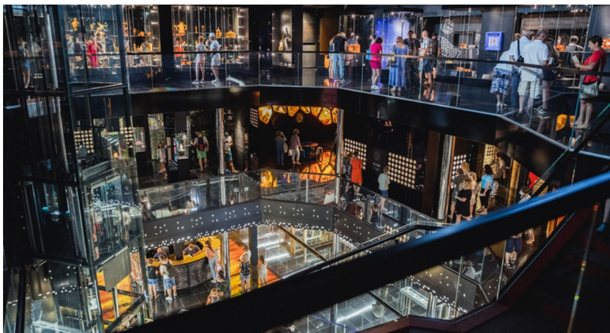
ryc. 8. Ekspozycja w nowej siedzibie Muzeum Bursztynu.