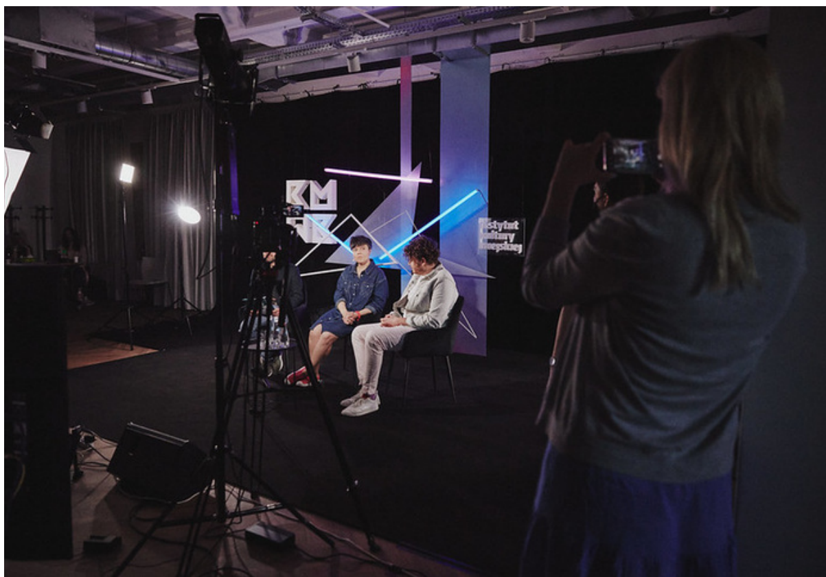
ryc. 10. Konferencja Marketing w Kulturze 2021 – 6. edycja branżowego wydarzenia dla osób zajmujących się promocją i komunikacją działań kulturalnych.