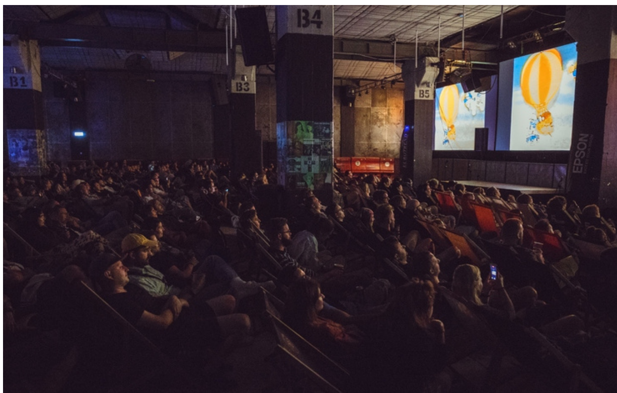
ryc. 7. Widzowie podczas seansu w ramach Octopus Film Festival.