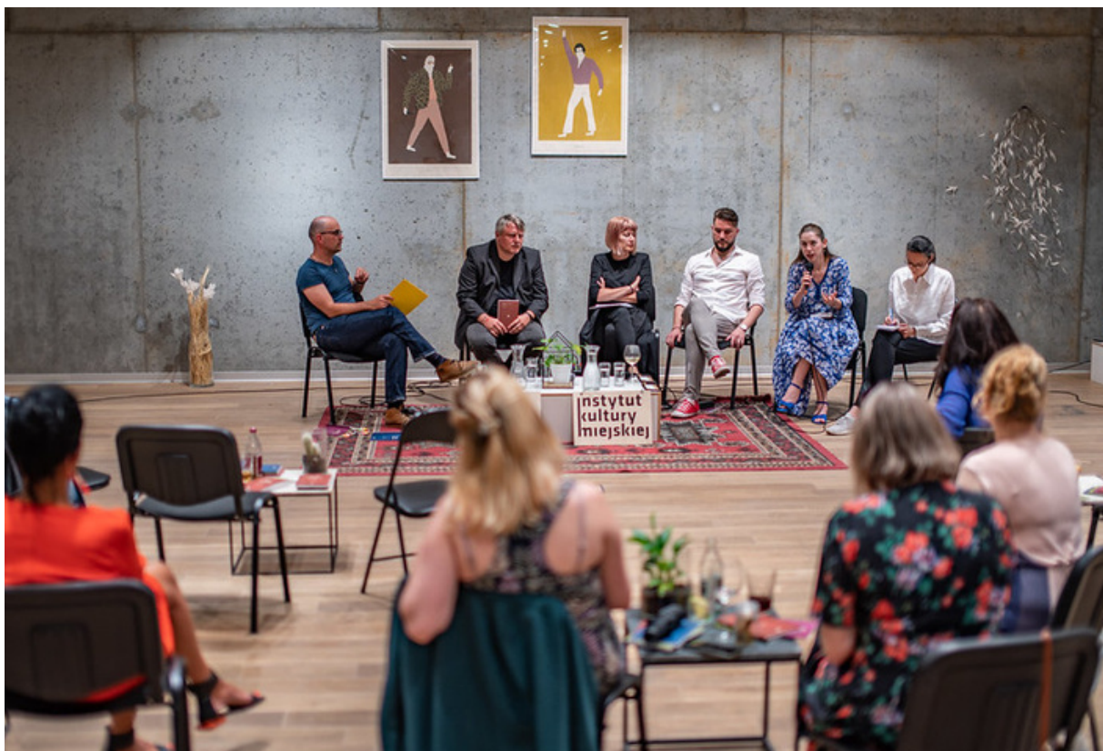
ryc. 5. Pop-up poetry – spotkania z poetami i poetkami w ramach projektu Versopolis.