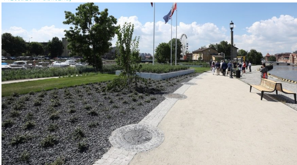
ryc. 7. Po uroczystym otwarciu Alei włazów w czerwcu 2021 r. aleja jest już dostępna dla mieszkańców i turystów.