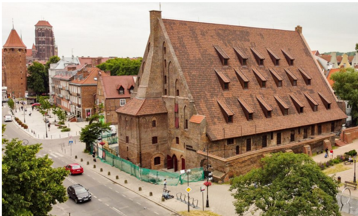
ryc. 2. Zakończenie prac remontowych nowego oddziału Muzeum Historycznego Miasta Gdańska – Muzeum Bursztynu.