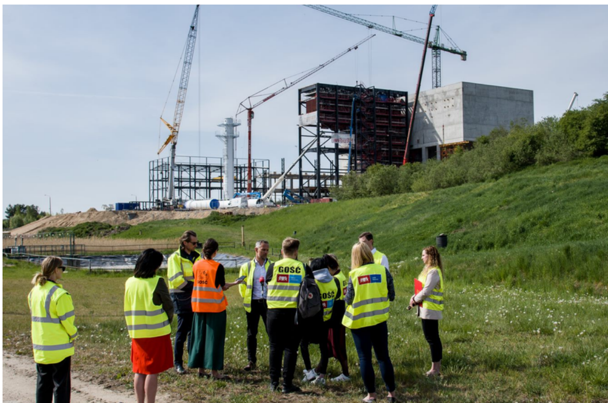
ryc. 1. Wizyta na terenie budowy Portu Czystej Energii – zakładu termicznego przekształcania odpadów.