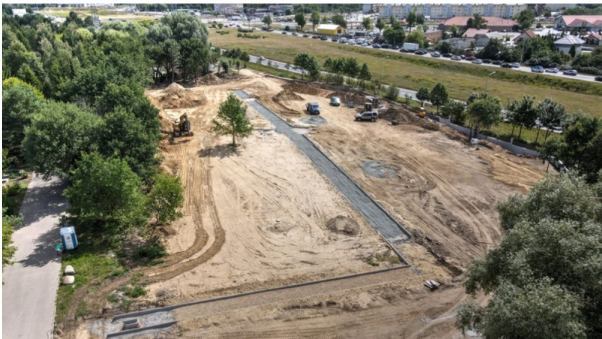
ryc. 8. Prace ziemne na terenie Cmentarza Łostowickiego w celu rozbudowy nekropolii.