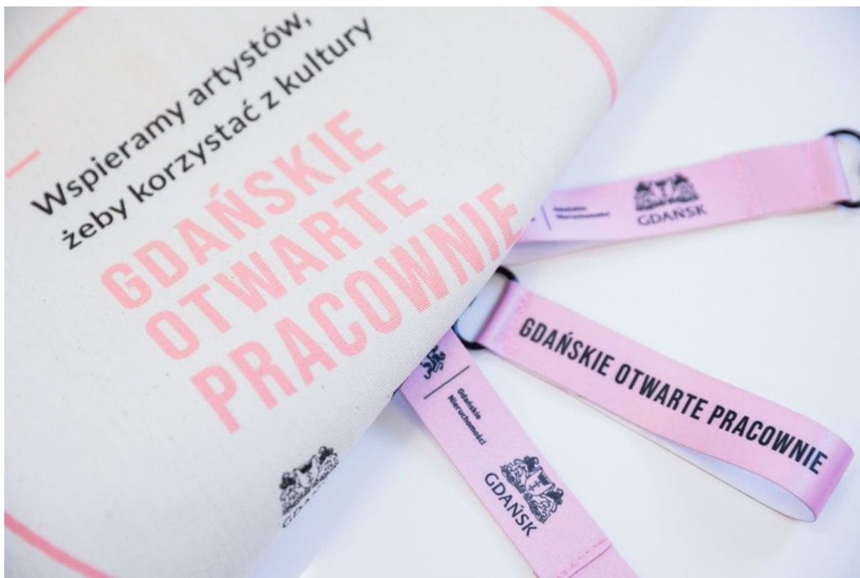
ryc. 5. W ramach programu „Gdańskie Otwarte Pracownie” udostępniono artystom lokale, w których mogą prowadzić pracę twórczą oraz sprzedaż swoich prac i usług.