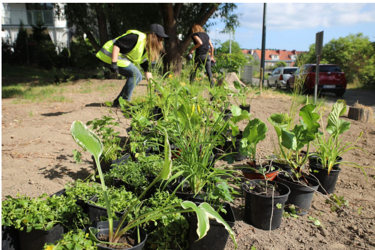
ryc. 6. Prace nad ogrodem deszczowym przy ul Sołeckiej.