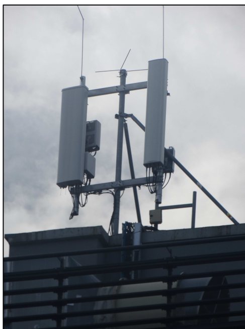
Rys. 4 Widok badanego obiektu