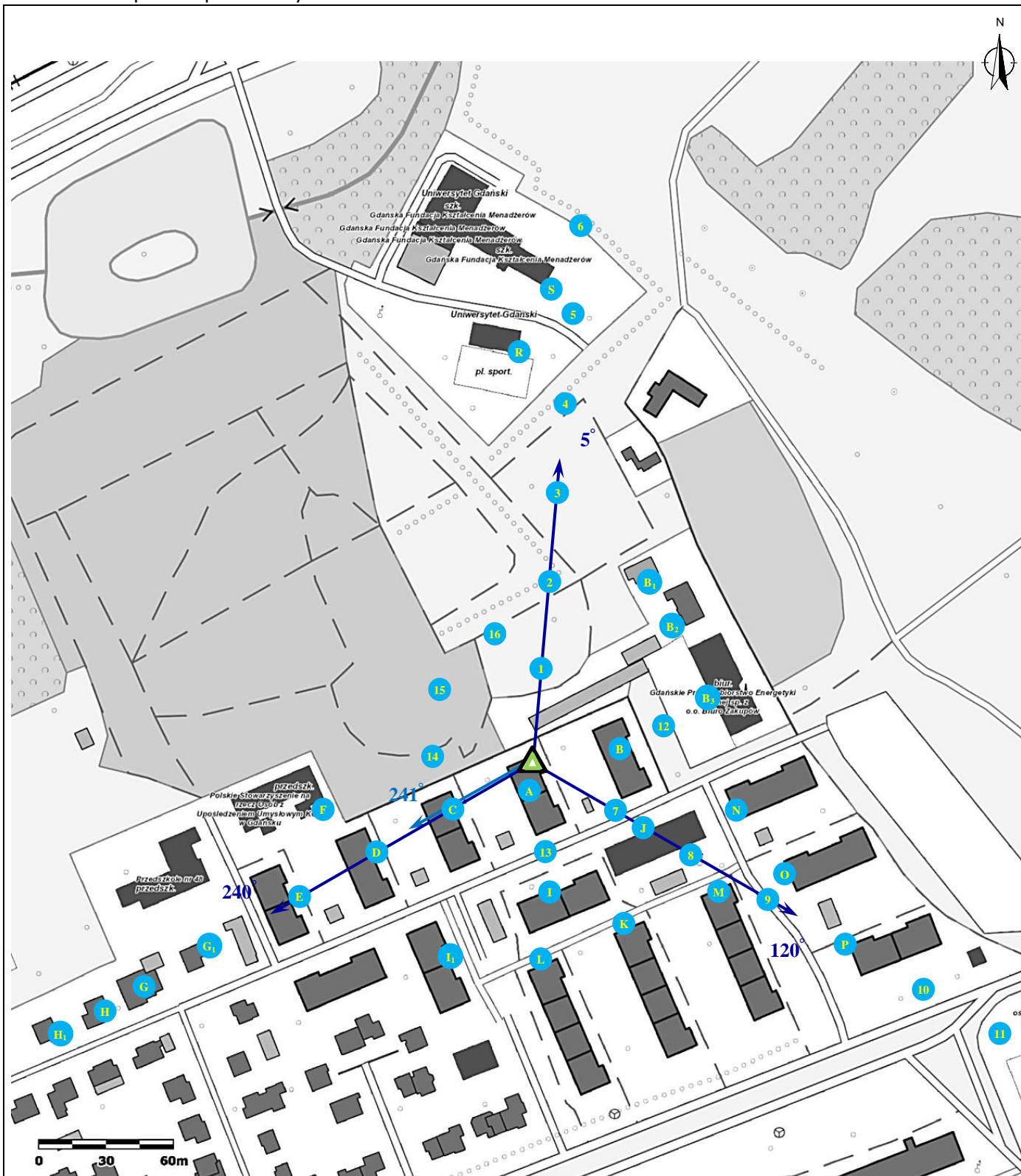
Załącznik 2. Widok pionów pomiarowych