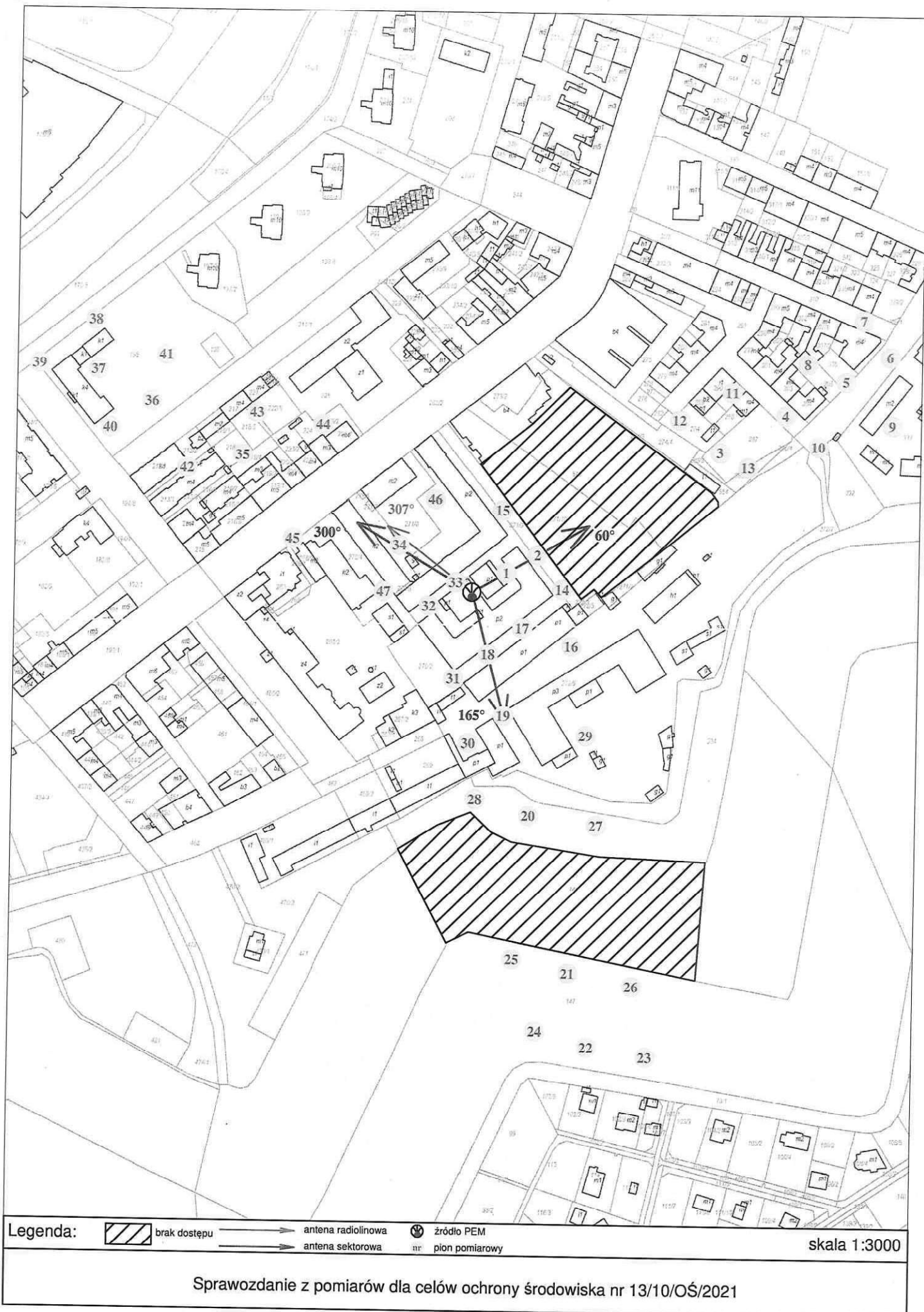
Rys. 2 Lokalizacja pionów pomiarowych