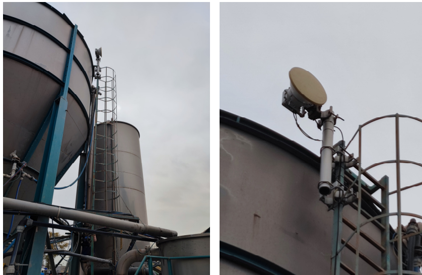
Widok obiektu wraz z zainstalowanym zespołem antenowym