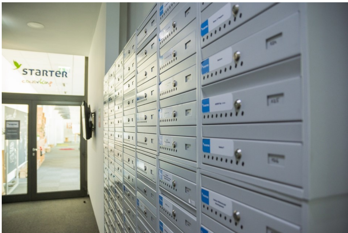
Rycina 2. Wnętrze budynku Gdańskiego Inkubatora Przedsiębiorczości „Starter”.