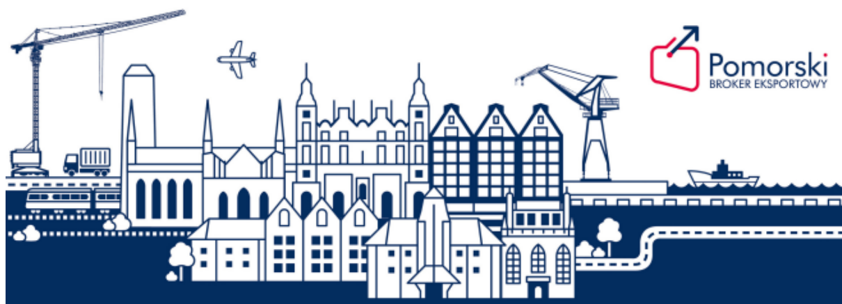
Rycina 3. Grafika projektu Pomorski Broker Eksportowy.