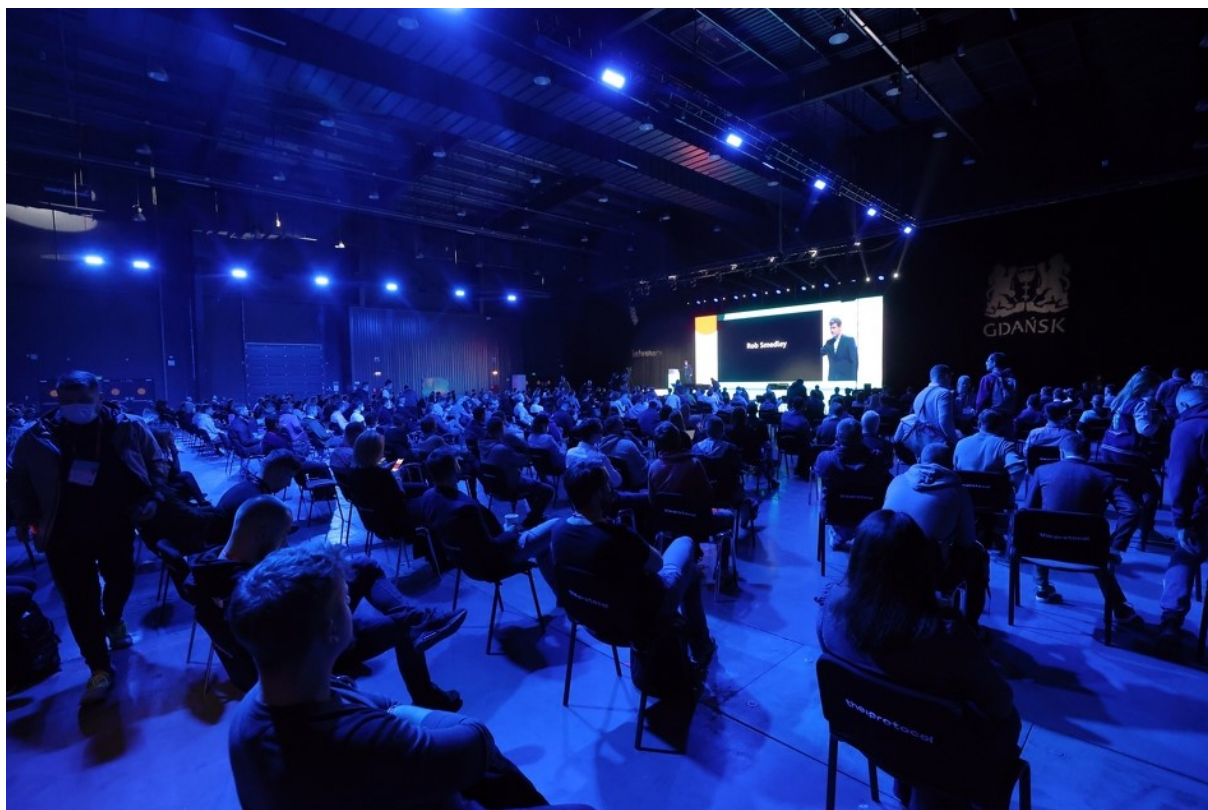
Rycina 1. Otwarcie konferencji InfoShare.