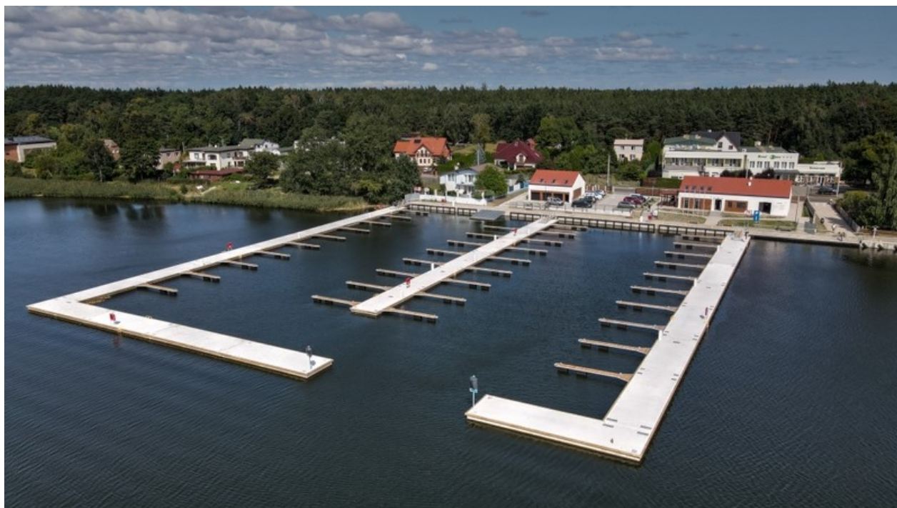
Rycina 1. Przystań żeglarska Sobieszewo Nadwiślańska.