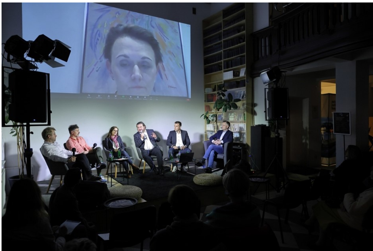
Rycina 4. Konsultacje społeczne dotyczące parku kulturowego.