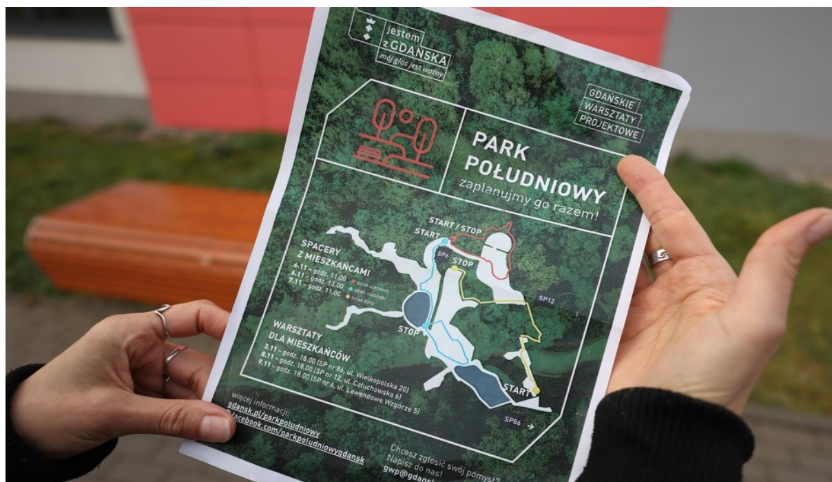
Rycina 3. Plakat promujący konsultacje społeczne w sprawie Parku Południowego.