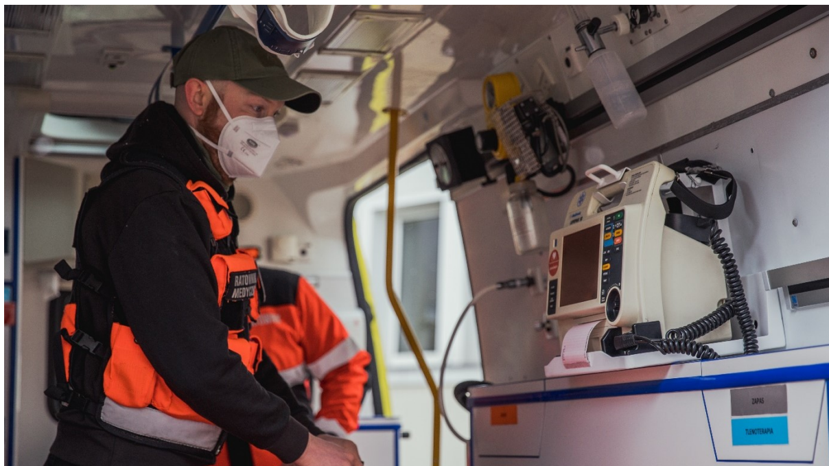
Rycina 4. Nowy defibrylator w gdańskim ambulansie.

dekontaminacji powietrza o łącznej wartości ponad 45 tys. zł, które są wykorzystywane na szpitalnych oddziałach ratunkowych Copernicus Podmiot Leczniczy Sp. z o.o.