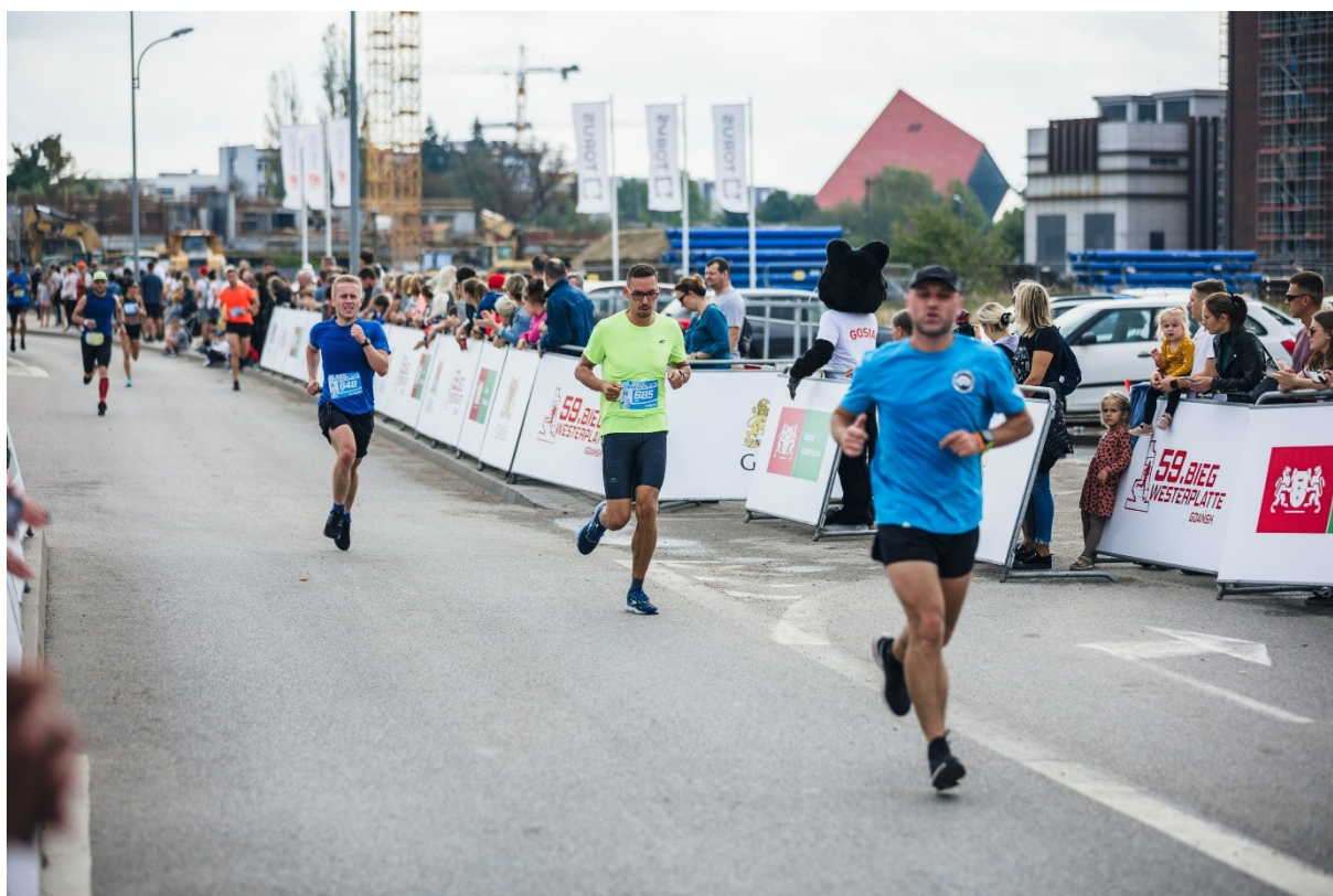
Rycina 2. 59. Bieg Westerplatte.