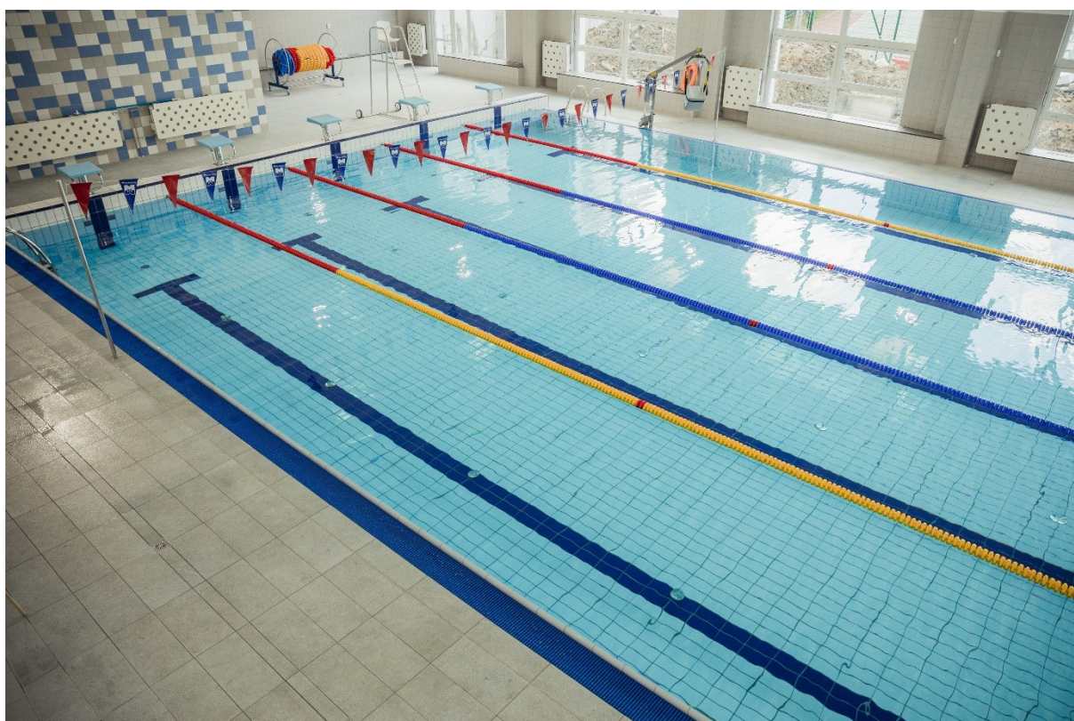
Rycina 3. Zmodernizowany basen w Zespole Szkolno-Przedszkolnym nr 2 przy ulicy Czajkowskiego.