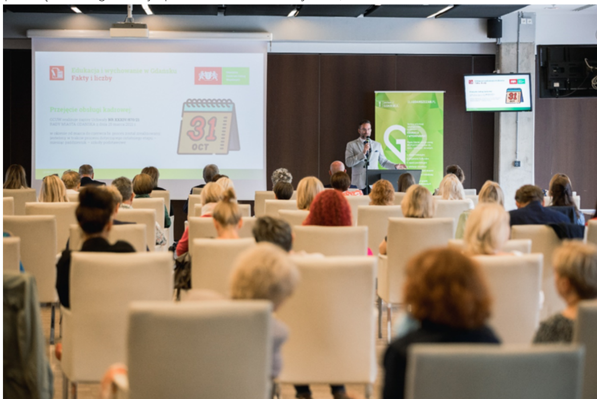
ryc. 1. Spotkanie dyrektorów i wicedyrektorów miejskich placówek oświatowych poświęcone organizacji i planom na rok szkolny 2021/2022.