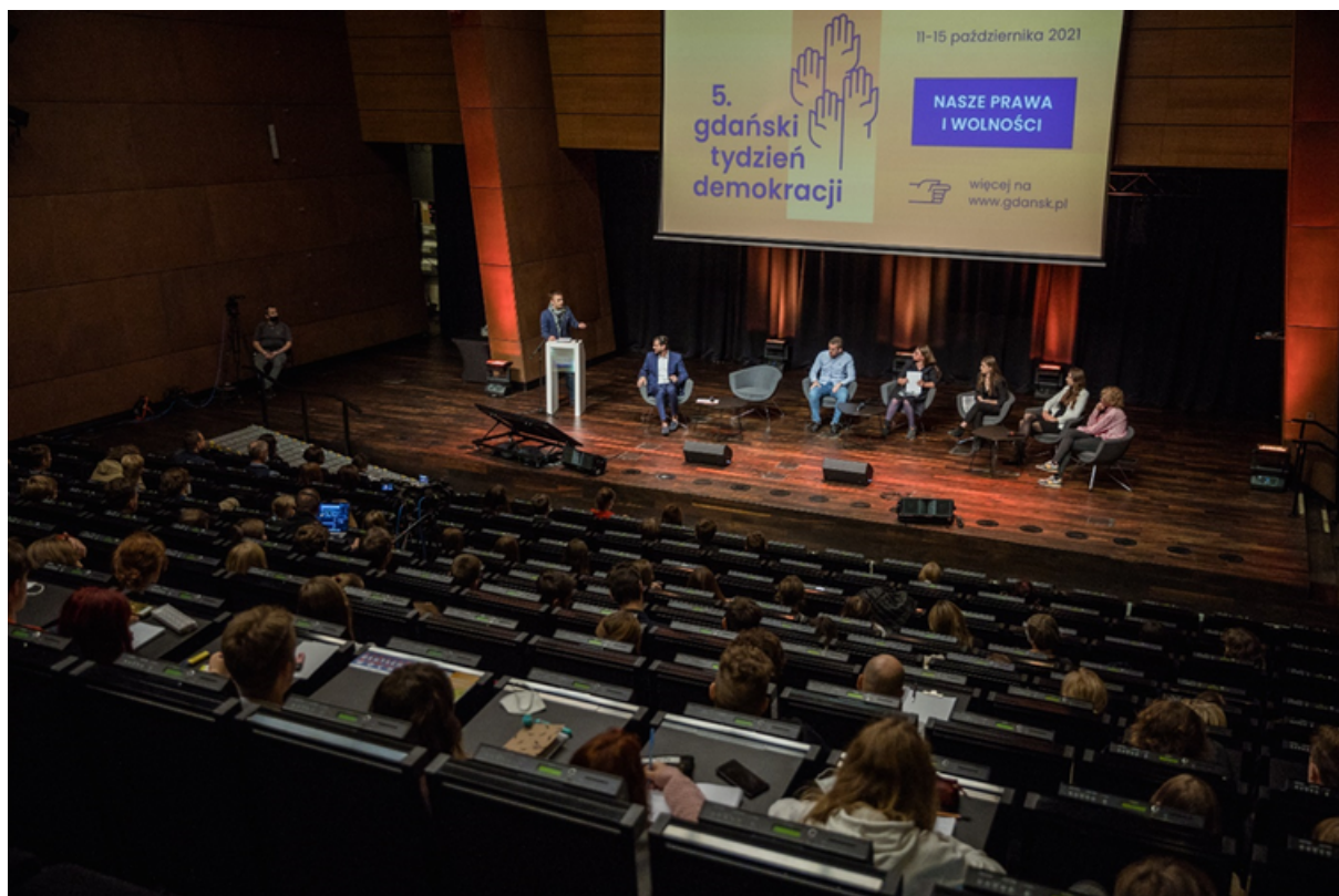
ryc. 2. Lekcje Obywatelskie w ramach 5. Gdańskiego Tygodnia Demokracji.