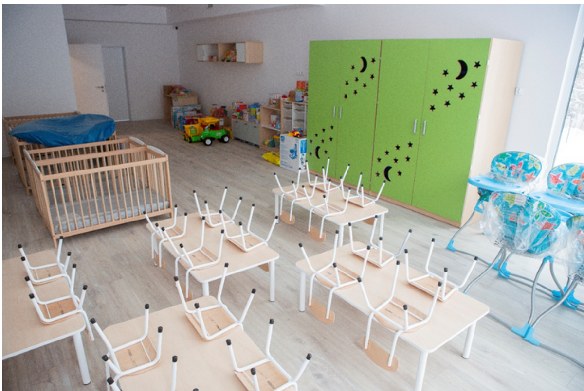
ryc. 3. Nowy żłobek w Gdańsku-Osowej zbudowany przez Fundację Pozytywne Inicjatywy.