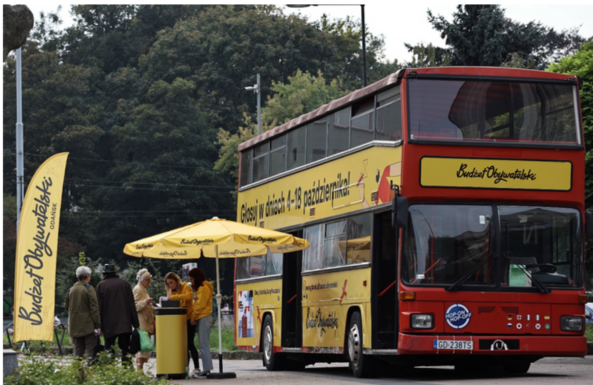
ryc. 3. Punkt konsultacyjny podczas głosowania na Budżet Obywatelski 2022.