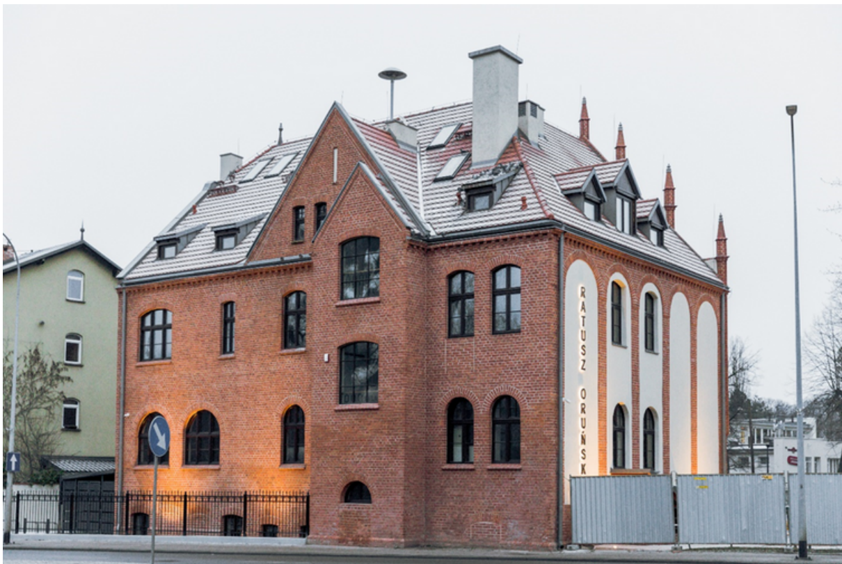
ryc. 2. Budynek dawnego ratusza przy ul. Gościnnej 1 po zakończeniu robót budowlanych i adaptacji budynku na cele społeczne.