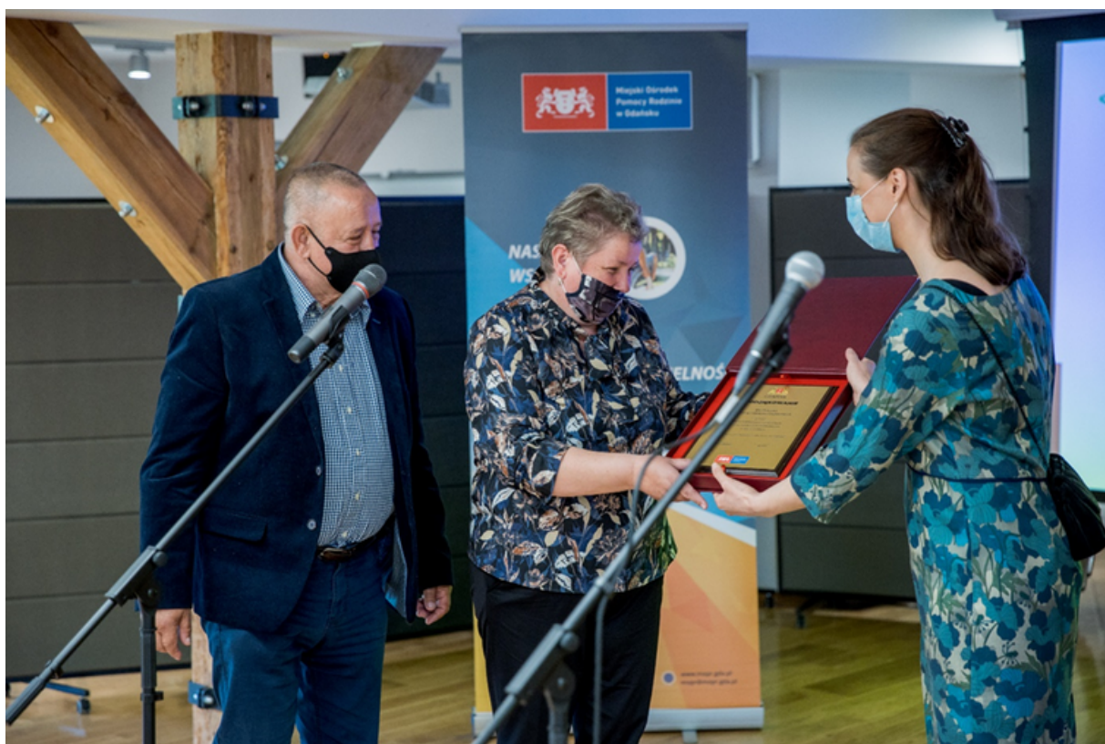
ryc. 5. Uroczyste wręczenie podziękowań rodzicom zastępczym z okazji Dnia Rodzicielstwa Zastępczego.