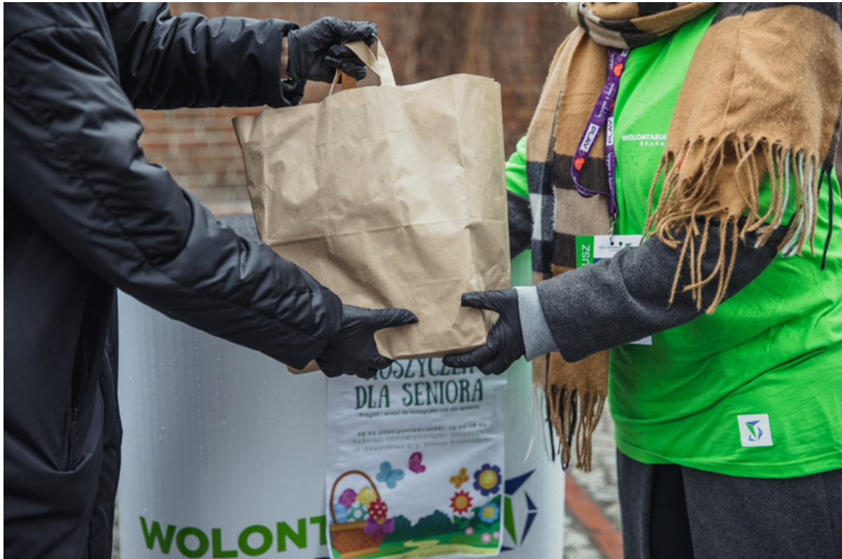
ryc. 1. Akcja „koszycek dla seniora” – wsparcie seniorów i osób z niepełnosprawnościami w okresie przedświątecznym w 2021 r.