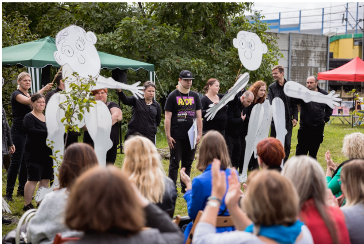
ryc. 6. Spektakl teatralny podczas obchodów 10-lecia projektu Osiedla Sitowie.