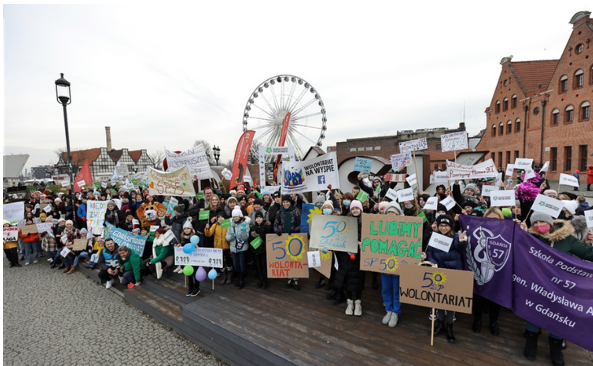
ryc. 4. Gdański Tydzień Wolontariatu – Parada Wolontariuszy w 2021 r.