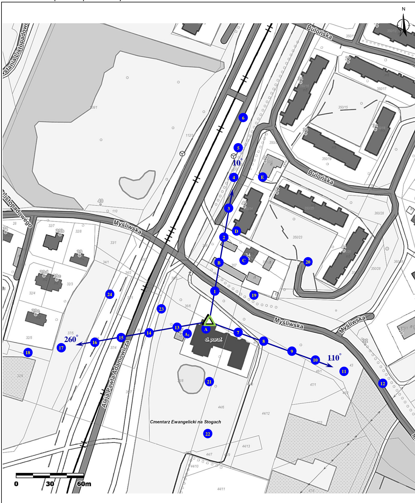
Załącznik 2. Widok pionów pomiarowych