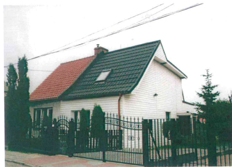
Budynki przy ul. Nad Jarem: nr 48 i 49 od północnego wschodu (fot. po stronie lewej) oraz od ulicy. Poniżej: numery 50 i 51 (fot. po stronie lewej) oraz nr 52 i 53 (fot. po stronie prawej), 2003 r.