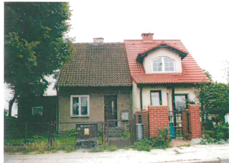
Budynki przy ul. Nad Jarem: fot. po stronie lewej numery 30 i 30a, fot. po stronie prawej numery 31 i 31a. Poniżej: numery 32 i 33 (fot. po stronie lewej) oraz nr 36 i 37 (fot. po stronie prawej), 2003 r.