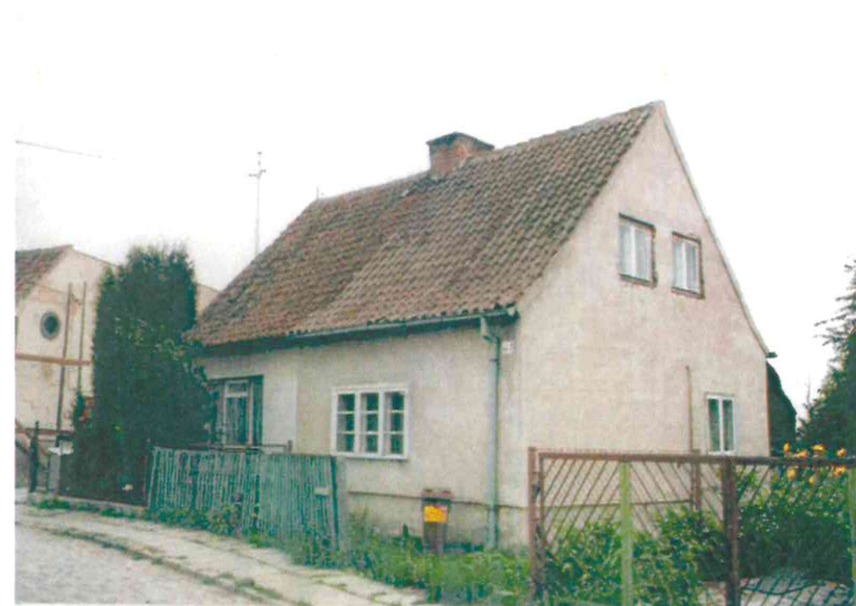
Budynki przy ul. Nad Jarem: nr 44 i 45 od wschodu (fot. po stronie lewej) i od północy (fot. po stronie prawej). Poniżej: numery 46 i 47 od zachodu (fot. po stronie lewej) oraz od północy (fot. po stronie prawej), 2003 r.