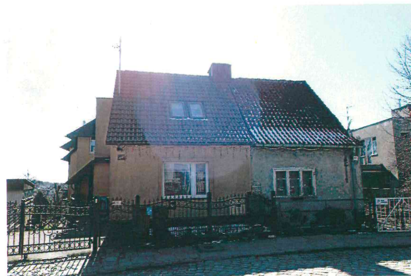
Budynki przy ul. Nad Jarem: nr 42 i 43 (fot. po stronie lewej) oraz nr 44 i 45 (fot. po stronie prawej). Poniżej: nr 46 i 47 (fot. po stronie lewej) oraz nr 48 i 49 (fot. po stronie prawej), 2023 r. , fot. O. Drożdziejcka