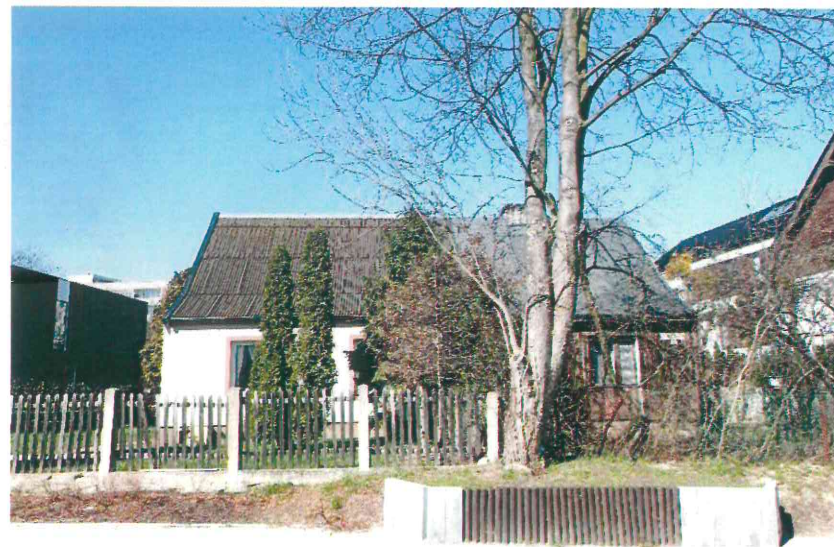
Budynki przy ul. Nad Jarem: nr 17 i 18 (fot. po stronie lewej) oraz nr 21 i 22 (fot. po stronie prawej). Poniżej: nr 25 (fot. po stronie lewej) oraz nr 29 i 29a (fot. po stronie prawej), 2023 r.