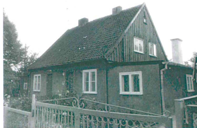
Budynki przy ul. Nad Jarem: fot. po stronie lewej numery 29 i 29a, fot. po stronie prawej numery 31 i 31a. Poniżej: numery 48 i 49 (fot. po stronie lewej) oraz nr 52 i 53 (fot. po stronie prawej), 1982 r.