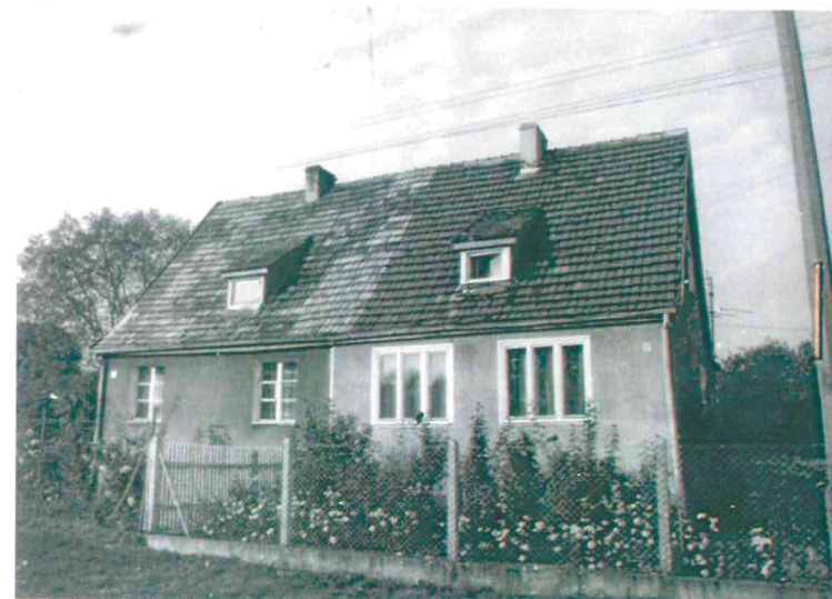
Budynki przy ul. Nad Jarem: fot. po stronie lewej numery 3 i 4, fot. po stronie prawej numery 9 i 10. Poniżej: numery 11 i 12 (fot. po stronie lewej) oraz nr 17 i 18 (fot. po stronie prawej), 1982 r.