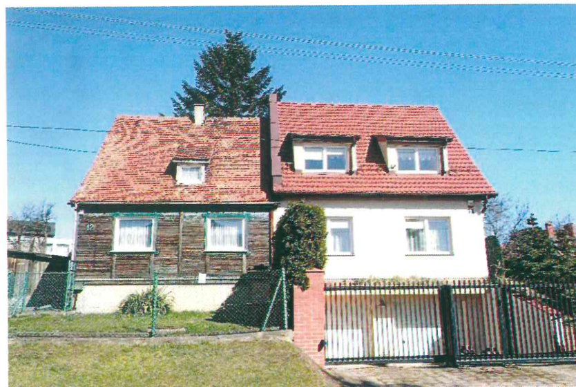
Budynki przy ul. Nad Jarem: nr 9 i 10 (fot. po stronie lewej) oraz nr 11 i 12 (fot. po stronie prawej). Poniżej: numery 13 i 14 (fot. po stronie lewej) oraz nr 15 [nie włączony do ewidencji zabytków] i 16 (fot. po stronie prawej), 2023 r.