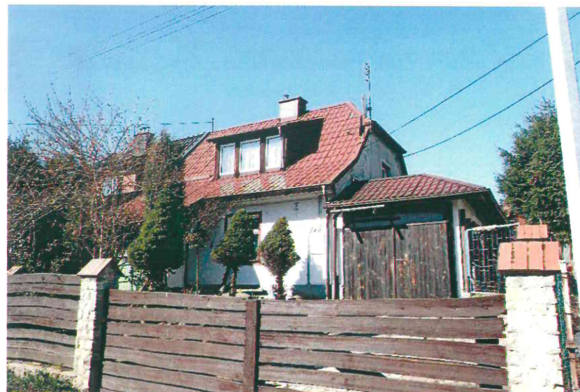
Budynki przy ul. Nad Jarem: nr 2 wraz z pozostałościami nr 1 (fot. po stronie lewej) oraz nr 3 i 4 (fot. po stronie prawej). Poniżej: numery 3 i 4 (fot. po stronie lewej) oraz nr 5 i 6 (fot. po stronie prawej), 2023 r.