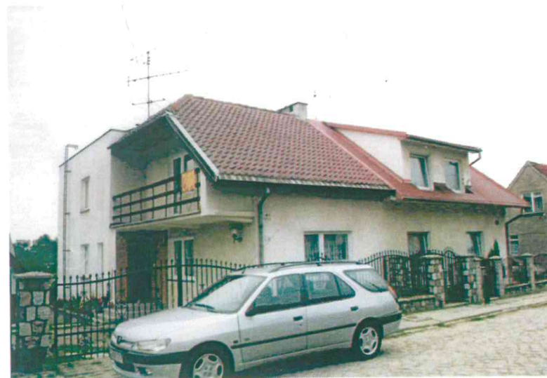
Budynki przy ul. Nad Jarem: fot. po stronie lewej numery 38 i 39, fot. po stronie prawej numery 40 i 41. Poniżej: numery 42 i 43 od wschodu (fot. po stronie lewej) oraz od północy (fot. po stronie prawej), 2003 r.