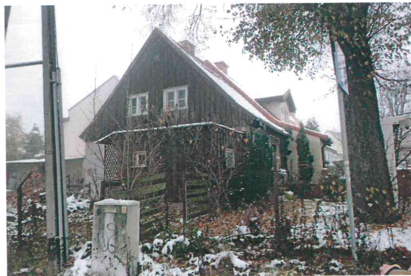
Budynki przy ul. Nad Jarem: nr 30 i 30a (fot. po stronie lewej) oraz nr 31a (fot. po stronie prawej). Ponizej: nr 32 i 33 (fot. po stronie lewej) oraz nr 36 i 37 (fot. po stronie prawej), 2023 r.