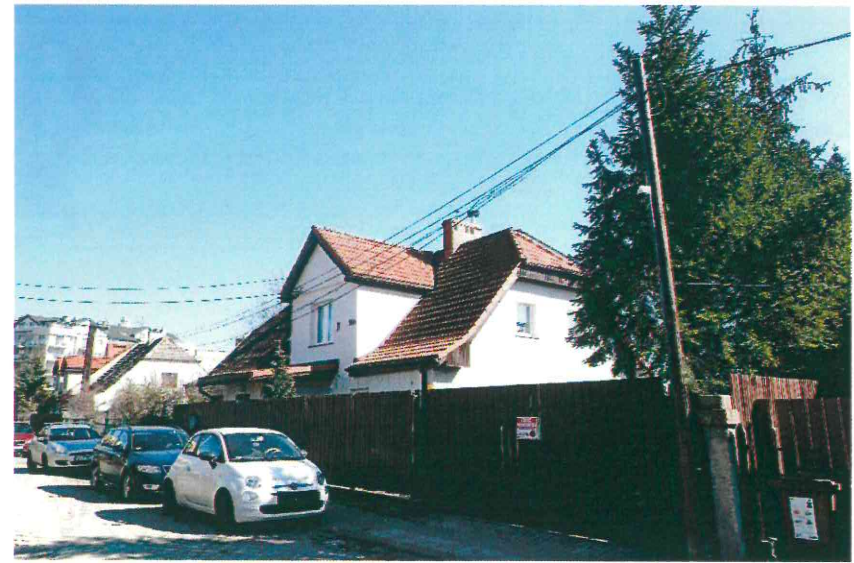
Budynki przy ul. Nad Jarem: nr 30 i 30a (fot. po stronie lewej) oraz nr 31a (fot. po stronie prawej). Poniżej: nr 32 i 33 (fot. po stronie lewej) oraz nr 36 i 37 (fot. po stronie prawej), 2023 r.