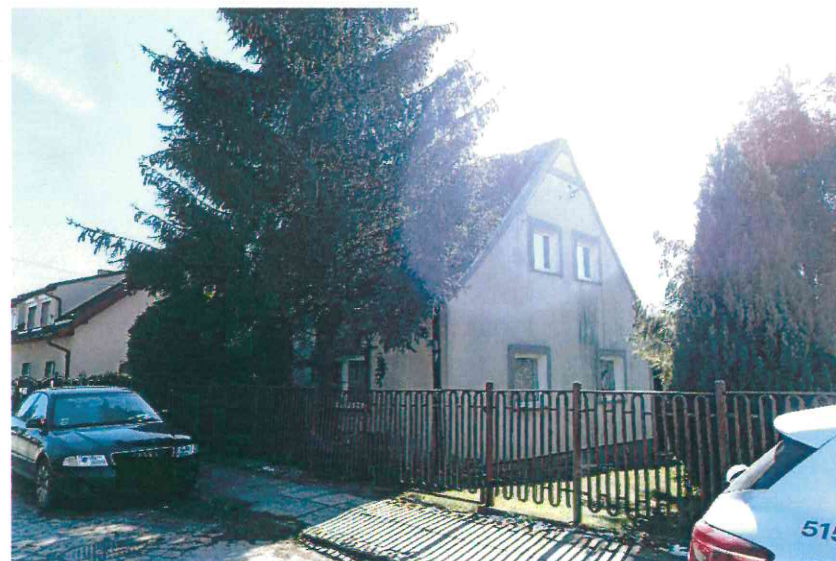
Budynki przy ul. Nad Jarem: nr 36 (fot. po stronie lewej) oraz nr 38 (fot. po stronie prawej). Poniżej: nr 39 (fot. po stronie lewej) oraz nr 40 i 41 (fot. po stronie prawej), 2023 r.