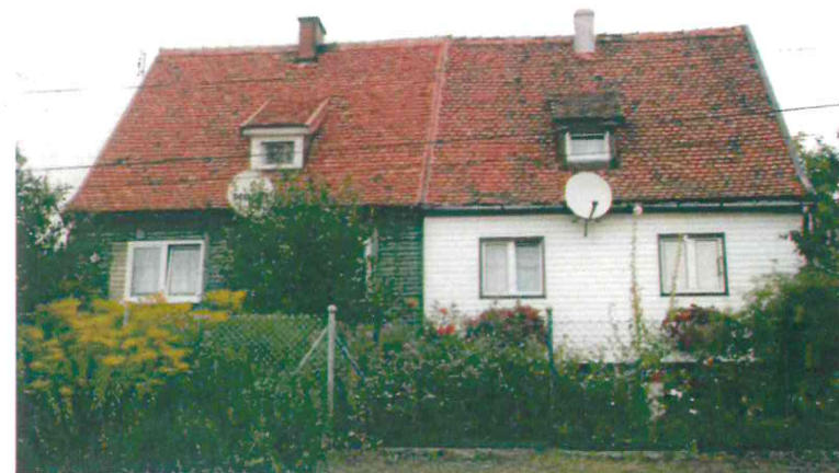
Budynki przy ul. Nad Jarem: fot. po stronie lewej numery 11 i 12, fot. po stronie prawej numery 13 i 14. Poniżej: numery 16 (fot. po stronie lewej) oraz nr 17 i 18 (fot. po stronie prawej), 2003 r.