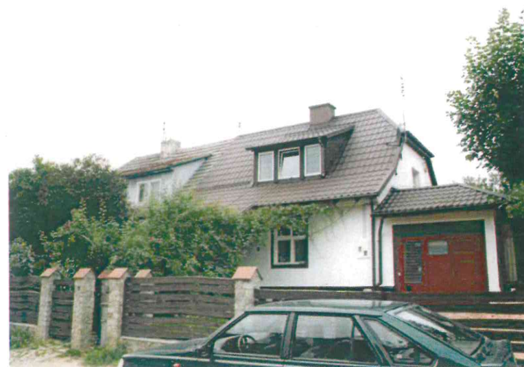
Budynki przy ul. Nad Jarem: fot. po stronie lewej numery 1 i 2, fot. po stronie prawej numery 3 i 4. Poniżej: numery 5 i 6 (fot. po stronie lewej) oraz nr 9 i 10 (fot. po stronie prawej), 2003 r.