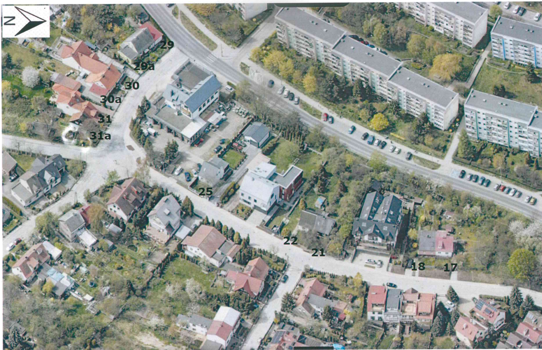
Widok w kierunku zachodnim na fragment osiedla (część ul. Nad Jarem, poniżej ul. Skarpowej).