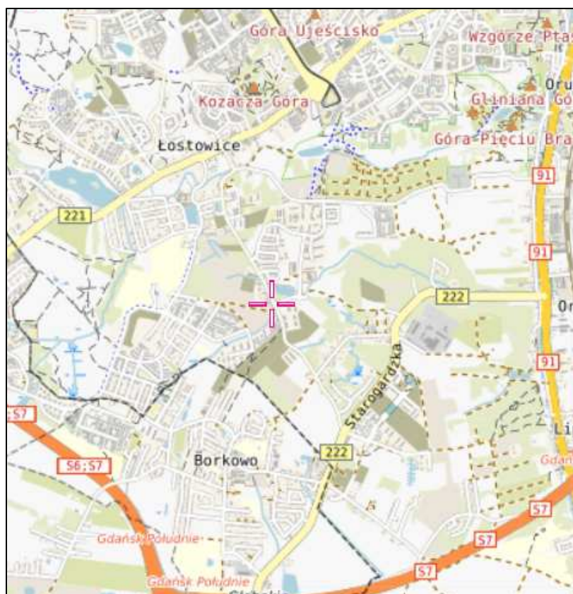
Rys. 1 Lokalizacja badanego obiektu