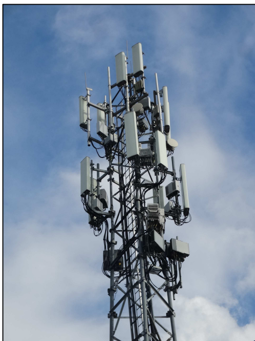
Rys. 3 Widok badanego obiektu