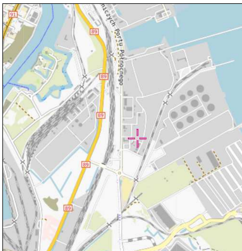
Rys. 1 Lokalizacja badanego obiektu