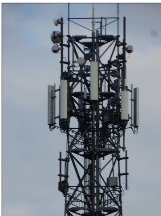
Rys. 3 Widok badanego obiektu