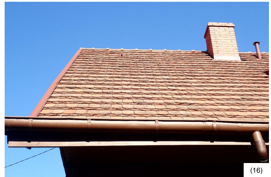
Budynek o nr 94, ganek (13), elewacja południowa (14), wejście do piwnicy znajdujące się po południowej stronie budynku (15), fragment wschodniej połaci dachu (16).