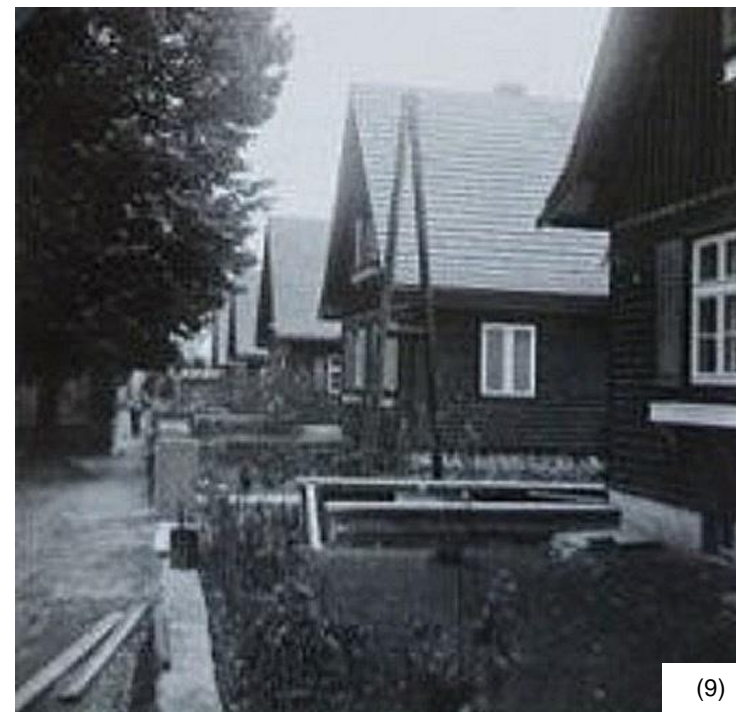
(8) Budynki przy ul. Polanki 93-96, lata 50. XX w.(?), (źródło: http://www.dawnaoliwa.pl/opisy/ulice/nr/polanki090-099.html , dostęp: 29.05.2023 r.); (9) Budynki przy ul. Polanki 93-97, 1941 r., (źródło: http://www.dawnaoliwa.pl/opisy/ulice/nr/polanki090-099.html , dostęp: 29.05.2023 r.).