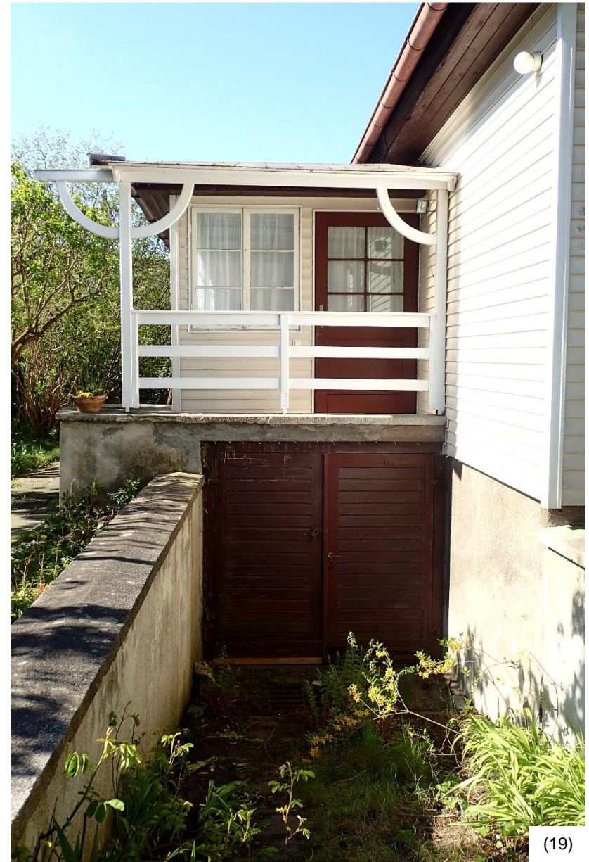
Budynek o nr 95, elewacja frontowa (17), okna zlokalizowane na pierwszym pięttrze budynku (18), ganek i garaż (15).