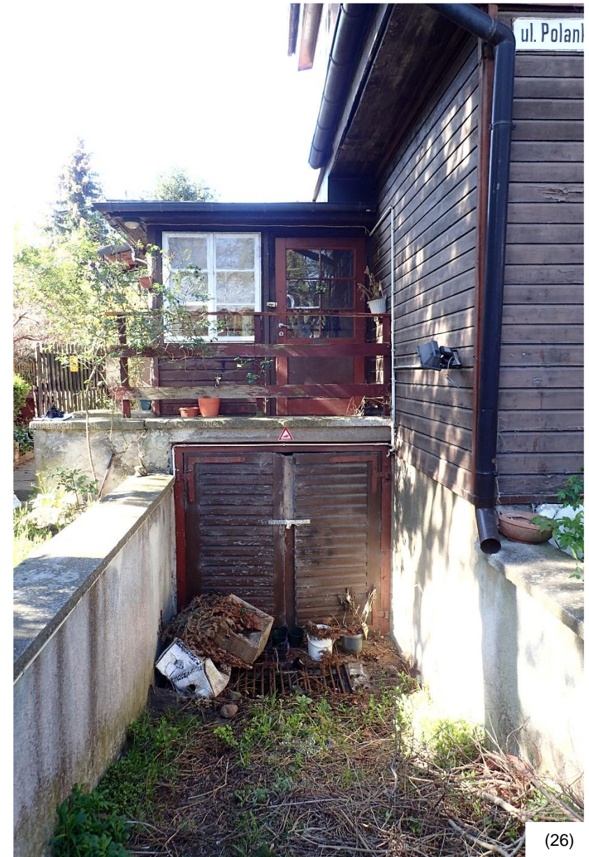
Budynek o nr 97, elewacja północna i wschodnia budynku (24); elewacja zachodnia (25), ganek i garaż (26).