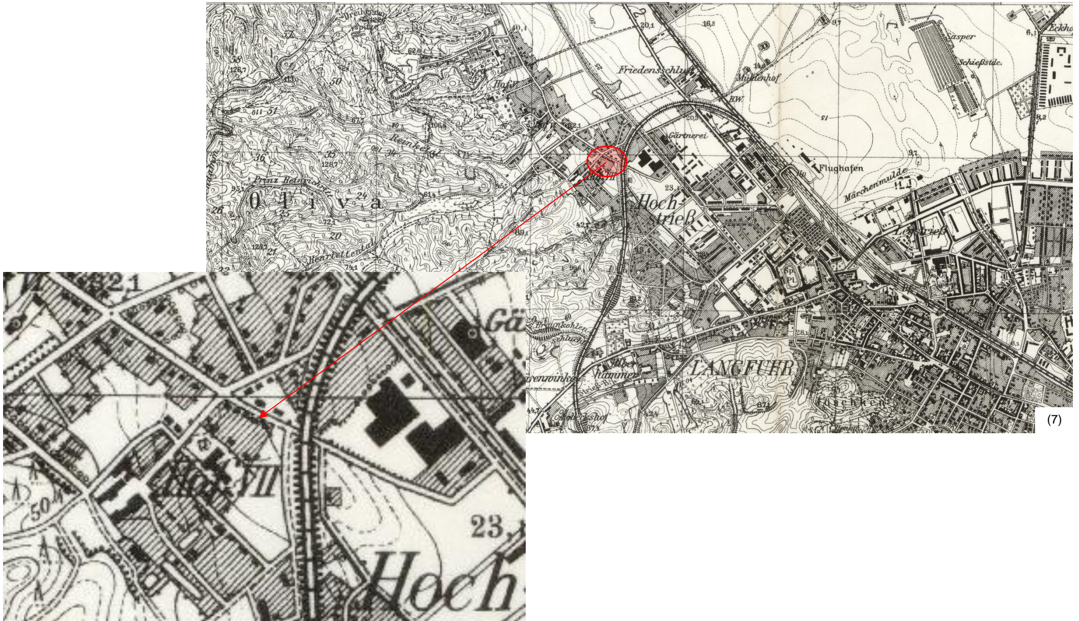
(7) Fragment Topographische Karte 1:25 000 (Meßtischblatt), 1910 (ostatnia korekta 1942 r., rok wydania 1944). Kolorem czerwonym oznaczono położenie budynków przy ul. Polanki 93-97- źródło: http://maps.mapywig.org/m/German_maps/series/025K_TK25/1677_Danzig_1944_600dpi_AMPG.jpg , dostęp: 30.05.2023 r.