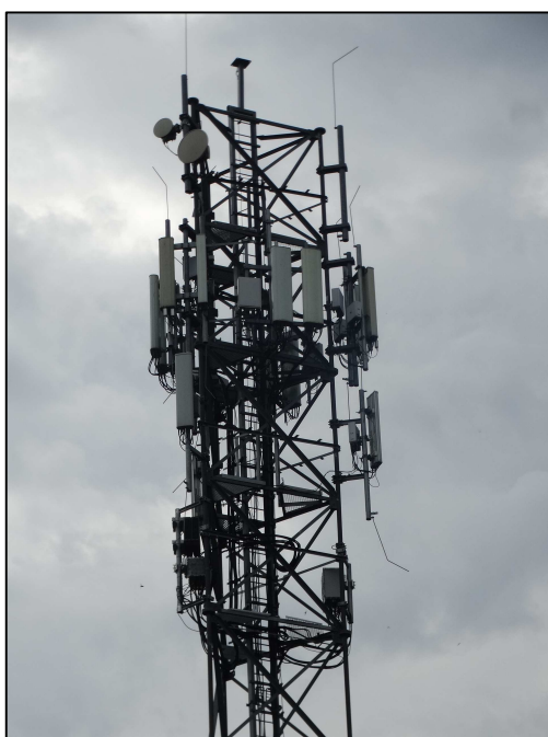
Rys. 4 Widok badanego obiektu