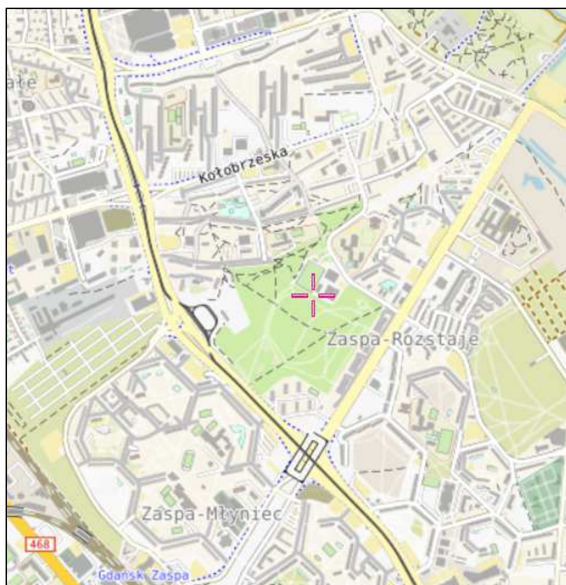
Rys. 1 Lokalizacja badanego obiektu