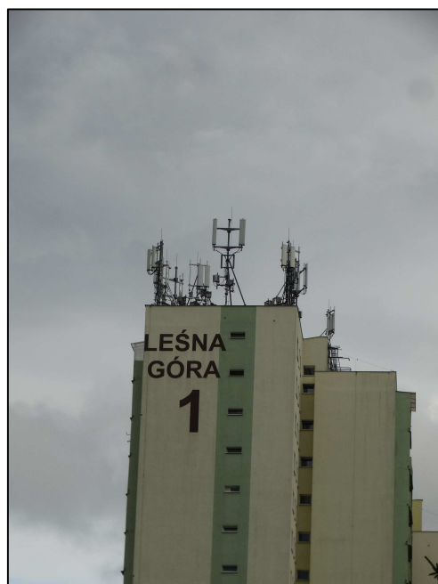
Rys. 3 Widok badanego obiektu