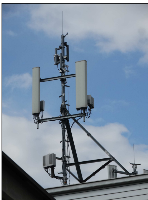
Rys. 3 Widok badanego obiektu