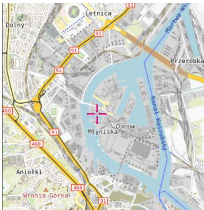
Rys. 1 Lokalizacja badanego obiektu