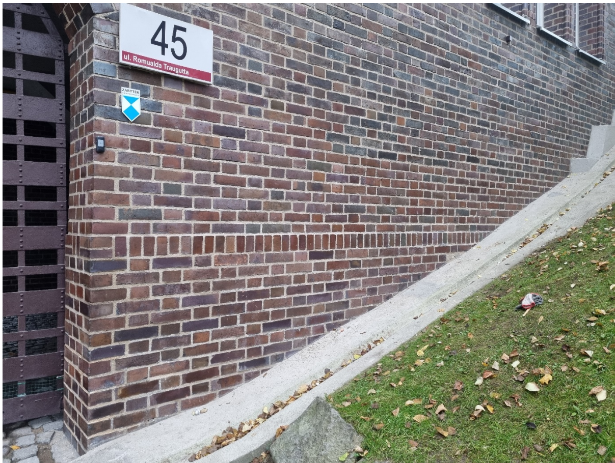
Fragmenty elewacji od strony wjazdowej na dziedziniec /strona północna/