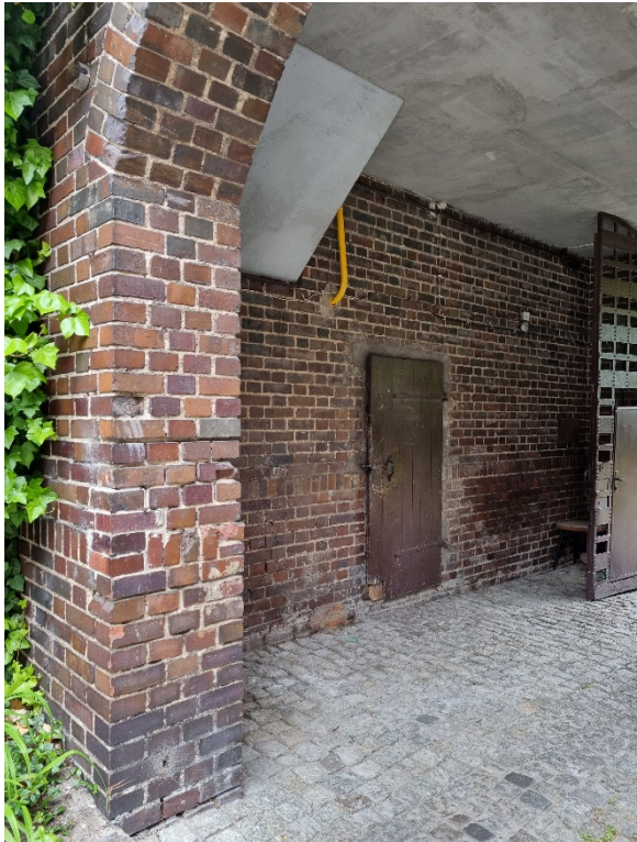
Ściany ceglane wnętrza bramy przejazdowej z widocznymi ubytkami w spoinowaniu , zabrudzeniami oraz uszkodzeniami mechanicznymi cegieł