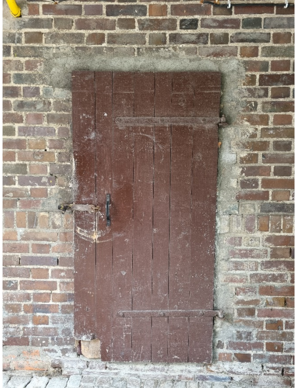
Wtórne przemurowanie ościeża drzwiowego /przemurowanie wykonane na zaprawie cementowej, na cegle pozostałości zaprawy/