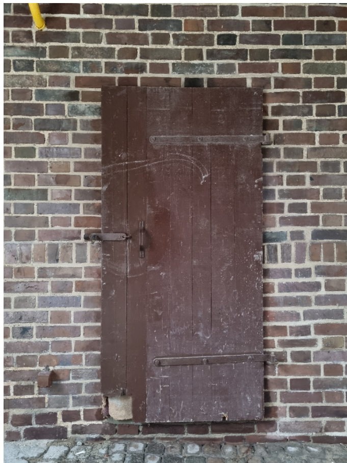
Fragmenty ścian wnętrza bramy wjazdowej na dziedziniec Zespołu Budynków Parafialnych