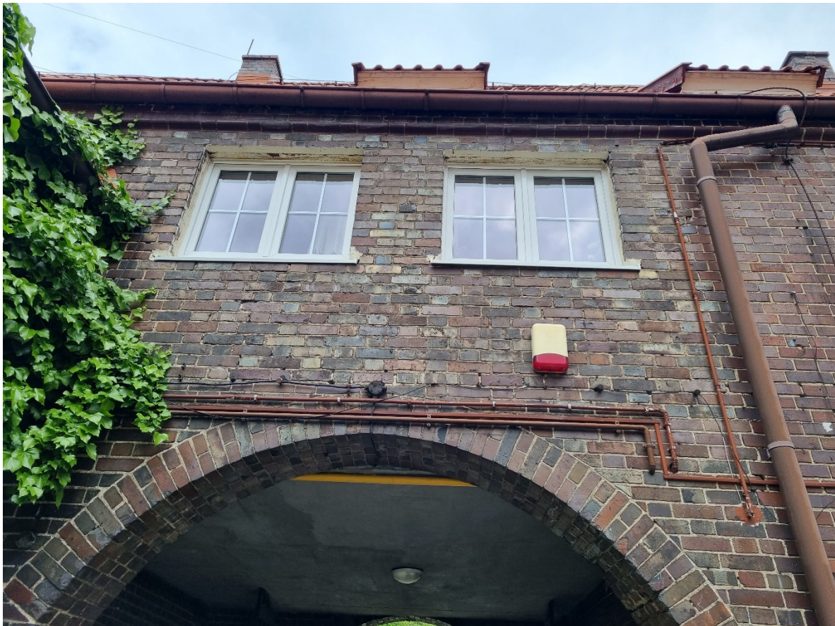
Fragment ściany nad bramą od wewnętrznej strony dziedzińca /widoczne uszkodzenia w ościeżach okiennych po montażu stolarki okiennej/