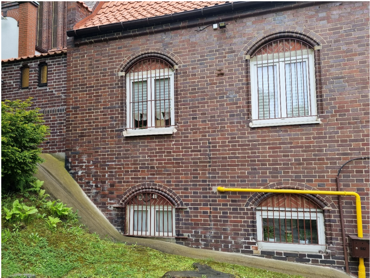
Elewacja północna – Zespołu Budynków Parafialnych przy Katedrze Prawosławnej p.w. św. Mikołaja