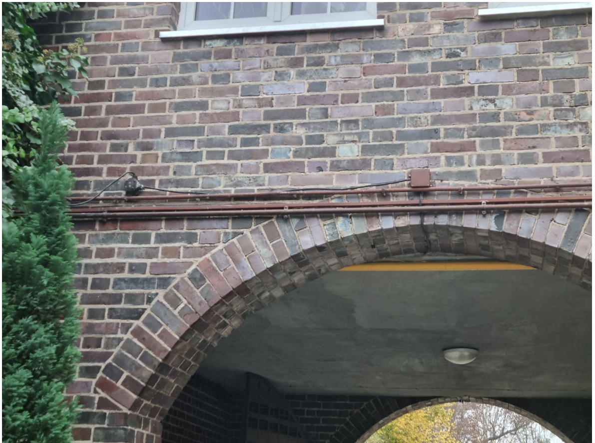
Fragment elewacji budynku parafialnego od strony dziedzińca