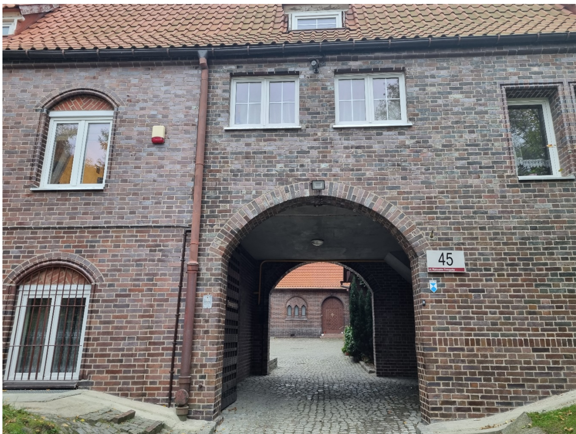
Brama wjazdowa na posesję od strony północnej