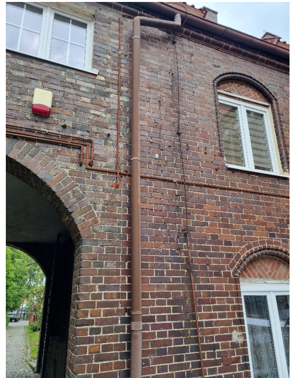
Widok ściany od strony Dziedzińca w kierunku ul. Traugutta