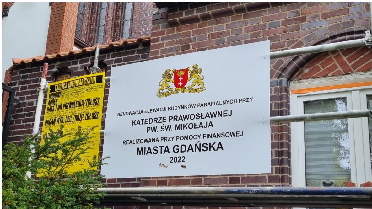
Plansza umieszczona na rusztowaniu elewacji frontowej Budynków Parafialnych, informująca o realizacji zadania przy pomocy Finansowej Miasta Gdańska