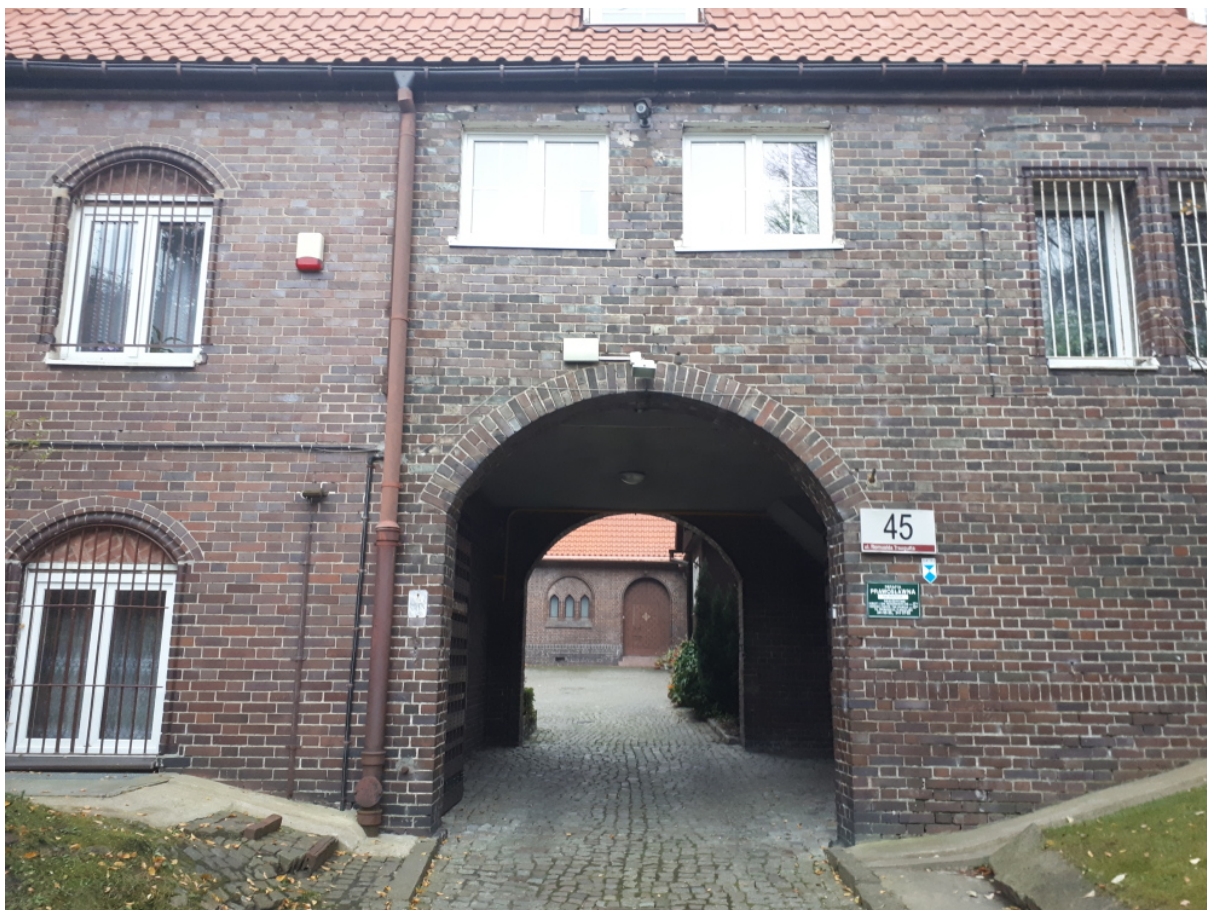
ELEWACJA ZESPOŁU BUDYNKÓW PARAFIALNYCH przy Katedrze Prawosławnej p.w. św. Mikołaja