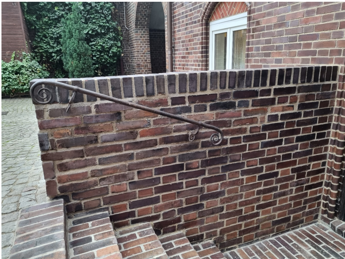
Murek oporowy przy schodach prowadzących do pomieszczeń parafii