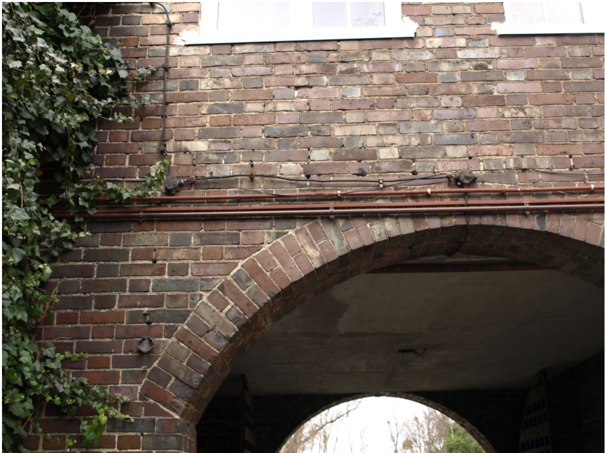
Fragmenty elewacji budynku parafialnego od strony dziedzińca