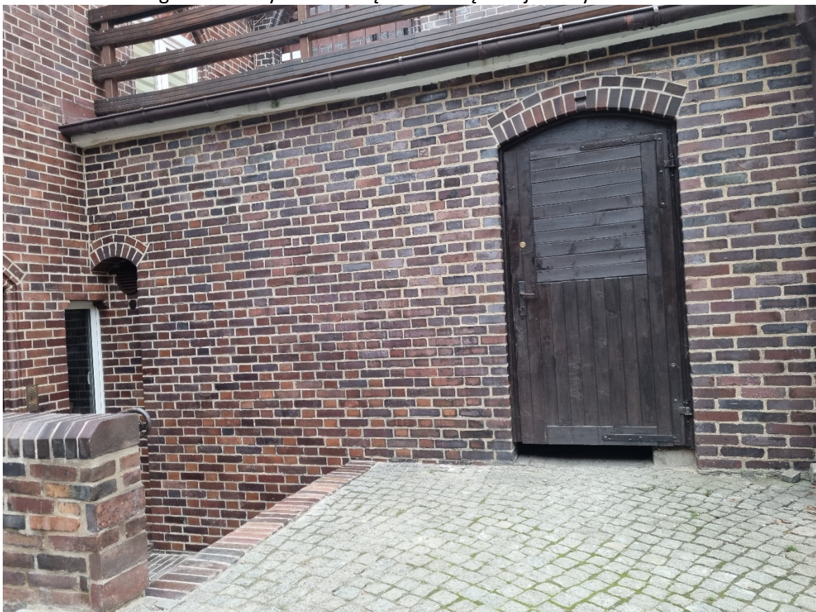
Ściana zachodnia na terenie dziedzińca