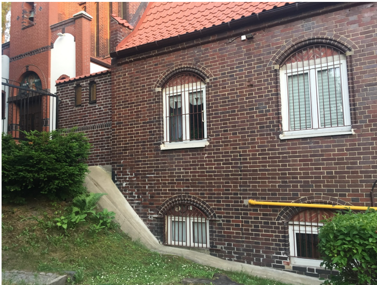
Fragment elewacji frontowej Zespołu Budynków Parafialnych /strona północna/