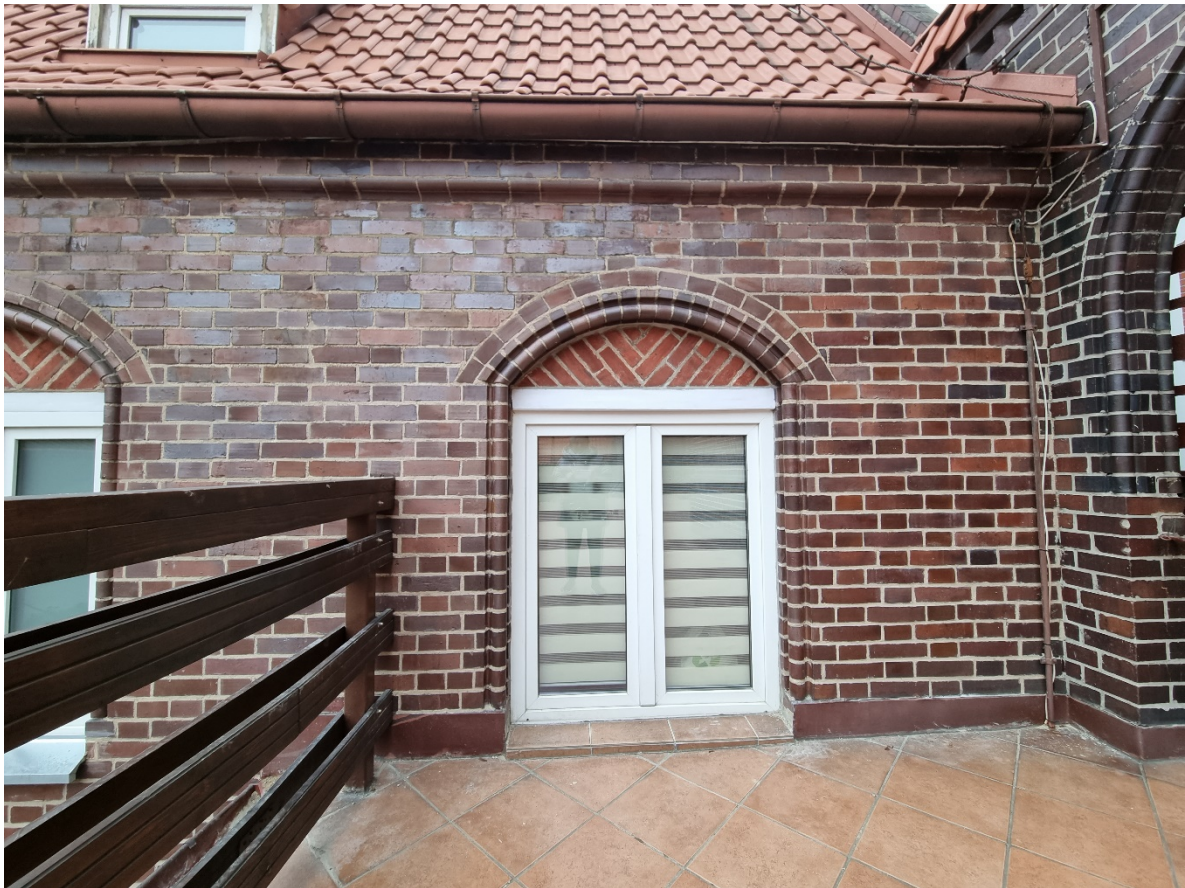
Okno na elewacji północnej ściany od strony dziedzińca