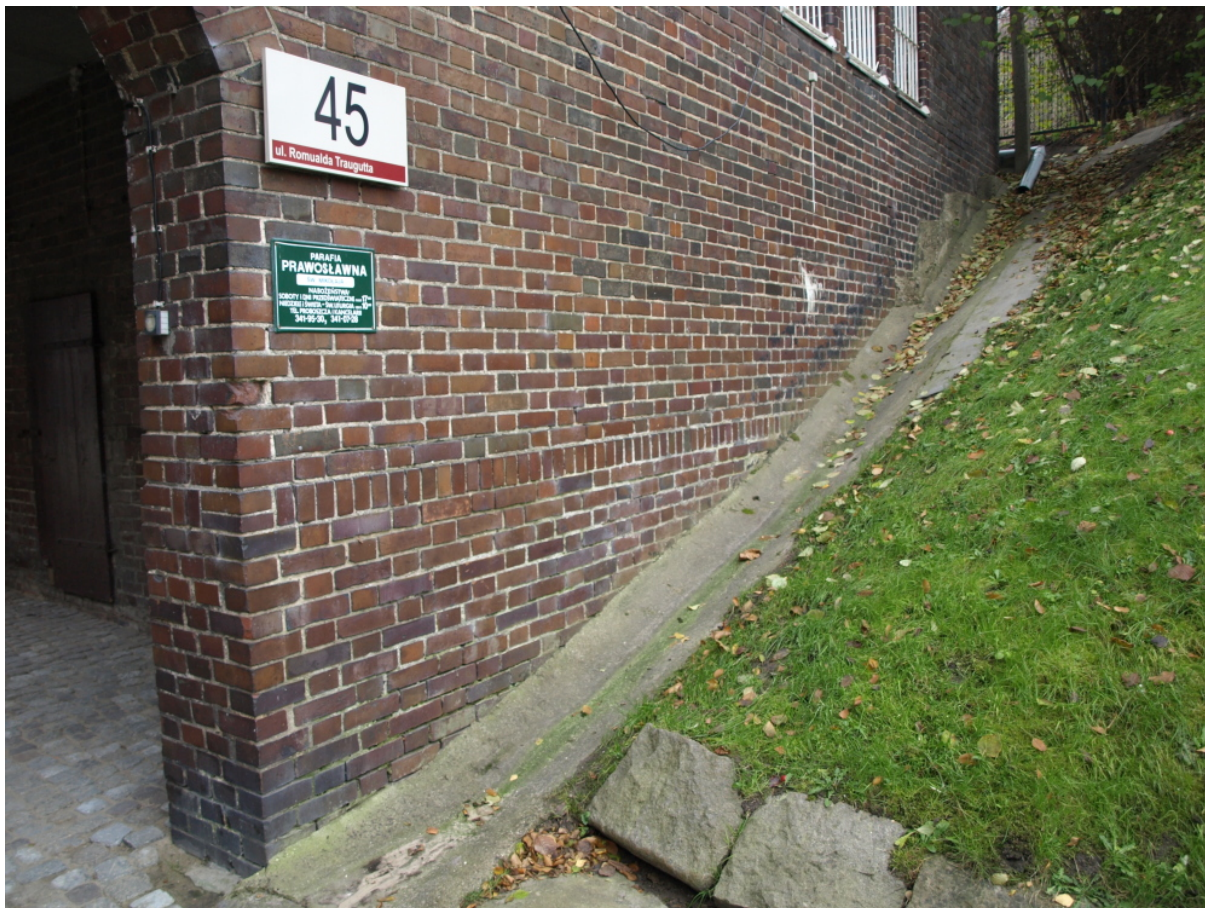
Fragmety elewacji od strony wjazdowej na dziedziniec /strona północna/