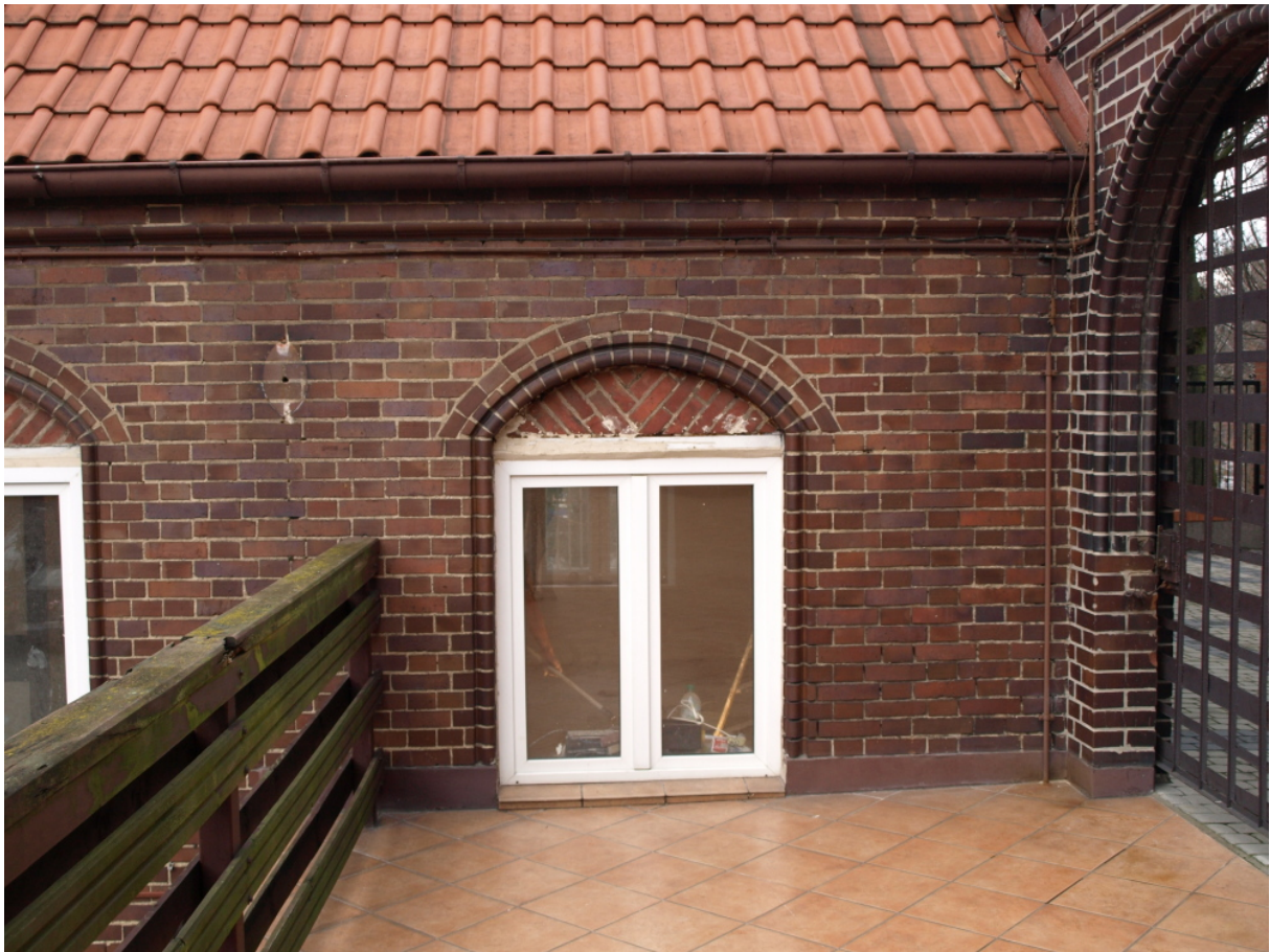
Okno na elewacji północnej ściany od strony dziedzińca /uszkodzenia w nadprożu po wymianie stolarki okiennej/