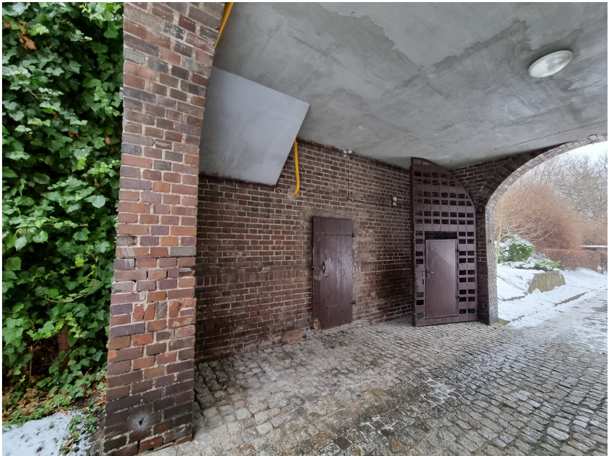
Ściany bramy wjazdowej na teren Zespołu Budynków Parafialnych