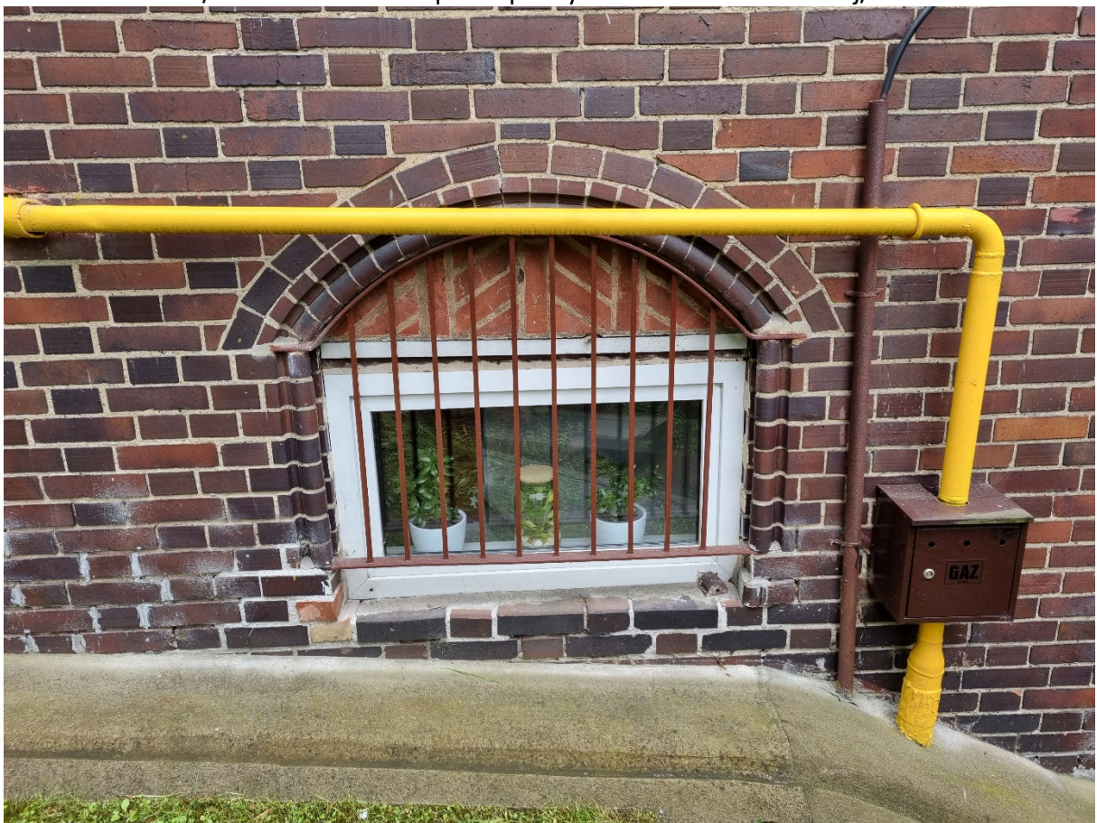
Fragment elewacji północnej od strony wjazdowej na teren dziedzińca