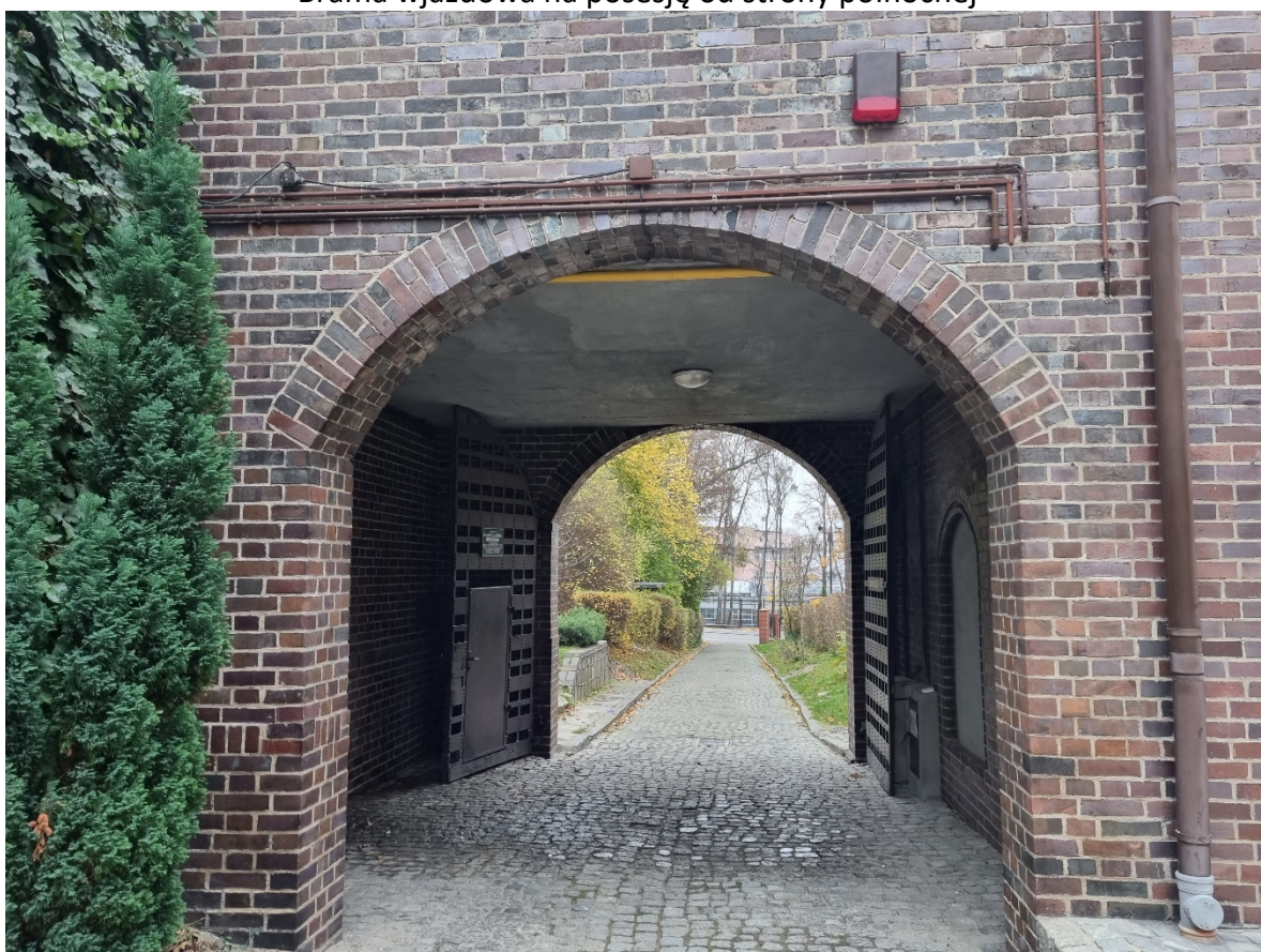
Brama wjazdowa od strony dziedzińca