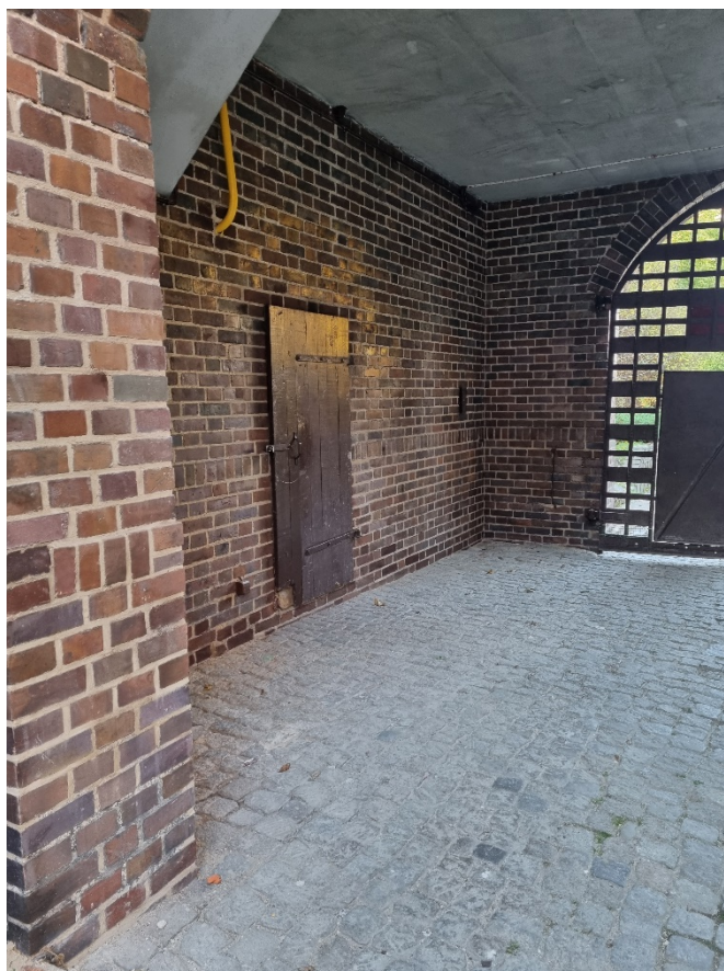
Ściany bramy wjazdowej na teren Zespołu Budynków Parafialnych