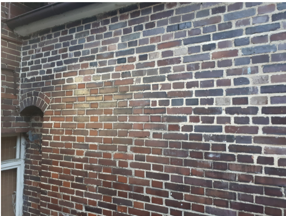
Fragment ściany z widocznymi wtórnymi przemurowaniami / jasna spoina/ - dziedziniec