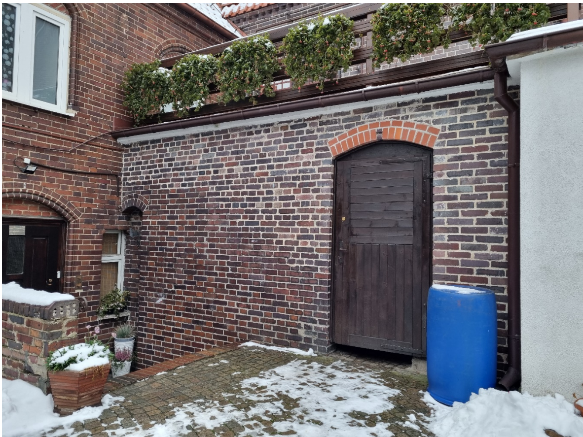
Ściana zachodnia na terenie dziedzińca - / prace do wykonania- scalenie kolorystyczne wtórnie wykonanego spoinowania oraz scalenie kolorystyczne nadproża nad drzwiami wejściowymi do pomieszczeń gospodarczych/