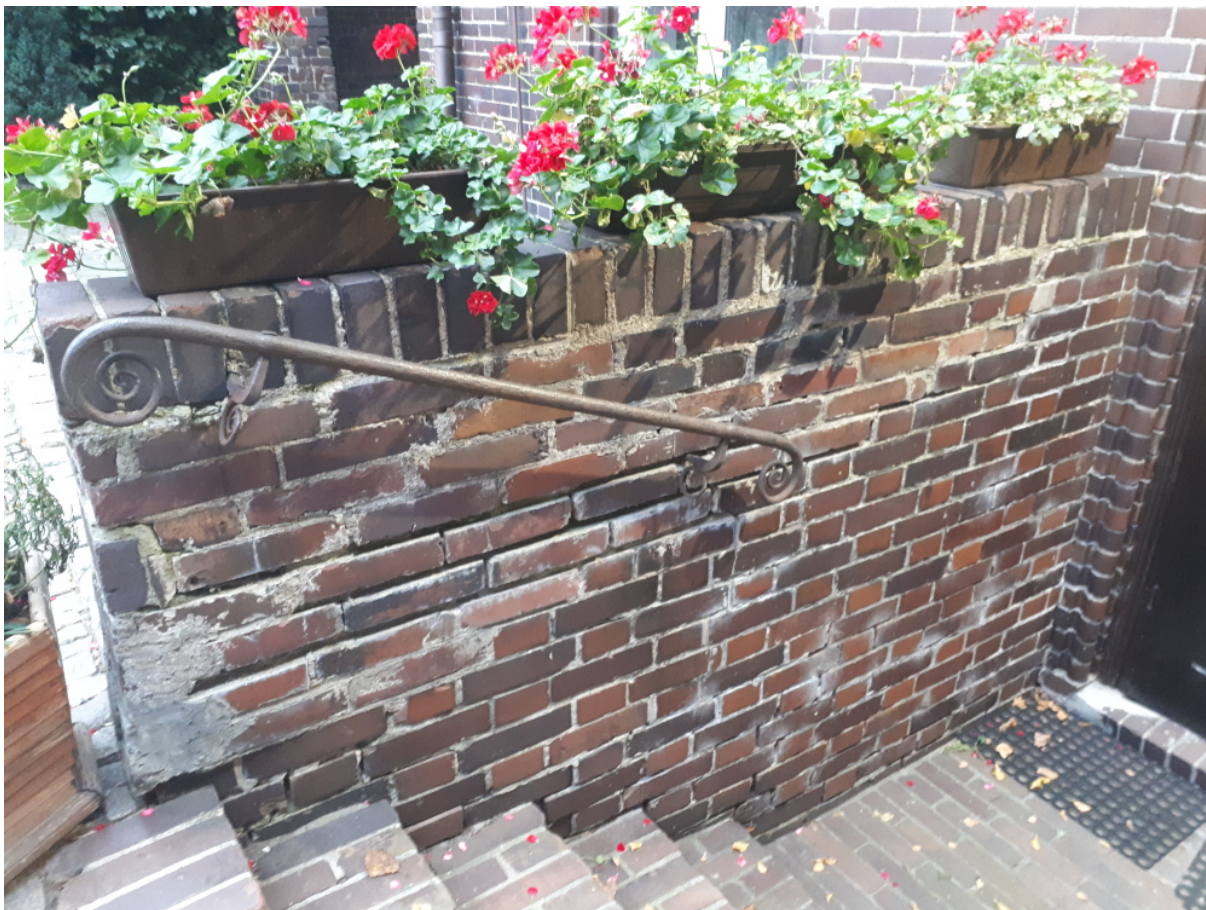
Murek oporowy przy schodach prowadzących do pomieszczeń parafii