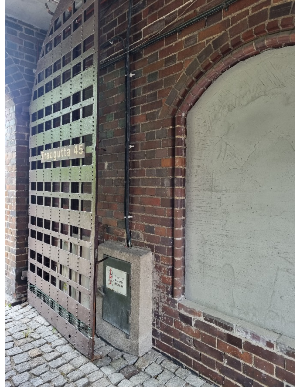
Ściany wewnętrzne bramy wjazdowej na teren dziedzińca Zespołu Budynków Parafalnych