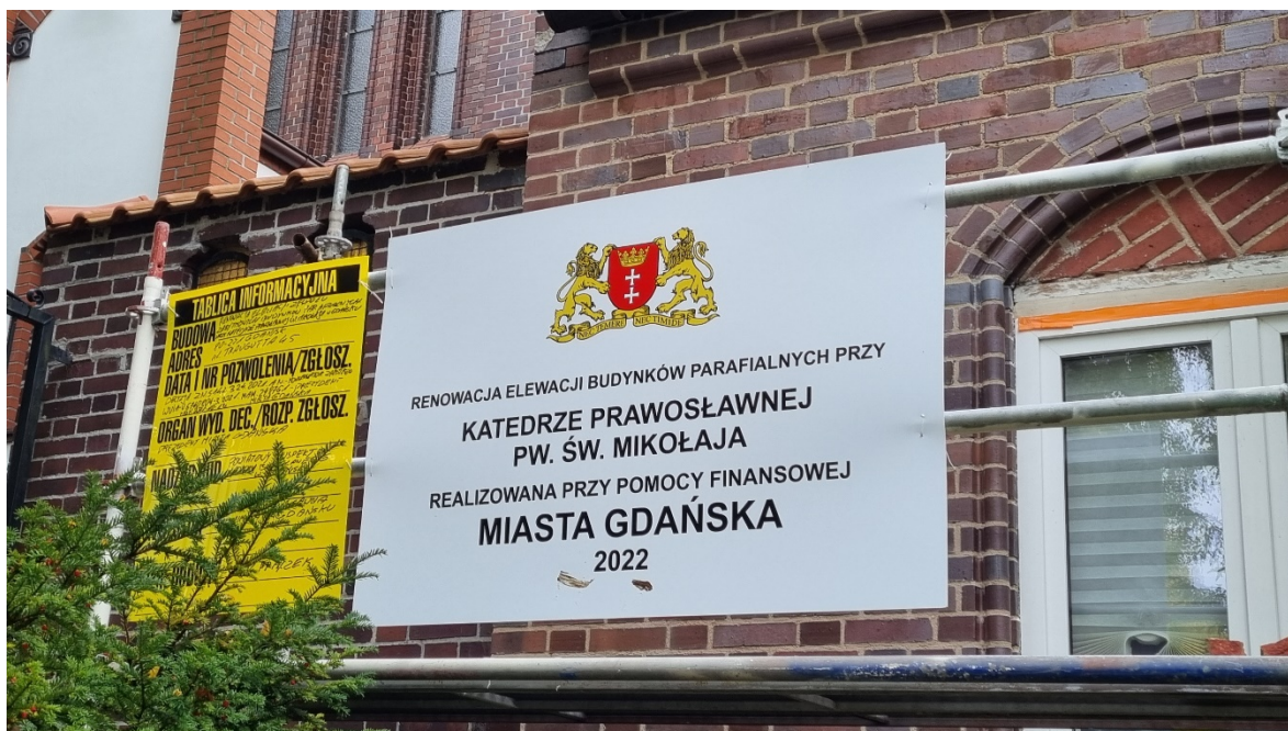
Plansa umieszczona na rusztowaniu elewacji frontowej Budynków Parafialnych, informująca o realizacji zadania przy pomocy Finansowej Miasta Gdańska