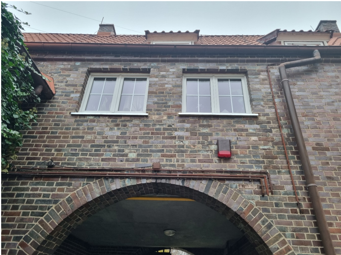
Fragment ściany nad bramą od wewnętrznej strony dziedzińca