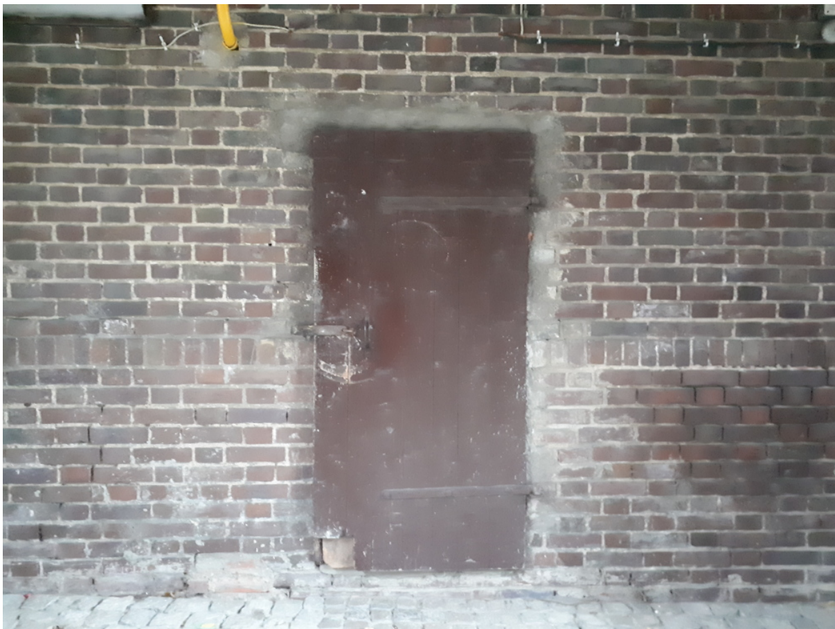
Fragmenty ścian wnętrza bramy wjazdowej na dziedziniec Zespołu Budynków Parafialnych