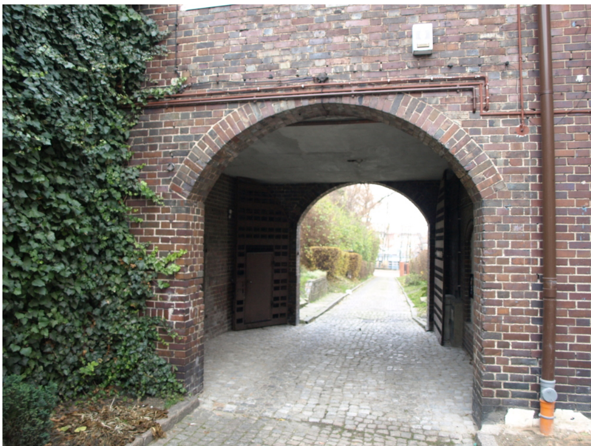
BRAMA WJAZDOWA BUDYNKU PARAFIALNEGO /w kierunku ul. Traugutta/