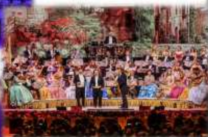
Andrie Rieu - 19.000 widzów