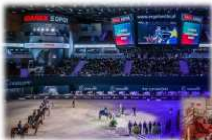
Cavaliada – 16.000 widzów

Rok 2022 to bardzo udany rok. W zasadzie jeden z najlepszych w Hali. Wynikało to oczywiście z również z faktu pandemii, która niestety zamknęła de facto Halę na dwa lata i tak naprawdę wiele imprez zostało przełożonych, wiele imprez na nowo jakby otworzyło ten obiekt dla publiczności i wiele osób też po tym etapie pandemii po prostu zapragnęło uczestnictwa w dużych imprezach masowych, czy też w koncertach, czy sportowych. W zeszłym roku odbyło się 181 imprez, a więc do drugiego dnia była impreza lub przygotowanie do imprezy i tak jak państwo widzą na tym slajdzie były to zarówno imprezy sportowe 55, ale też koncerty, teatry, przedstawienia i do tych największych można właśnie zaliczyć właśnie m. in. przepiękne imprezy sportowe, które tutaj dzięki Gdańskowi gościmy w naszej hali i tak siatkarska Liga Narodów, aż 34 000 kibiców odwiedziło halę, ale też nowe formaty jak Cavaliada, która z roku na rok coraz więcej zdobywa widzów, czy Cirque Du Soleil, to wielkie klasyki, Andrie Rieu i wiele innych gwiazd, które gościliśmy.