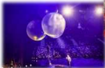
CORTEO – Cirque Du Soleil