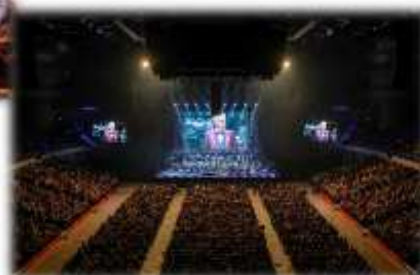
Andrea Bocelli - 9 897 widzów

Oczywiście również w naszej hali odbywają się mecze ligowe, a więc mecze Trefla Gdańsk w siatkówce mężczyzn oraz Trefla Sopotu w koszykówce. Do tej pory Gdańsk rozegrał w sezonie 2022-2023 16 meczów. Niestety już odpadli. Tak samo Sopot niestety odpadł w pierwszej fazie Play OFF, czego bardzo żałujemy, ale liczymy, że może w przyszłym roku uda się dłużej pograć i cieszyć kibiców obecnością w Hali. Kontrakt z klubami mamy