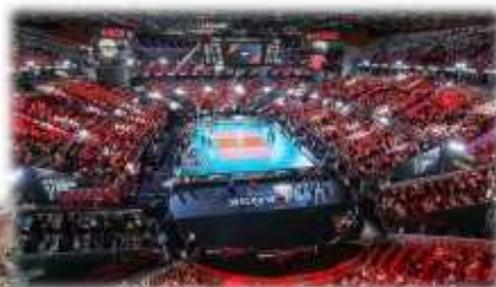
Siatkarska Liga Narodów 2022 - 34.000 kibiców