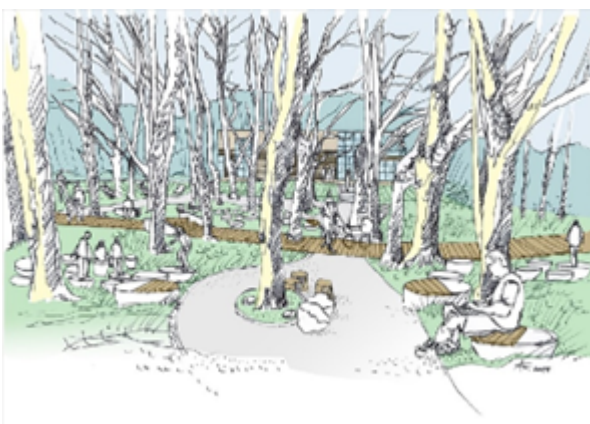
Szkic koncepcyjny strefa parkowa – gaj lipowy, wejście nr 25