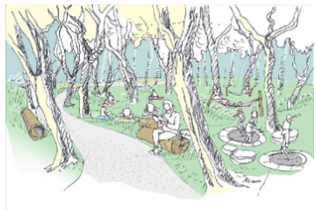
Szkic koncepcyjny strefa aktywności – gaj akacjowy, park leśny