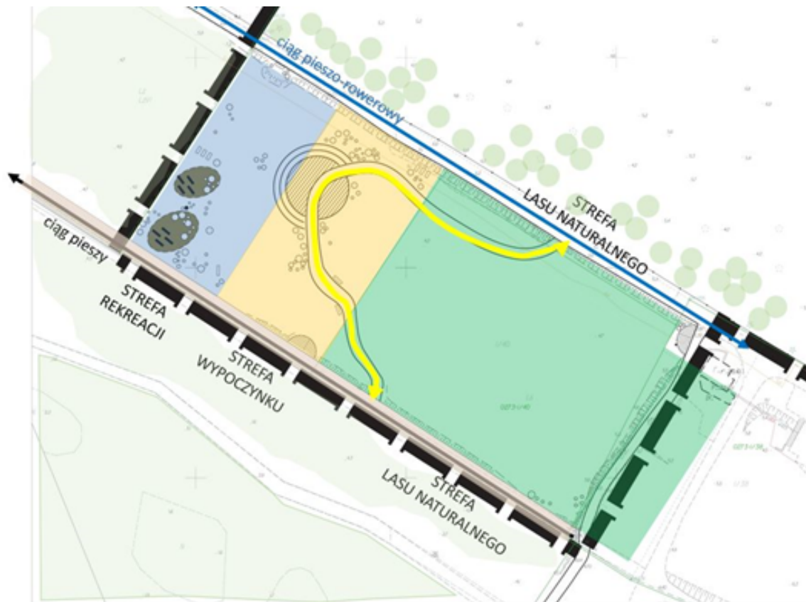
Schemat przestrzenno-funkcyjny strefy parku leśnego

Przestrzeń parku oraz strefy aktywności mają być wyposażone w małą architekturę o prostej, nowoczesnej formie nieingerującej w krajobraz, inspirowanej charakterem miejsca. Preferowane materiały to: drewno, beton (hiperbeton), bądź wykorzystanie naturalnych elementów takich jak głązy, pnie drzew itp.