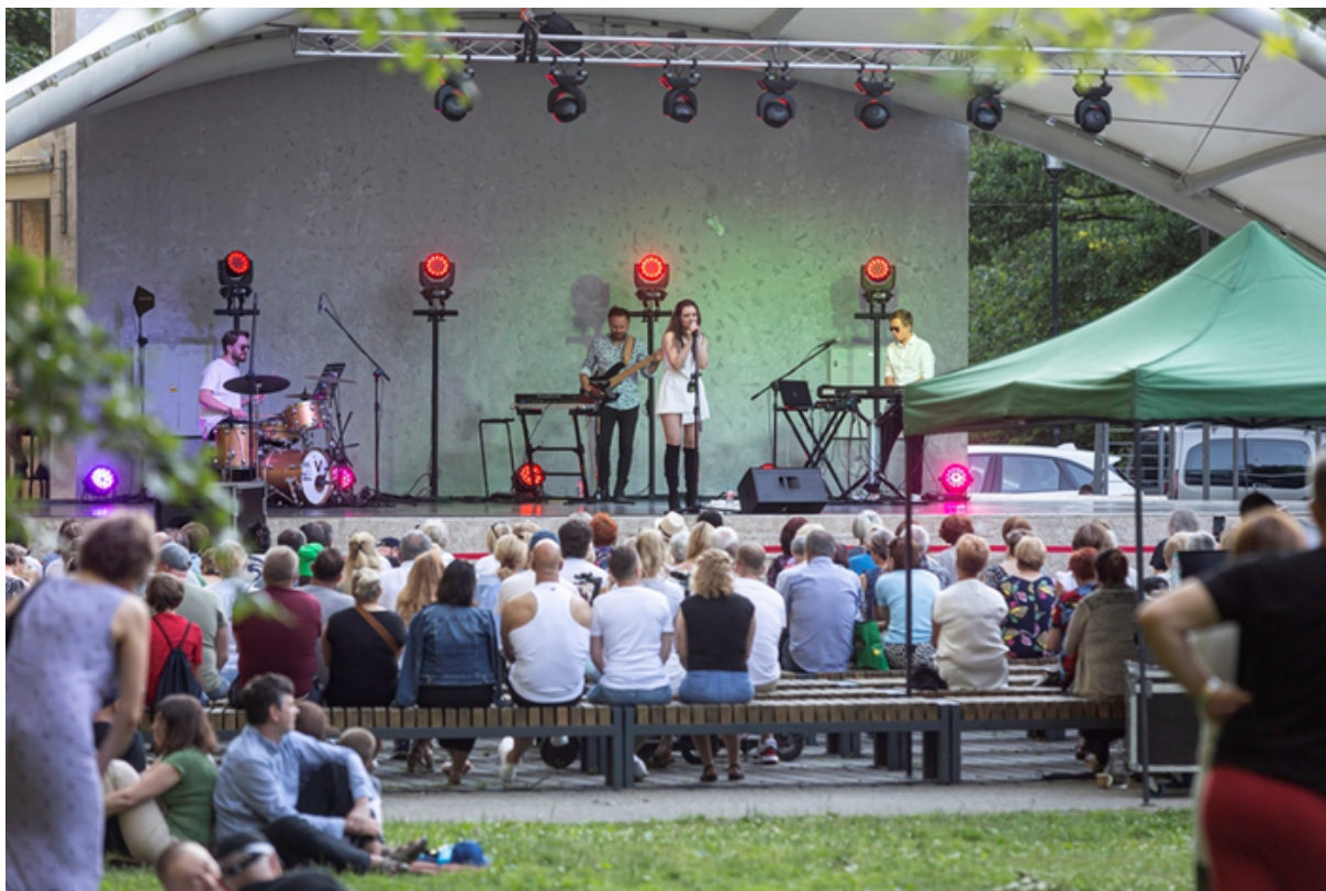
ryc. 2. Koncert piosenki autorskiej w amfiteatrze Orana w Parku Oruńskim.