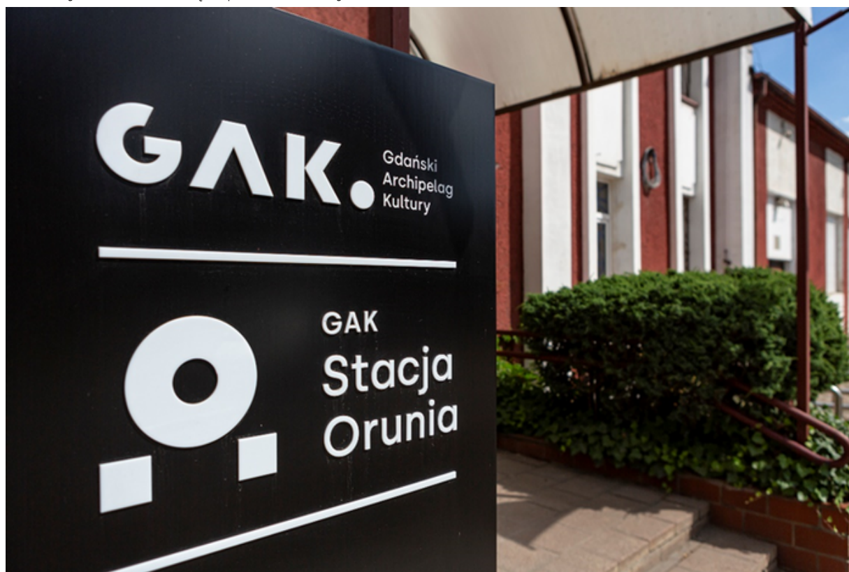
ryc. 1. Stacja Orunia Gdańskiego Archipelagu Kultury.