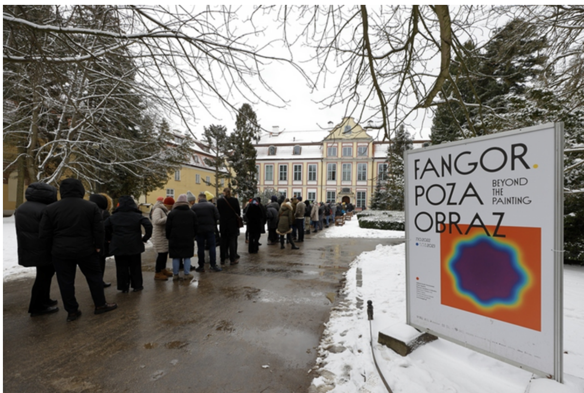
ryc. 3. Wystawa - Fangor. Poza obraz.