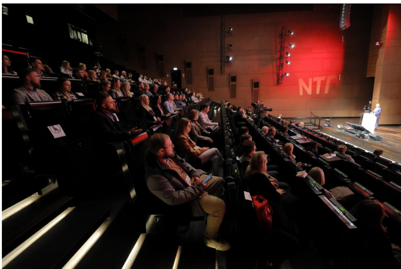
ryc. 8. Konferencja Nowe Trendy w Turystyce (NTT).