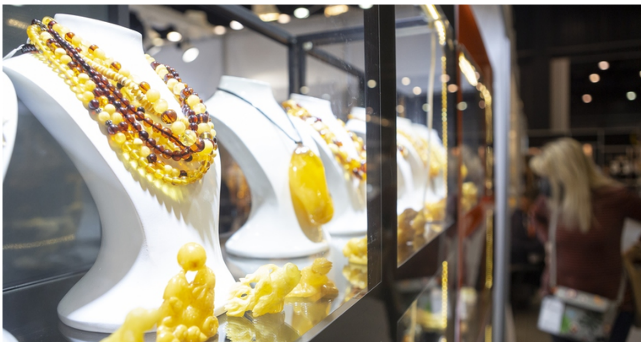
ryc. 6. Targi Amberif 2022.