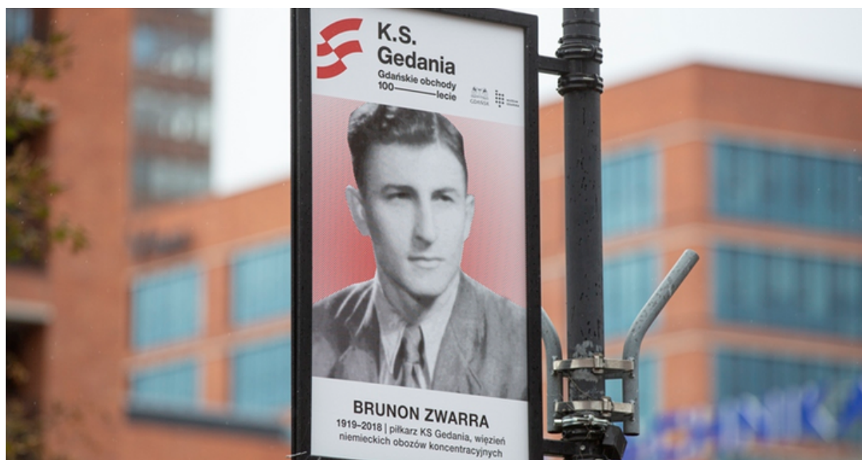
ryc. 4. Tablica pamiątkowa z okazji 100-lecia Klubu Sportowego Gedania.