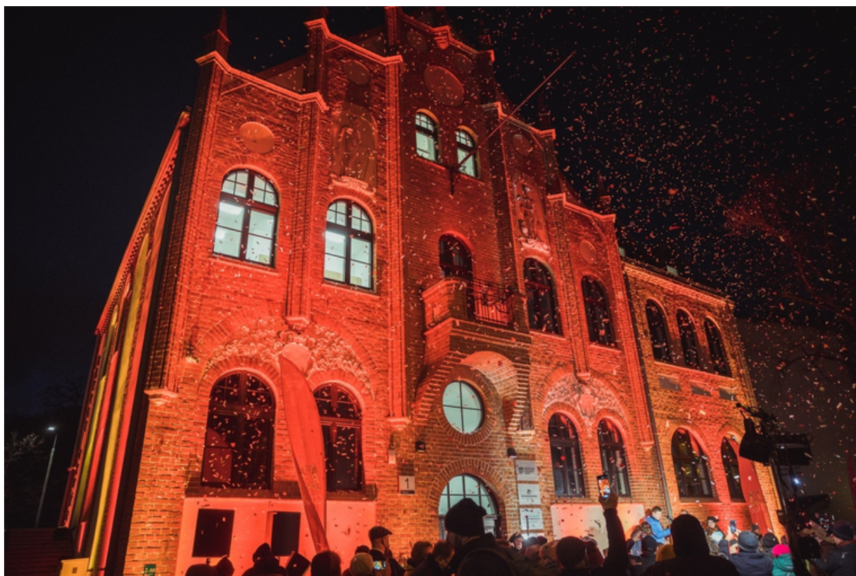
rnc. 7. Uroczyste otwarcie Ratusza Oruńskiego.