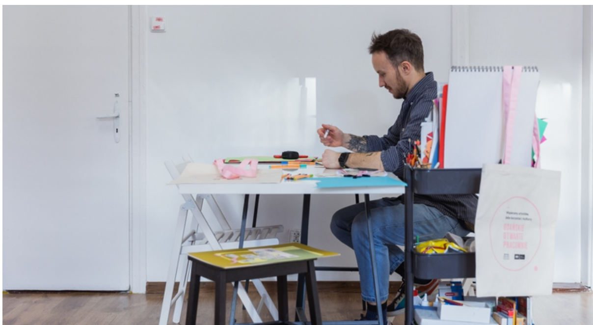
rnc. 5. Gdańskie Otwarte Pracownie.