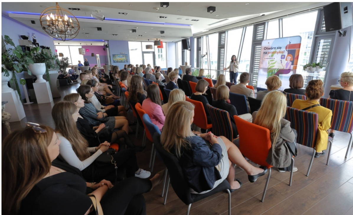
ryc. 1. Gala Wakacyjny Staż.