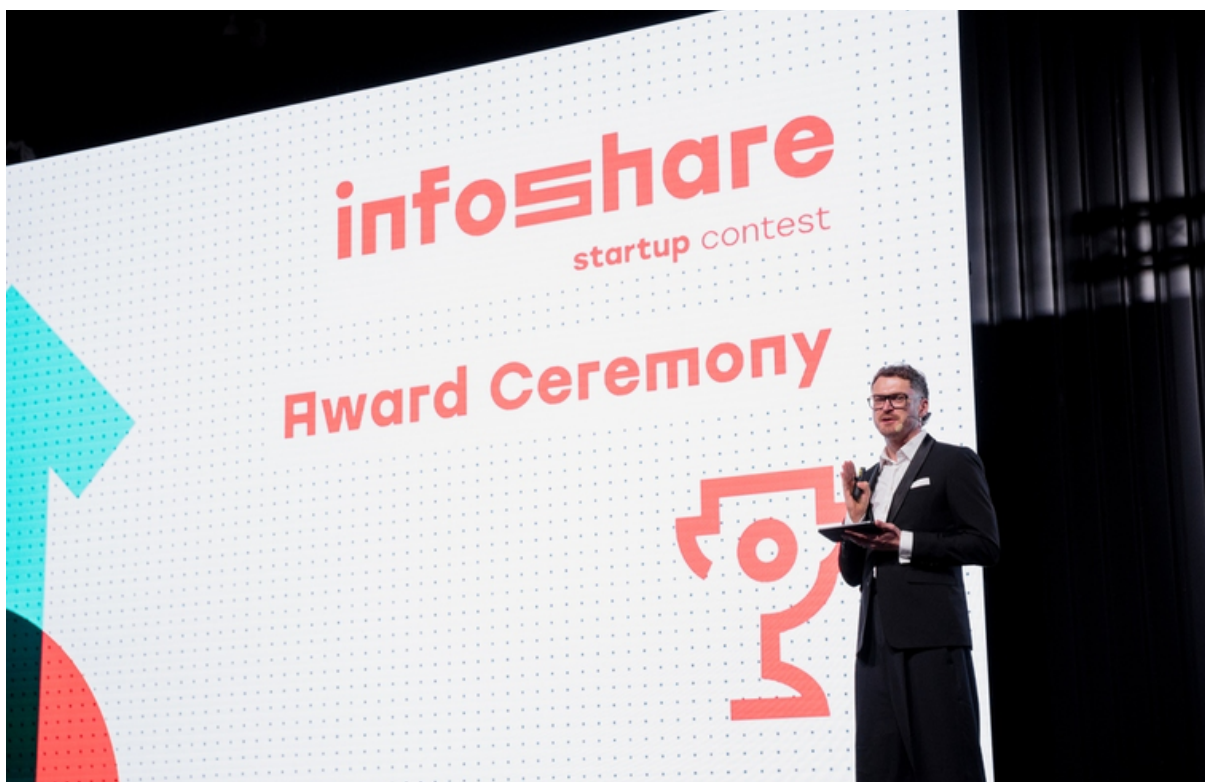
ryc. 3. Ogłoszenie wyników konkursu Start Up na konferencji Infoshare.