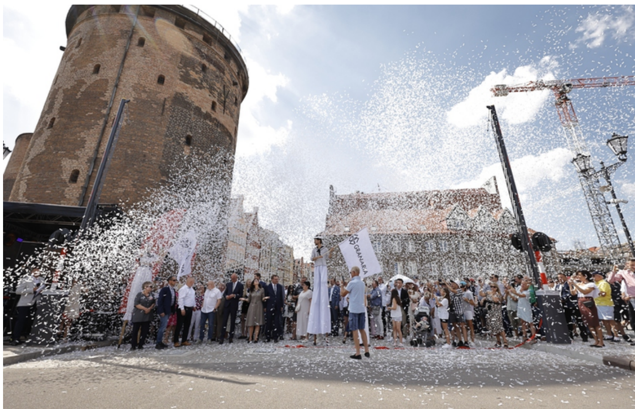
ryc. 4. Uroczyste otwarcie Mostu Stągiewnego.