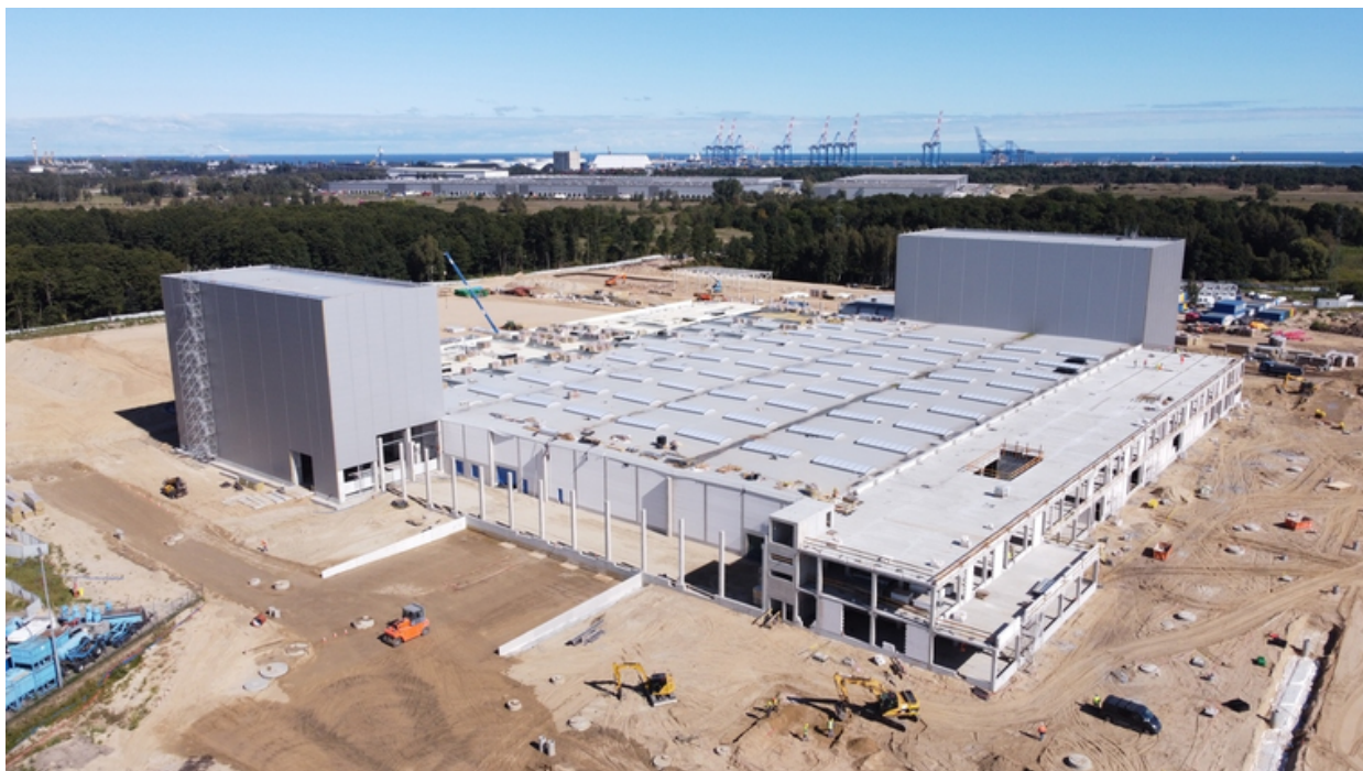
ryc. 2. Budowa fabryki Northvolt w Gdańsku.