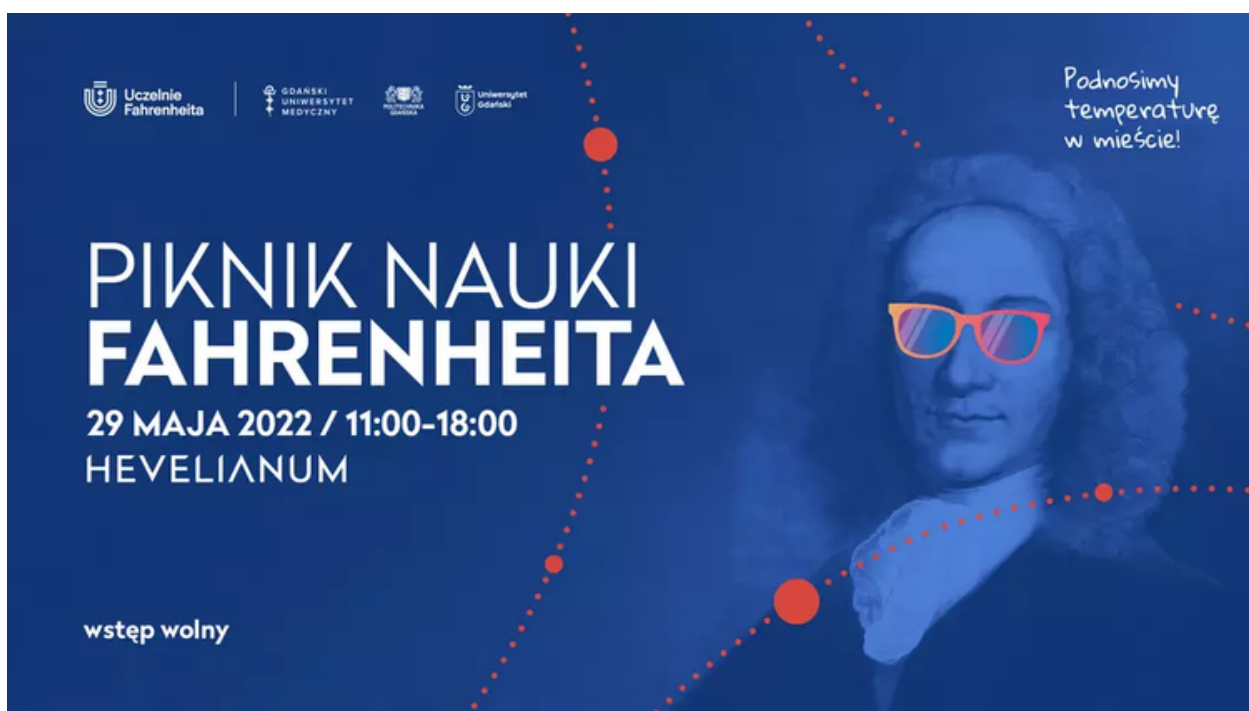
ryc. 5. Grafika promująca Piknik Nauki Fahrenheita.