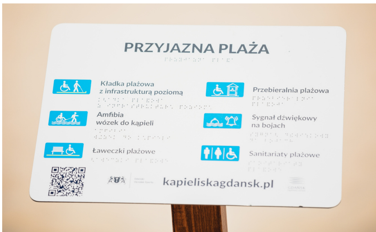
ryc. 2. Przyjazna - tablica informacyjna.