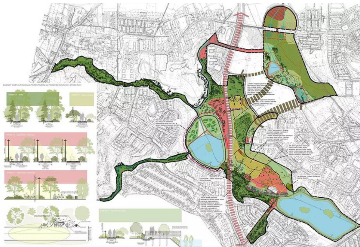
ryc. 4. Koncepcja Parku Południowego. Mat. Biuro Architekta Miasta Gdańsk