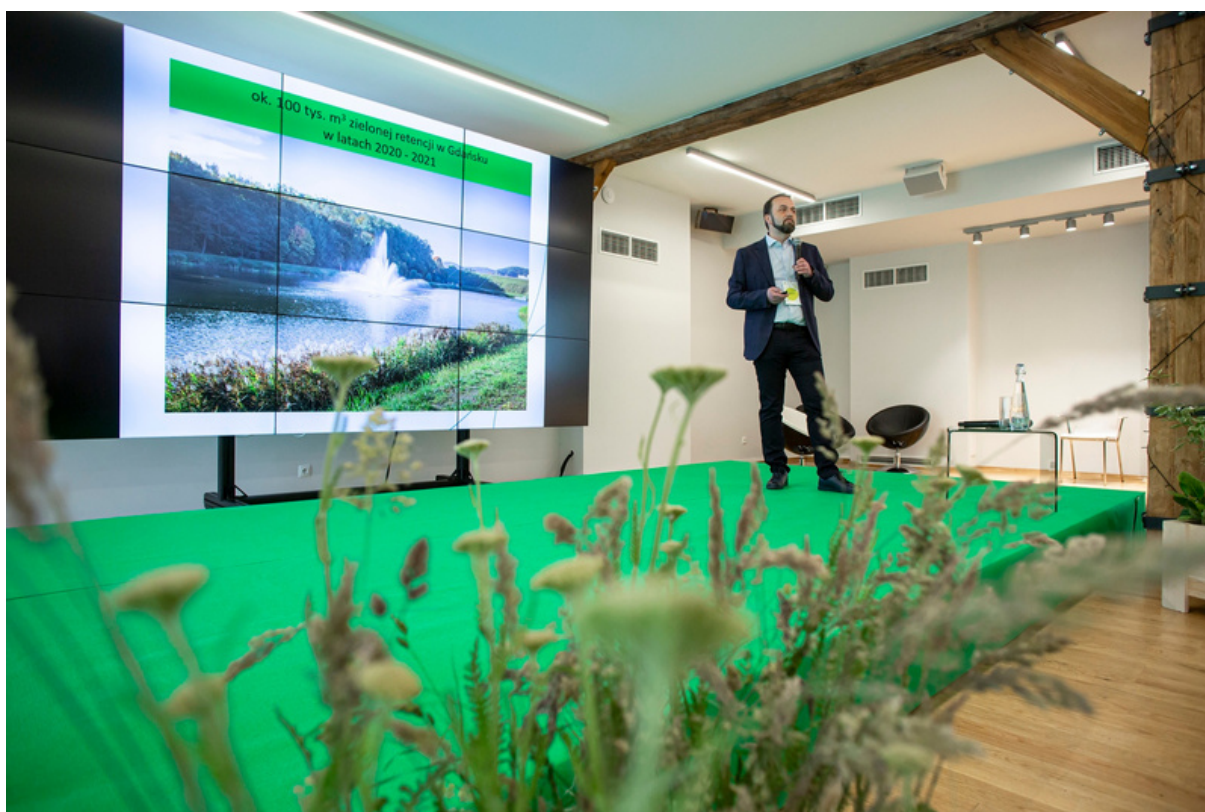
ryc. 1. Konferencja "Zielona Retencja – jak przeciwdziałać podtopieniom i suszom w miastach".