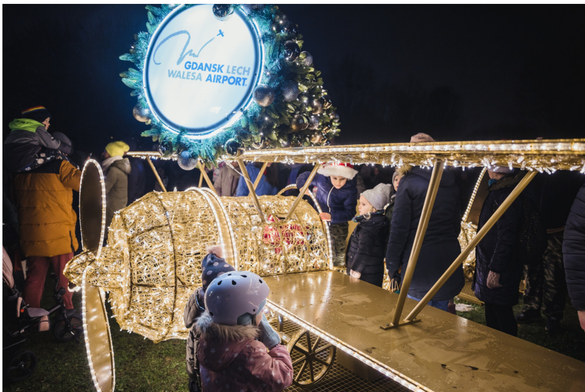
ryc. 3. Iluminacje świąteczne na Zaspie.