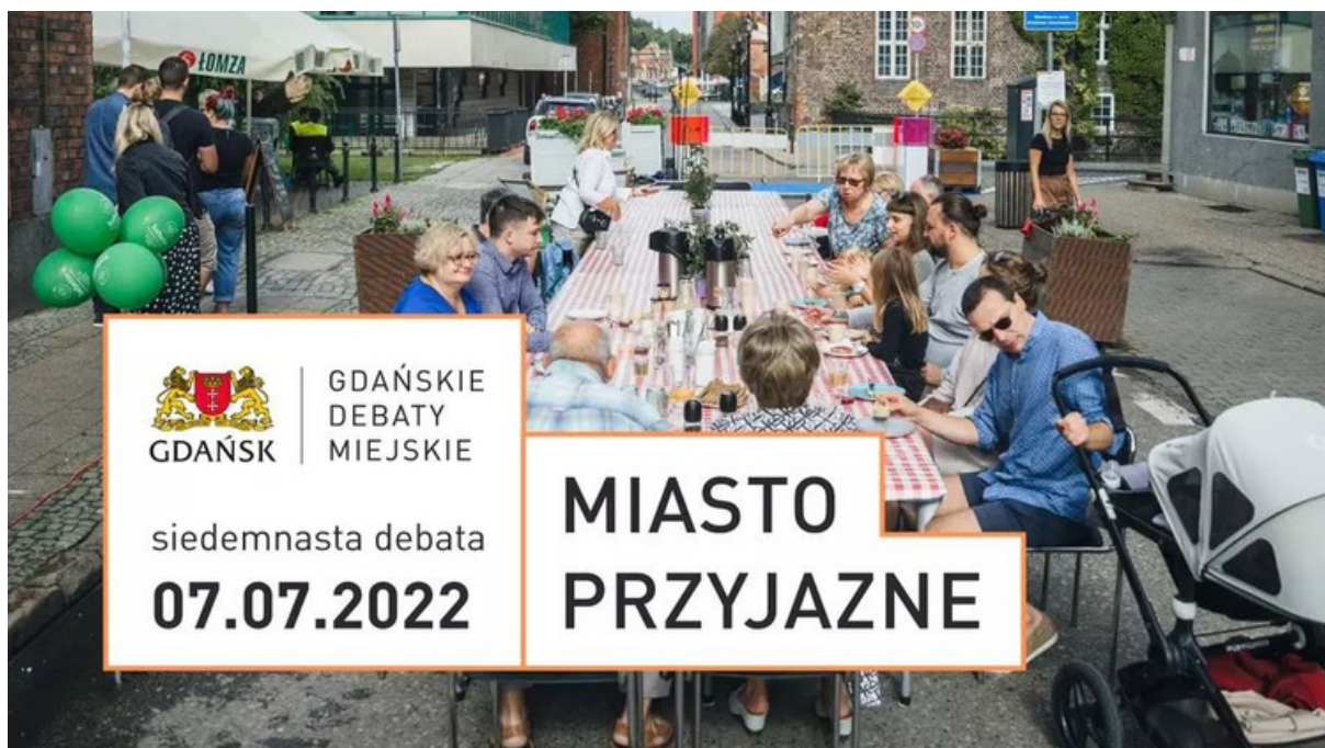
ryc. 5. Grafika promująca jedno ze spotkań w ramach Gdańskich Debat Miejskich.