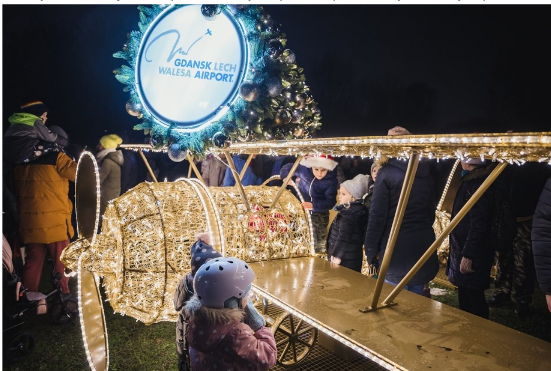
Rycina 3. Iluminacje świąteczne na Zaspie.