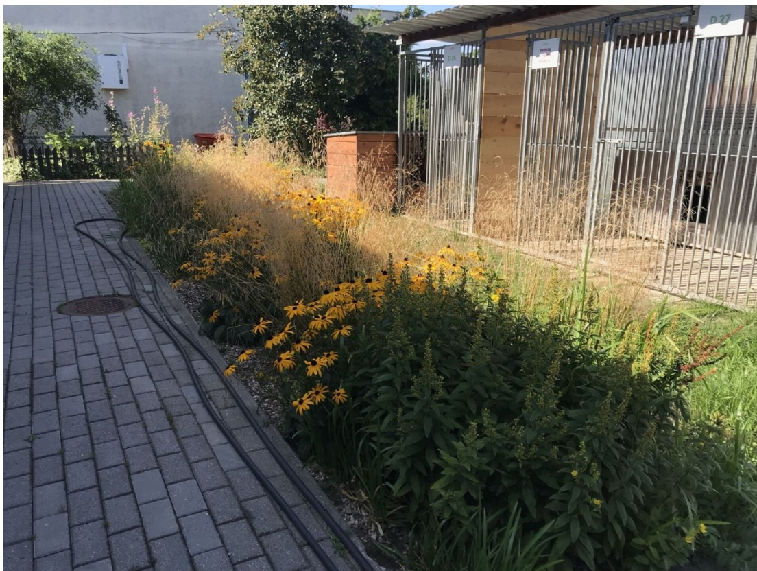
Rycina 4. Ogród deszczowy w schronisku Promyk. Materiał: Gdańskie Wody