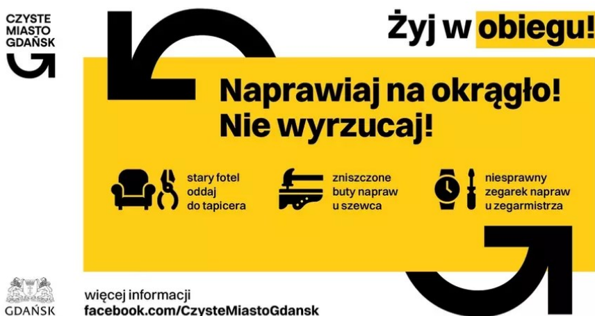
Rycina 3. Grafika promująca kampanię „Żyj w obiegu”. Materiał: Wydział Gospodarki Komunalnej Urzędu Miejskiego w Gdańsku.