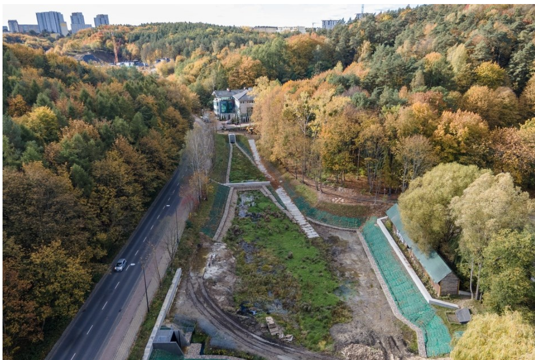
Rycina 4. Zbiornik retencyjny Jaśkowa Dolina.