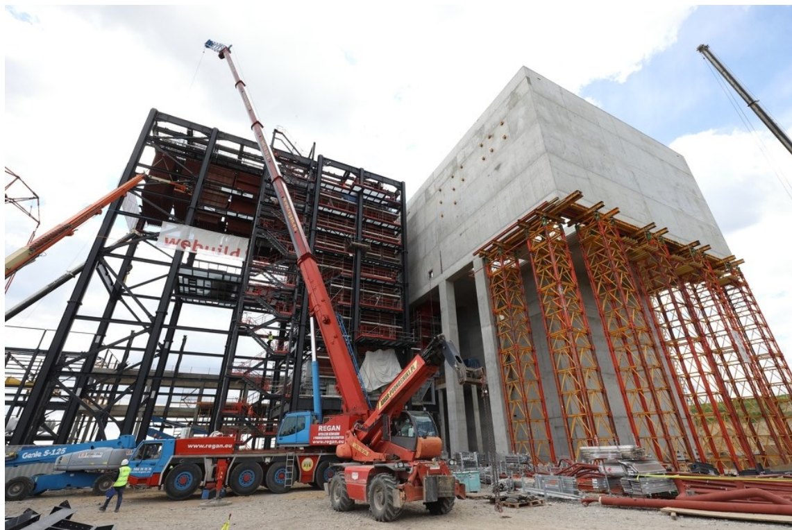
Rycina 2. Prace budowlane na terenie Portu Czystej Energii.