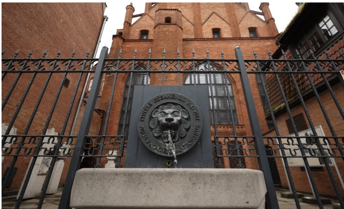
Rycina 5. Zdrój uliczny w przestrzeni miejskiej.