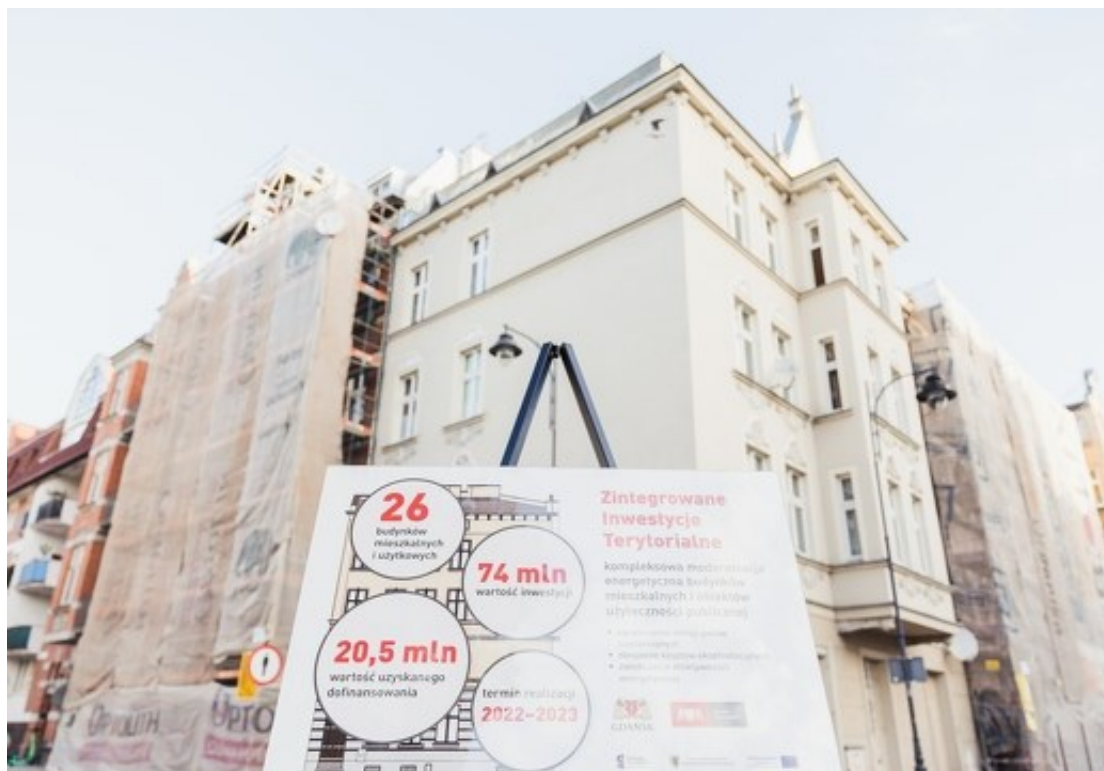
Rycina 1. Termomodernizacja 26 budynków komunalnych.