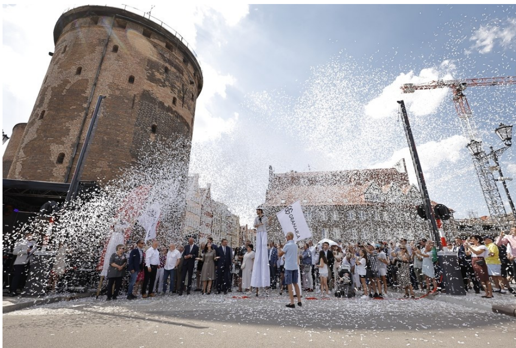
Rycina 4. Uroczyste otwarcie Mostu Stągiewnego.