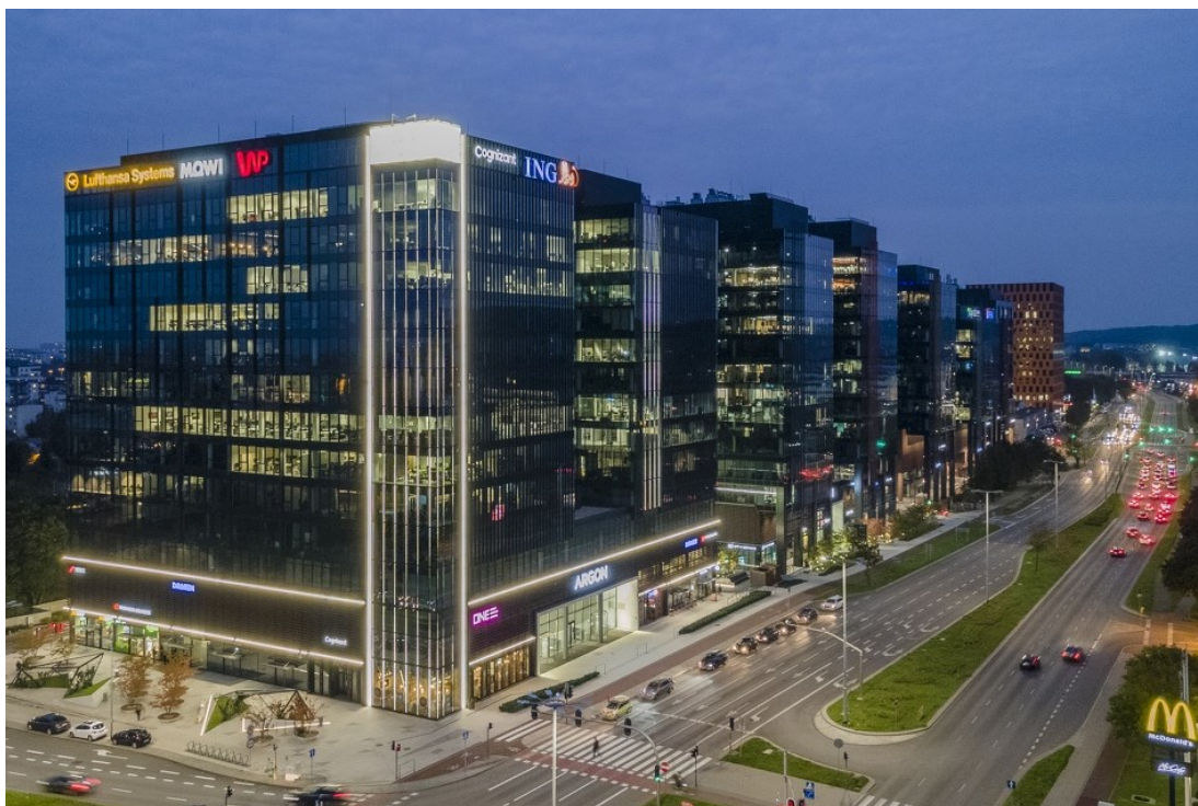
Rycina 3. Kompleks biurowców Alchemia.