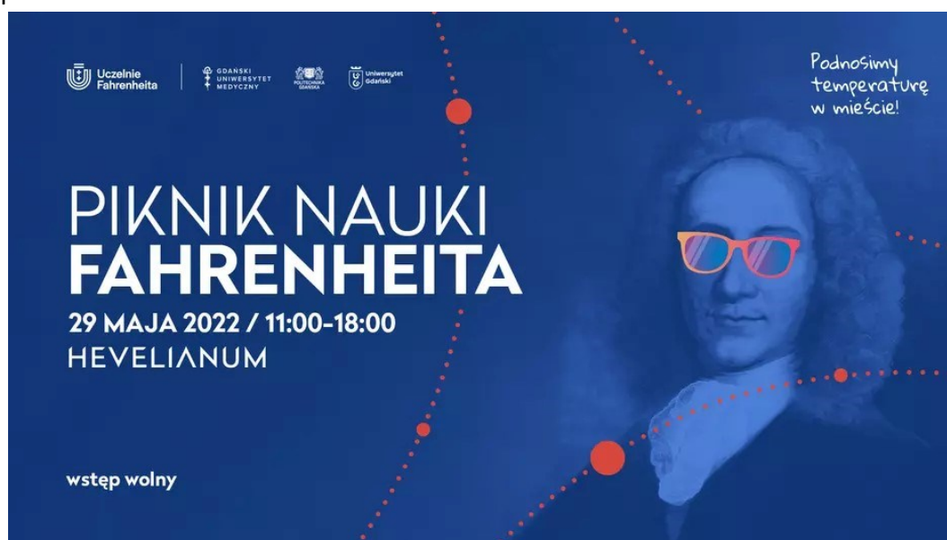
Rycina 5. Grafika promująca Piknik Nauki Fahrenheita. Materiał: www.gdansk.pl