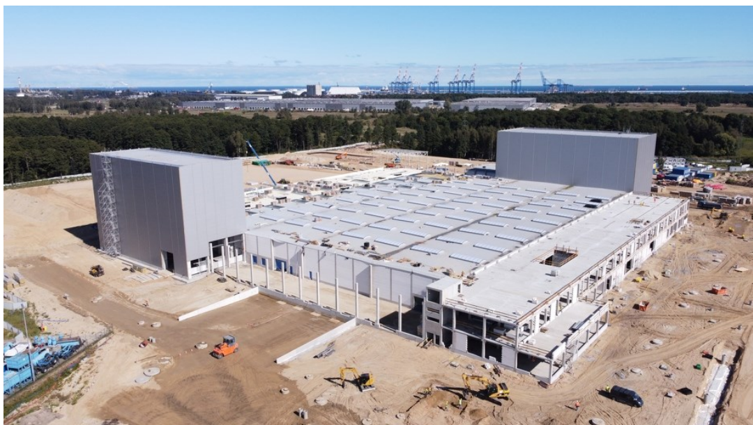
Rycina 2. Budowa fabryki Northvolt w Gdańsku.