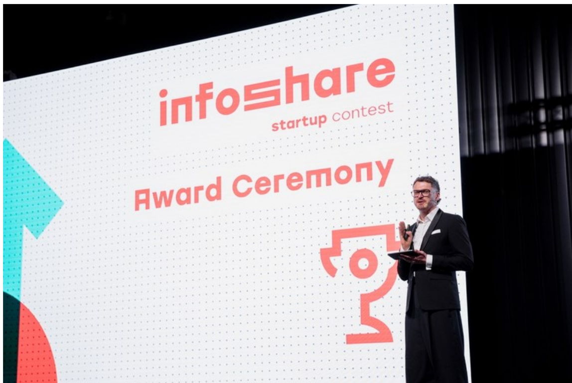
Rycina 3. Ogłoszenie wyników konkursu Start Up na Infoshare.

konferencji oraz 3 dni online – przed jej rozpoczęciem) i licznych wydarzeń networkingowych. [Powiązanie z Programem Operacyjnym VI. Atrakcyjność Inwestycyjna]