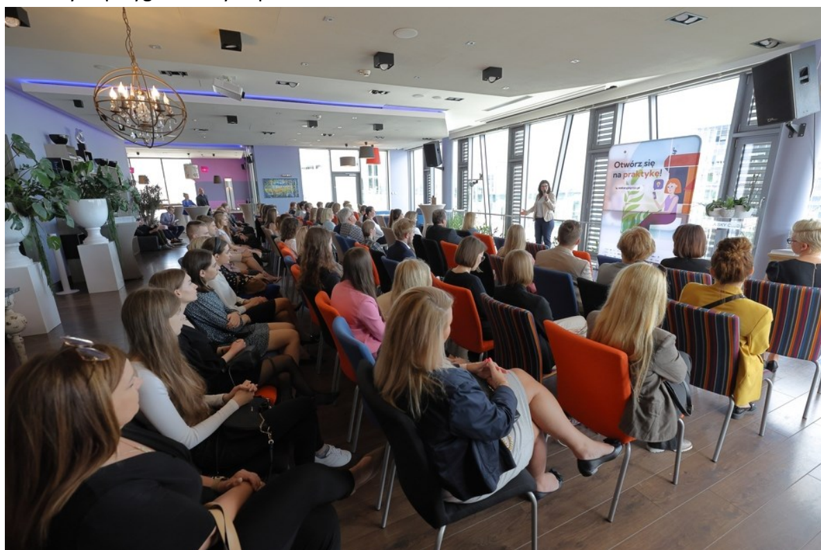
Rycina 1. Gala Wakacyjny Staż.