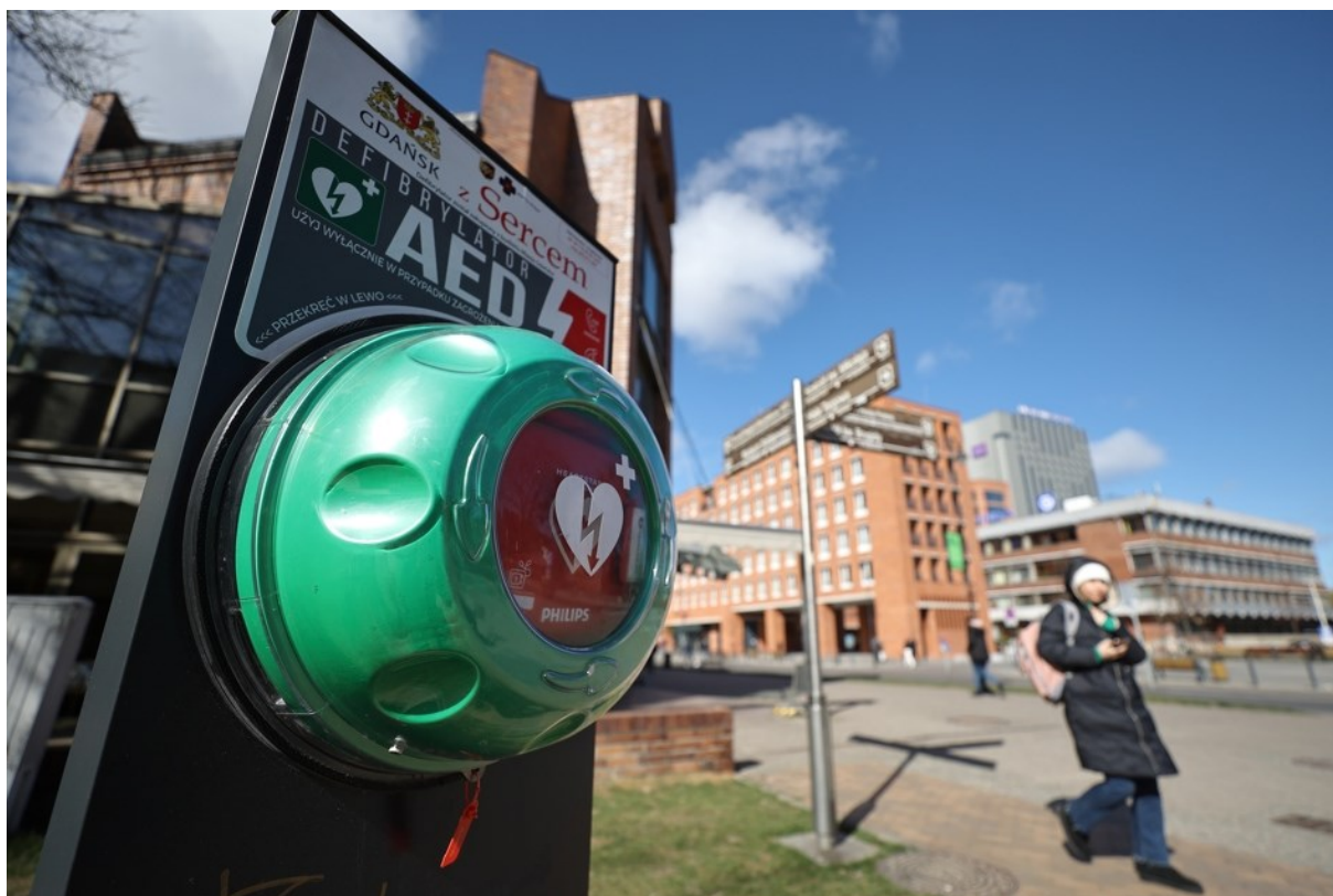
Rycina 4. Defibrylator w przestrzeni miejskiej.