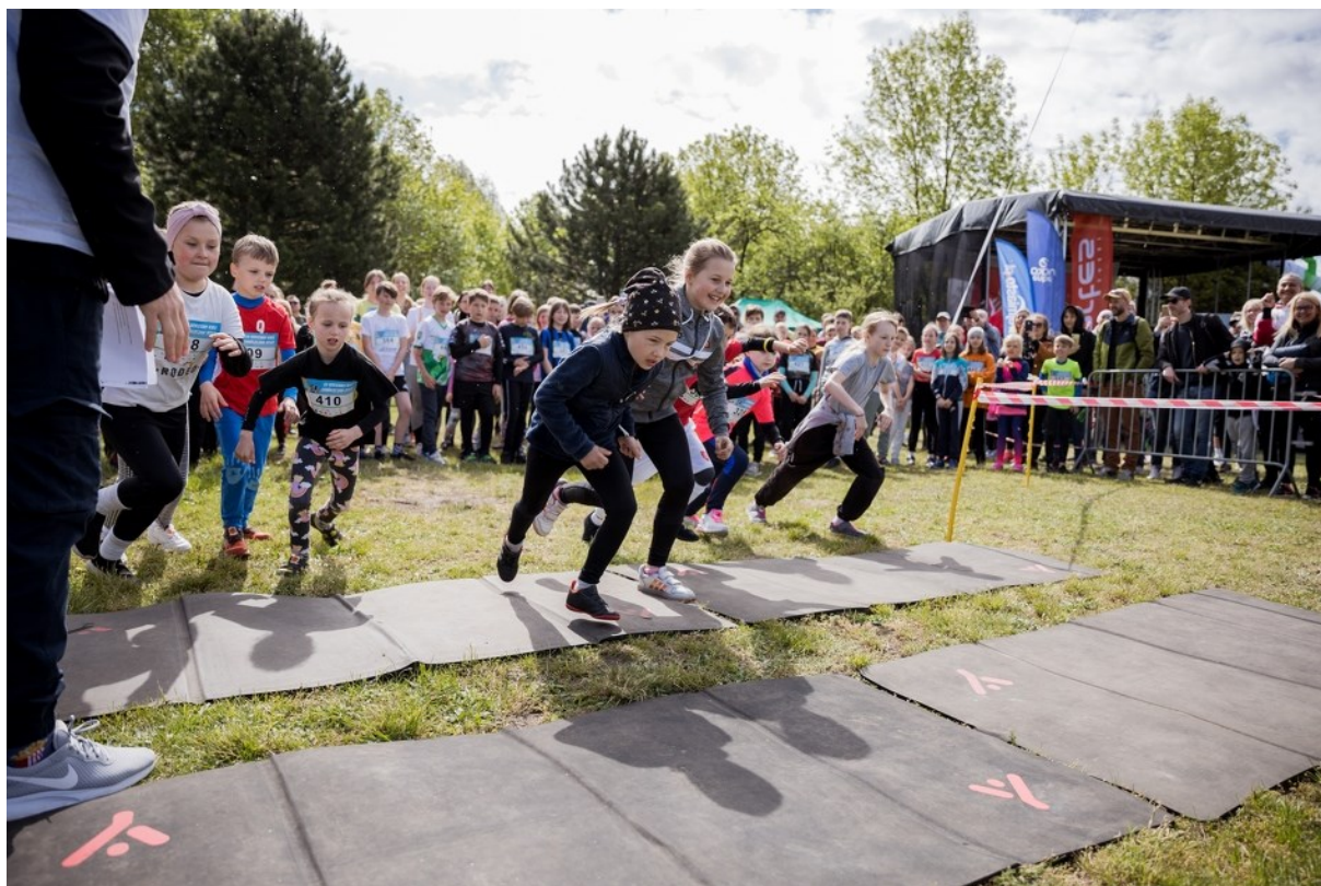
Rycina 3. XV Rodzinny Bieg Gdańszczan 2022.