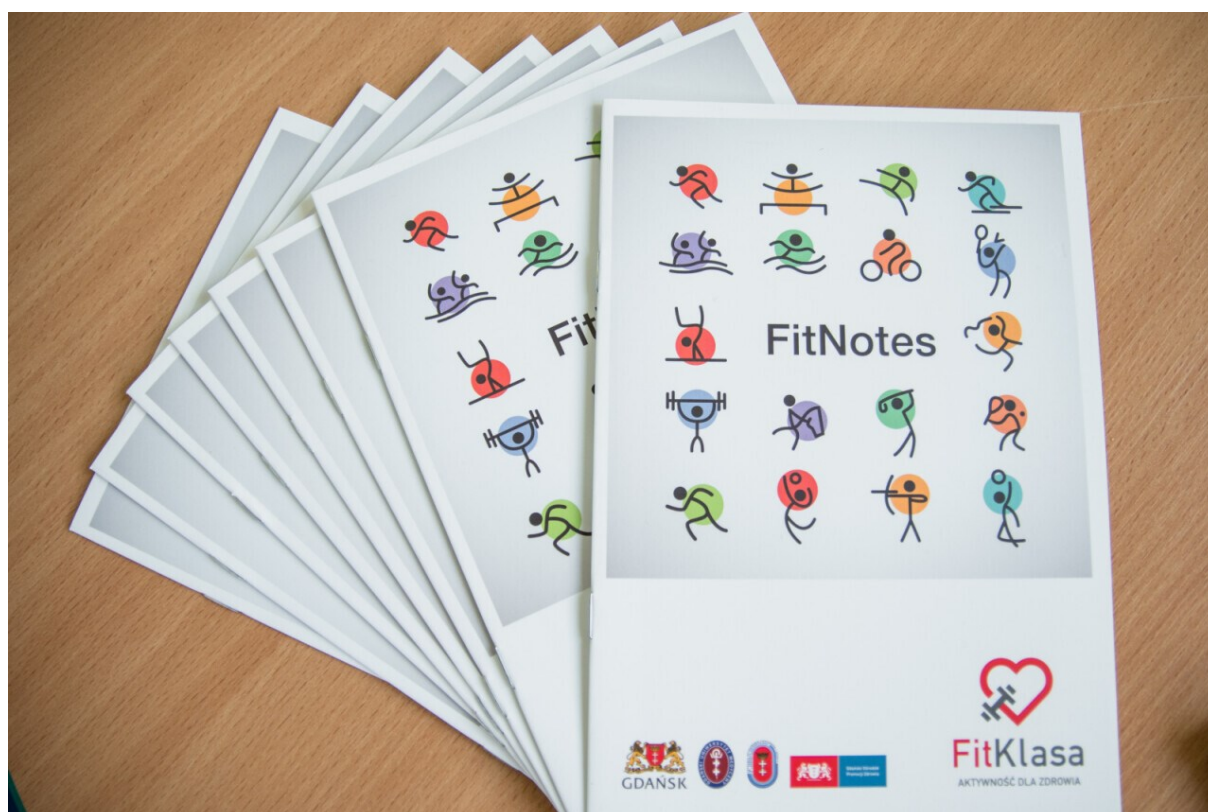
Rycina 1. Zeszyt ćwiczeń FitNotes w ramach programu FitKlasa.