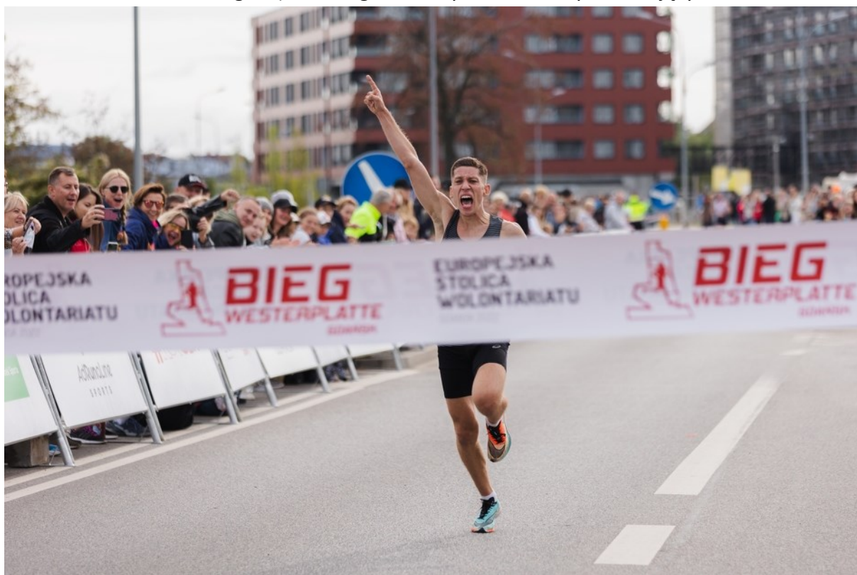
Rycina 2. 60. Bieg Westerplatte.