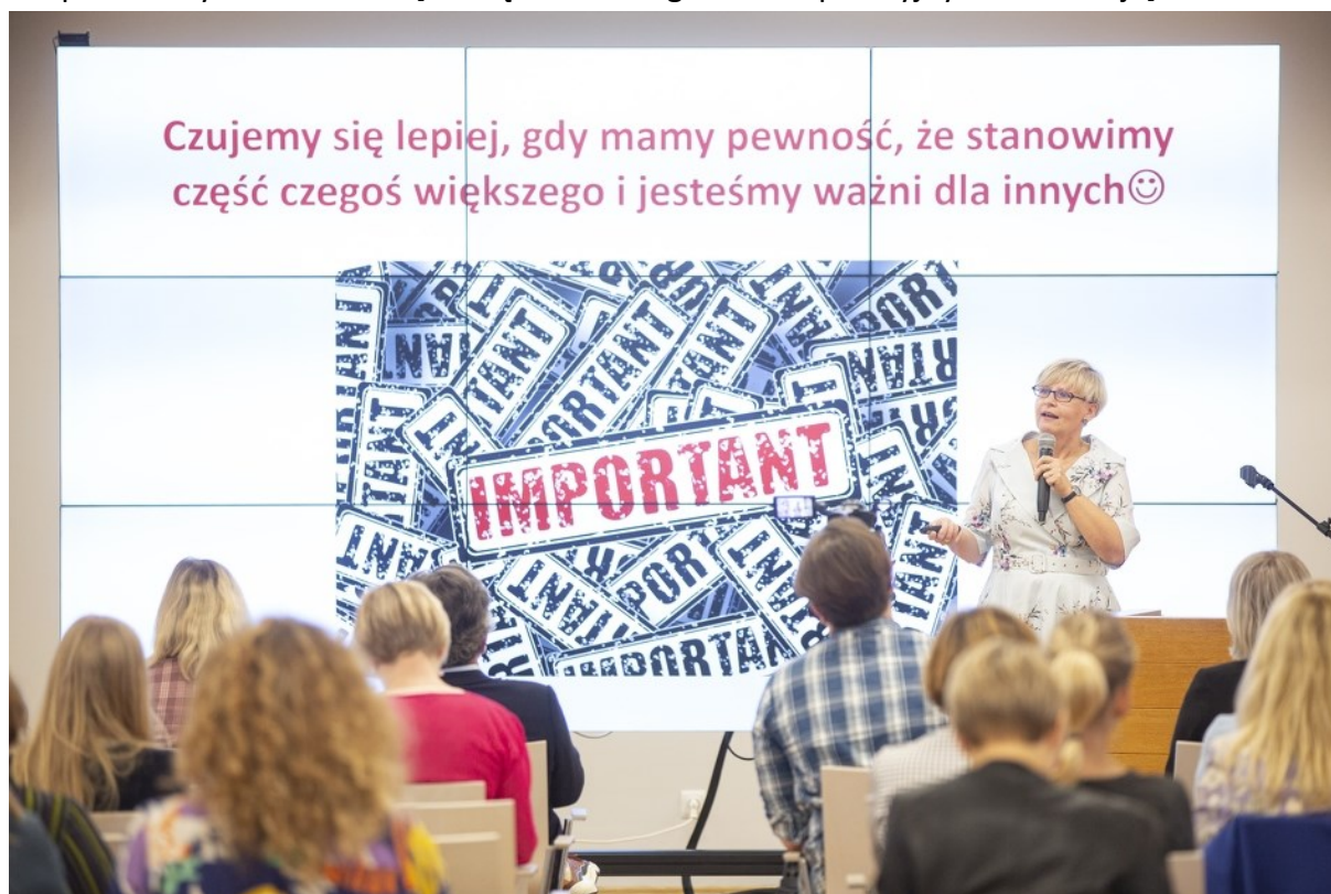
Rycina 4. Inauguracja Tygodnia Szczęścia w szkole.

po co, siła pochwały, jak przekazywać pozytywne informacje); zarejestrowano ponad 2 tys. odbiorców. [Powiązanie z Programem Operacyjnym I. Edukacja]