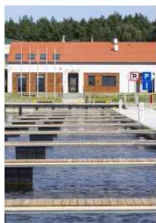
Obiekty hydrotechniczne przystanie, nabrzeża