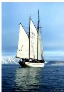
STS „Generał Żaruski” flagowy żaglowiec Gdańska