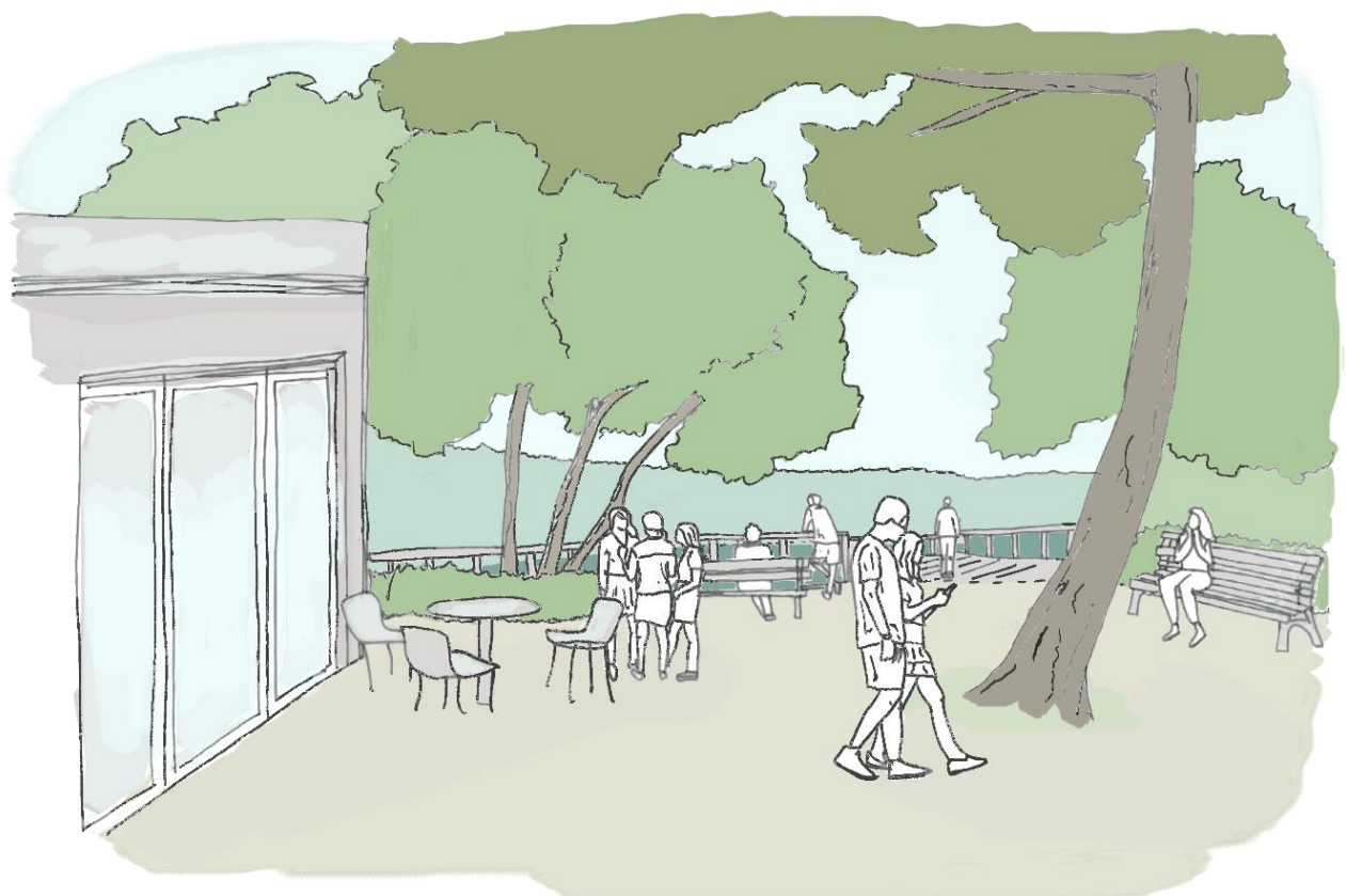
Rys. 5. Szkic koncepcyjny rejonu planowanej zabudowy usługowej oraz mola w południowej części obszaru a.