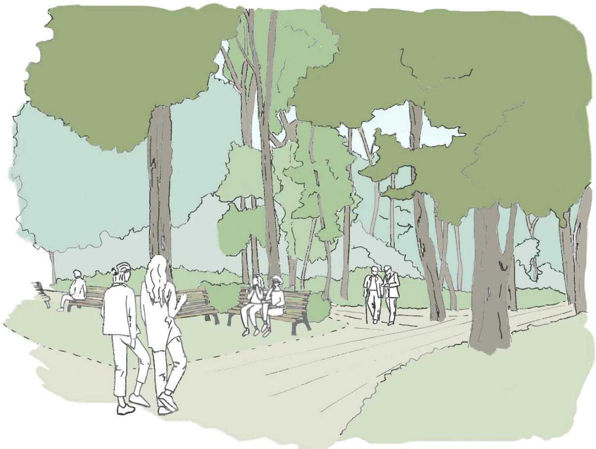
Rys. 4. Szkic koncepcyjny placu wejściowego w północnej części obszaru a.