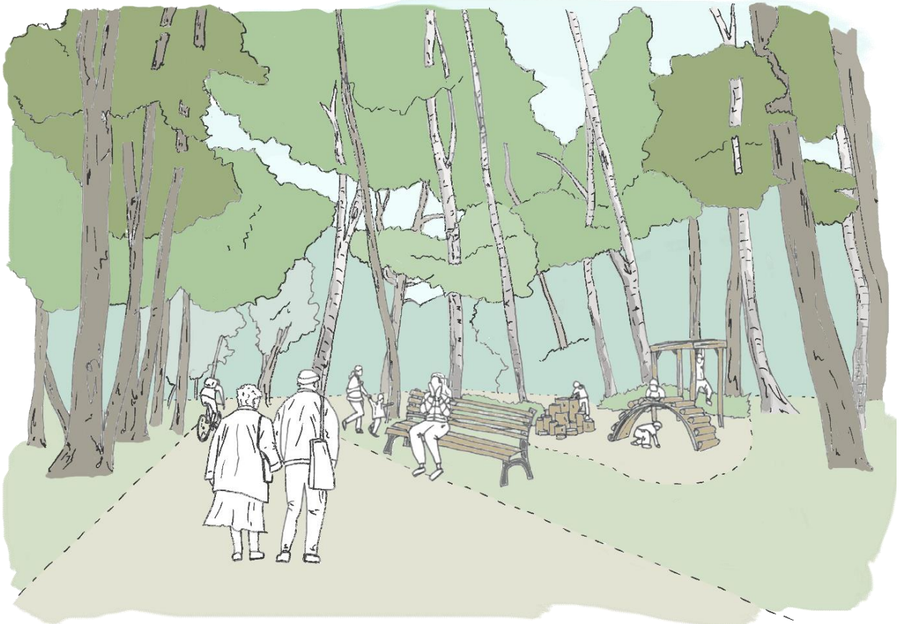
Rys. 8. Szkic koncepcyjny rejonu placu zabaw w południowo-zachodniej części obszaru c.