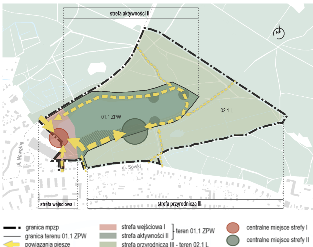
Rys. 1. Schemat z podziałem na strefy

Teren parku leśnego został podzielony na strefy: wejściową (I), aktywności (II) oraz przyrodniczą (III). W strefie wejściowej dominuje funkcja rekreacji. To jedyny obszar, w którym może powstać budynek do obsługi użytkowników parku. Takie zagospodarowanie ma podnieść jakość przestrzeni i nawiązywać do historycznych wartości.