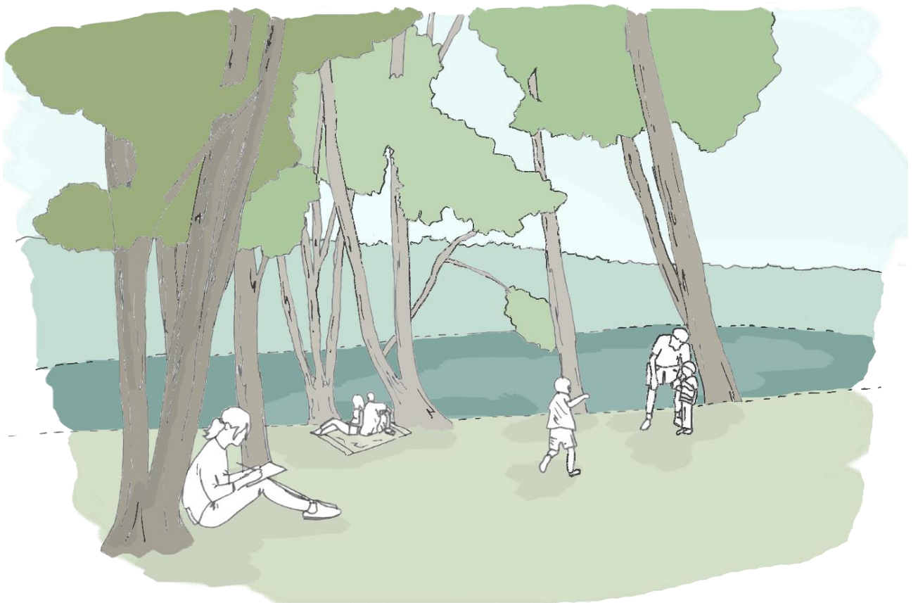
Rys. 9. Szkic koncepcyjny polany leśnej w obszarze f.