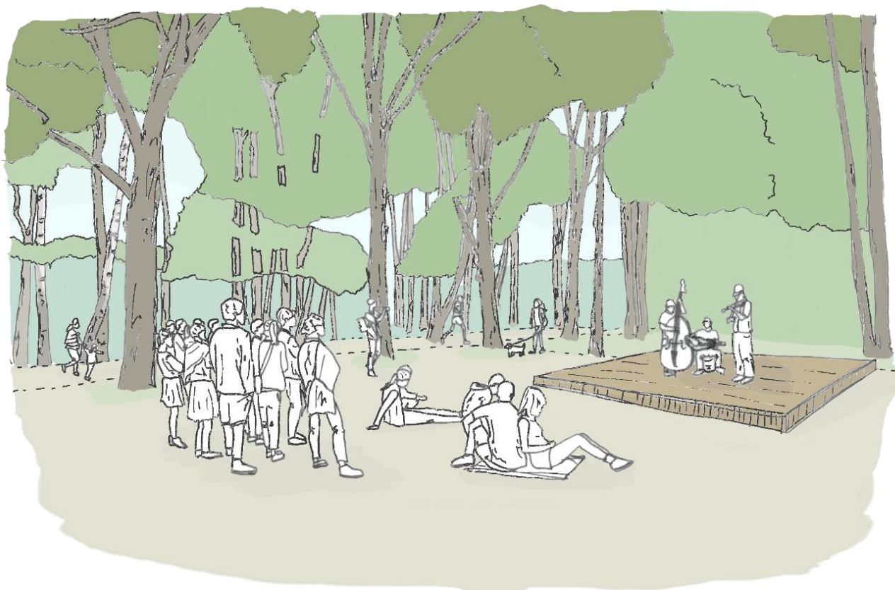
Rys. 7. Szkic koncepcyjny rejonu placu rekreacyjnego (boiska) w południowo-wschodniej części obszaru c.