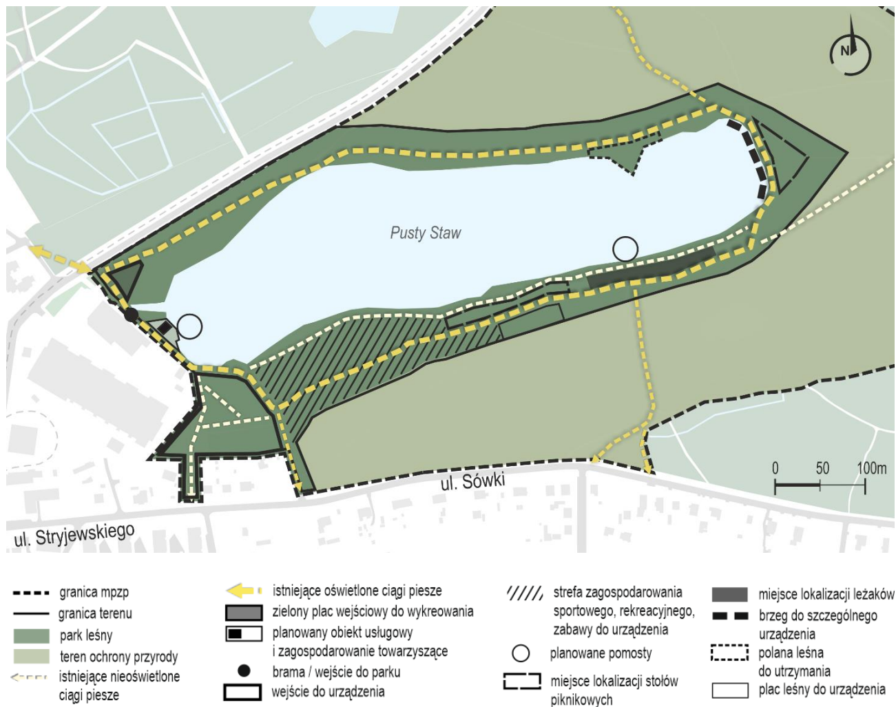
Rys. 3. Schemat z wytycznymi do zagospodarowania parku nad Pustym Stawem.

Dla zilustrowania charakteru poszczególnych obszarów sporządzono odrębne szkice, pokazujące przyszłe zagospodarowanie parku nad Pustym Stawem.