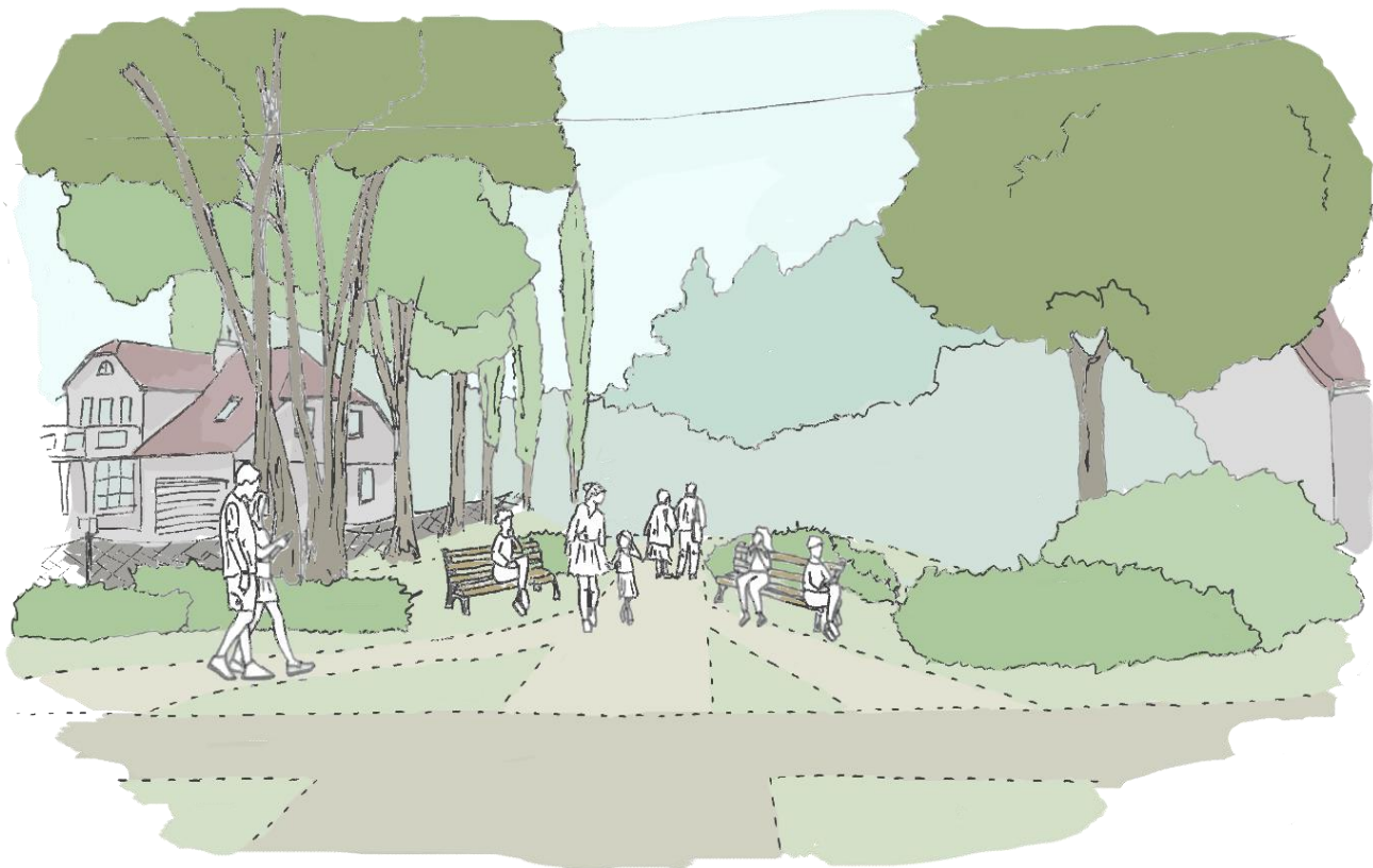
Rys. 6. Szkic koncepcyjny strefy wejściowej od ul. Stryjewskiego w południowej części obszaru b.