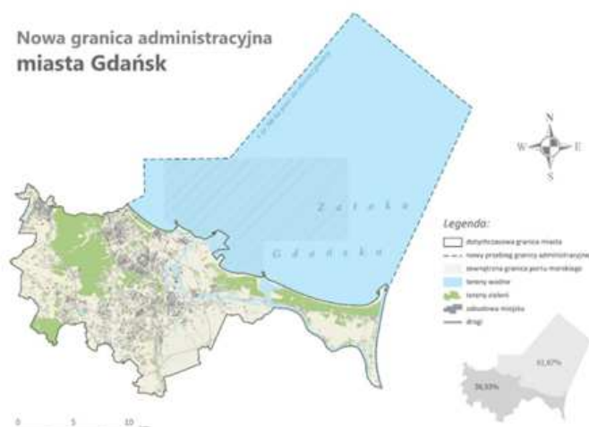
Nowa granica administracyjna miasta Gdańsk

Gdańsk, łącznie z obszarem pod morskimi wodami wewnętrznymi Zatoki Gdańskiej, zajmuje powierzchnię 683 km 2 , natomiast obszar lądowy miasta Gdańska ma powierzchnię 258 km 2 .