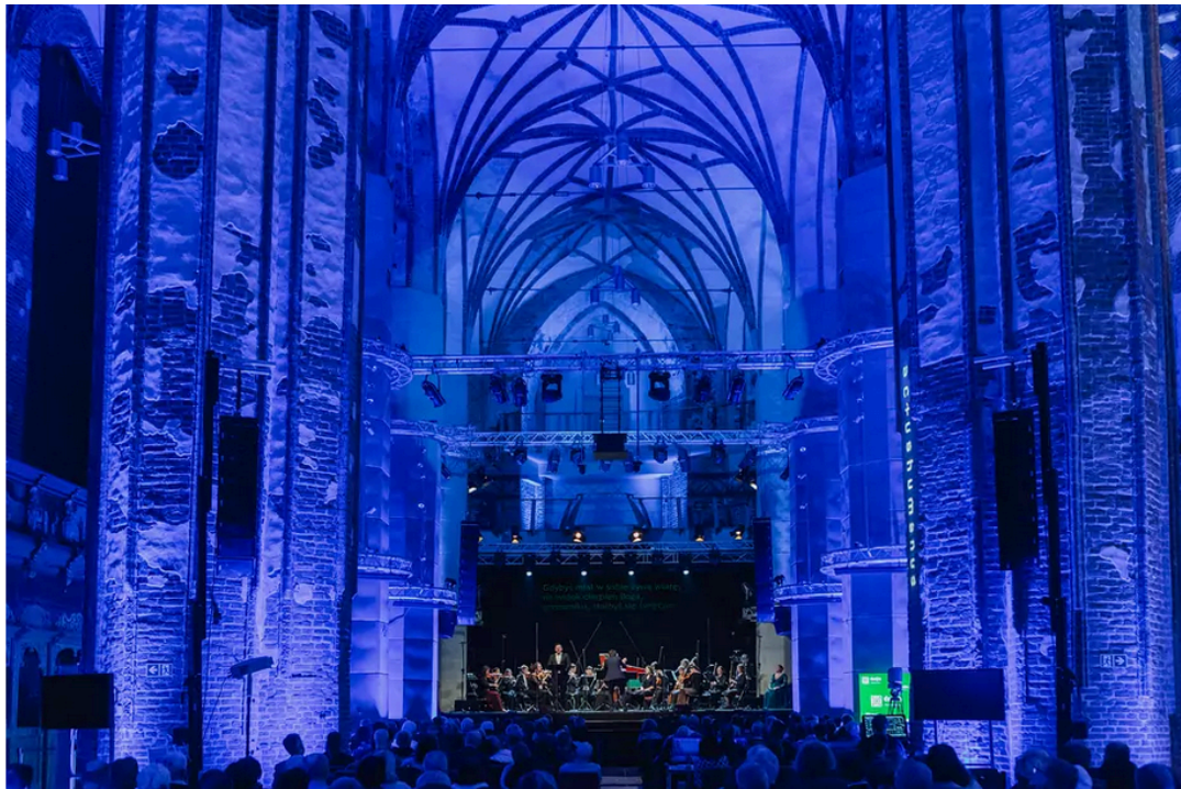
Actus Humanus Resurrectio – Gdańsk ponownie stolicą muzyki dawnej