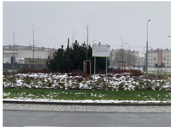
Budowa trasy tramwajowej od skrzyżowania Jabłoniowa/ Warszawska do Al. Vaclava Havla wraz z infrastrukturą towarzyszącą w ramach zadania: „Budowa ul. Nowej Warszawskiej w Gdańsku