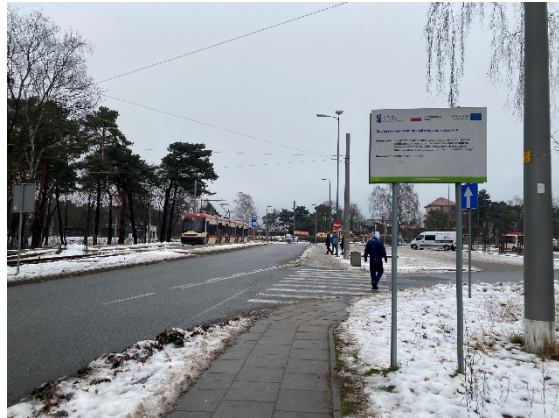
Przebudowa infrastruktury tramwajowej w ul. Budzysza, Stryjewskiego i Nowotnej w Gdańsku w ramach Gdańskiego Projektu Komunikacji Miejskiej – etap IVa”