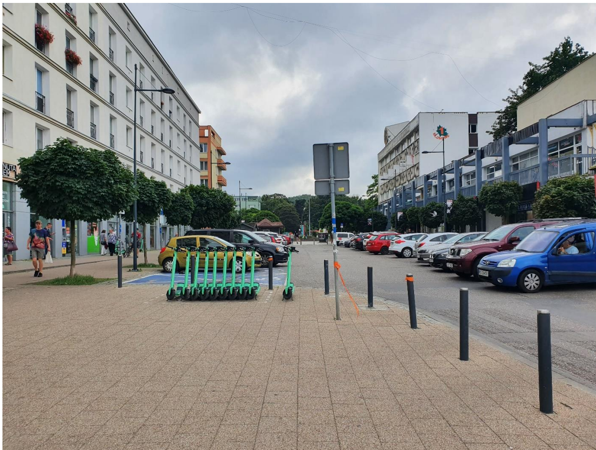
5. - mat. GZDiZ