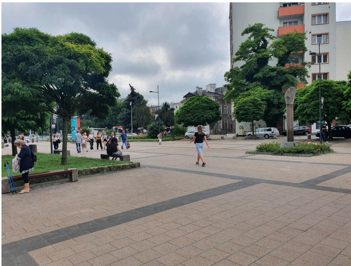
3. - mat. GZDiZ