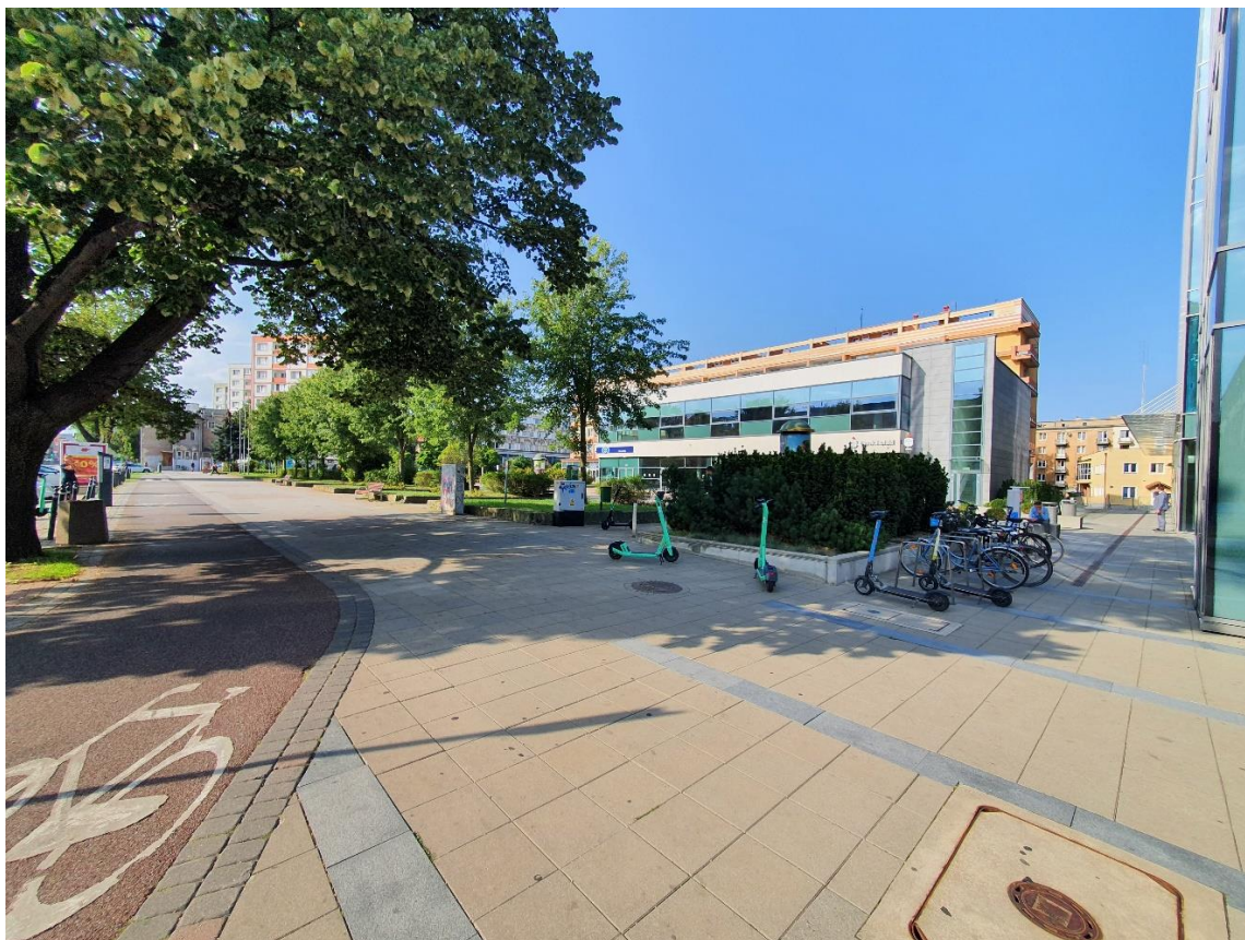
1. - mat. GZDiZ