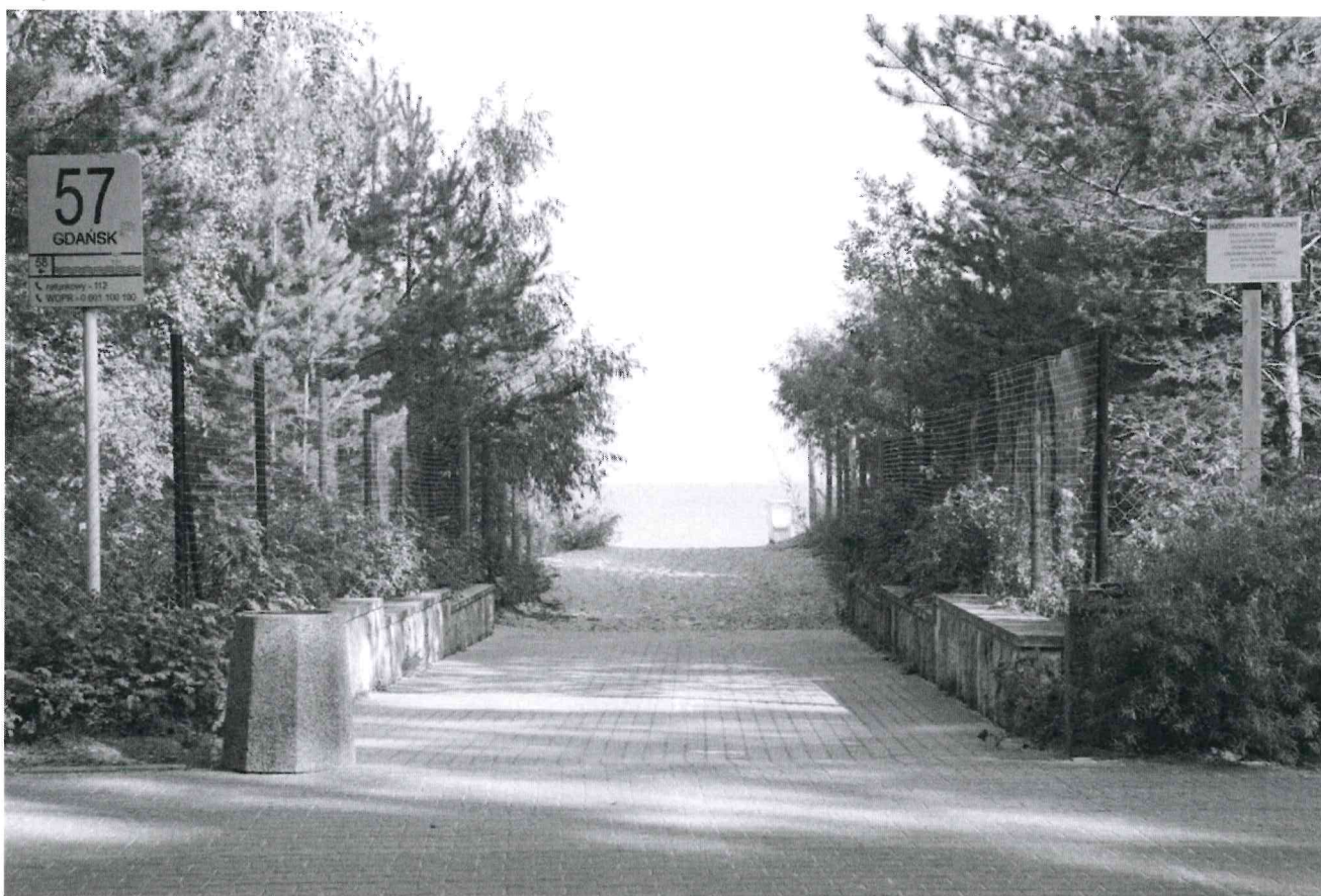
Konkurs na dzierżawę na czas oznaczony nieruchomości stanowiących własność Gminy Miasta Gdańska, położonych w Gdańsku w „Pasie Nadmorskim”

Prezydent Miasta Gdańska zaprasza do uczestniczenia w terminie do dnia 11 kwietnia 2024 roku w konkursie na dzierżawę nieruchomości oznaczonych numerami N-1, N-2, N-3, N-4, N-5, N-6, N-7, N-8 przeznaczonych do prowadzenia sezonowego punktu handlowego obsługi ruchu turystycznego do sprzedaży artykułów plażowych (piłki, koła i inne zabawki dmuchane, materace, parawany, leżaki), balonów, okularów, pamiątek, pocztówek i zabawek oraz w terminie do dnia 12 kwietnia 2024 roku nieruchomości oznaczonych numerami G-1, G-2, G-3, G-4, G-5, G-6, G-7, G-8, G-9, G-10, G-11, G-12 przeznaczonych do prowadzenia małej gastronomii z wykorzystaniem roweru lub wózka do sprzedaży kawy, herbaty, napojów bezalkoholowych, słodyczy, lodów, kanapek, przekąsek, waty cukrowej i wyrobów cukierniczych, stanowiących własność Gminy Miasta Gdańska, położonych w Gdańsku w „Pasie Nadmorskim”.