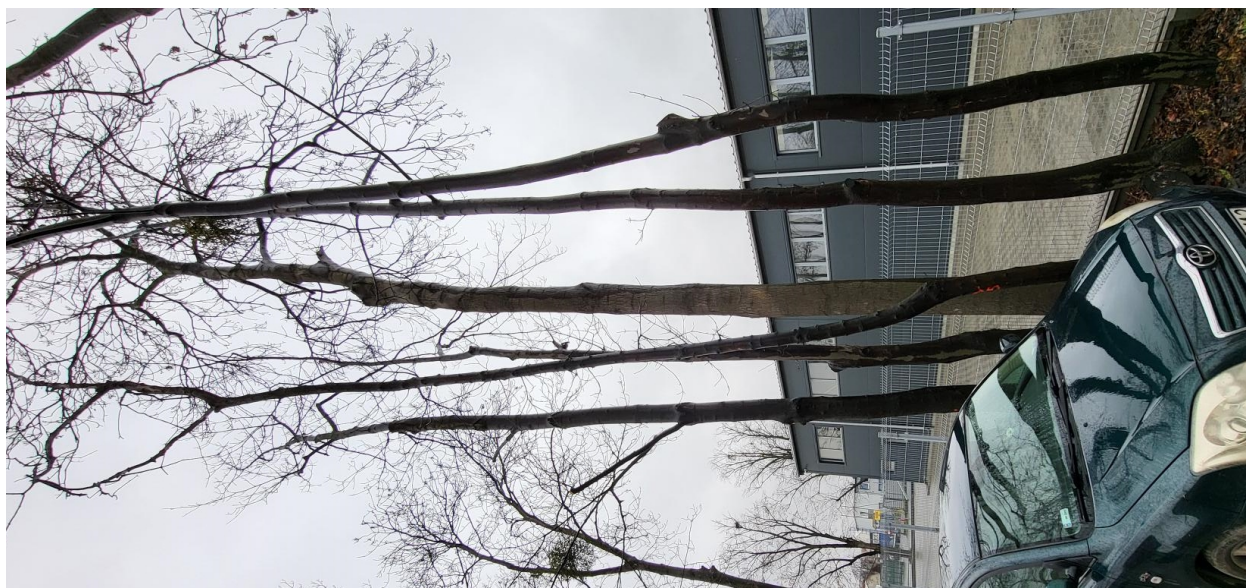
Dokumentacja fotograficzna drzewa nr 5