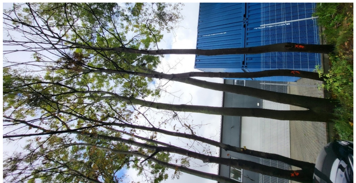
Dokumentacja fotograficzna drzewa 6,7,8