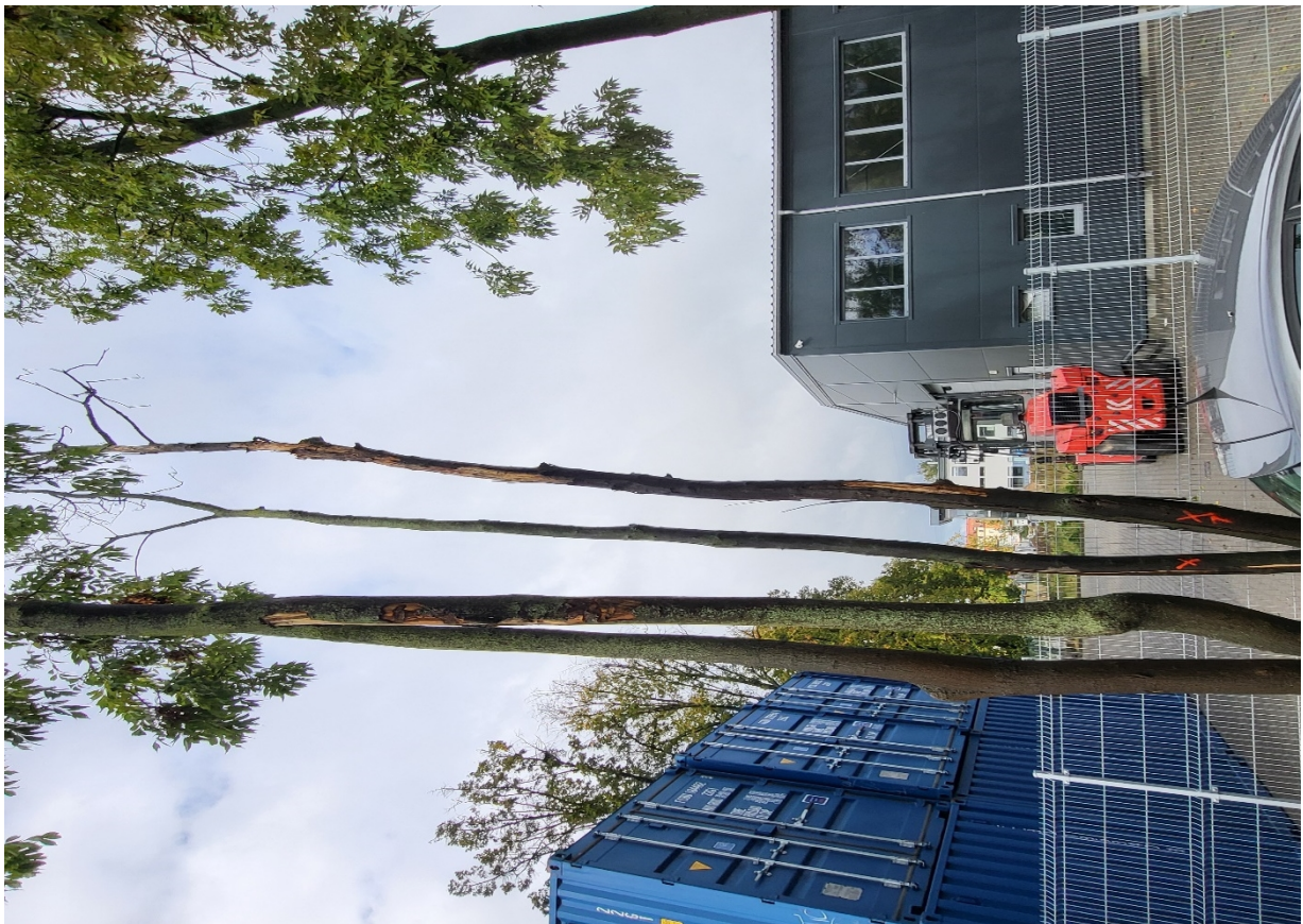
Dokumentacja fotograficzna drzewa nr 1