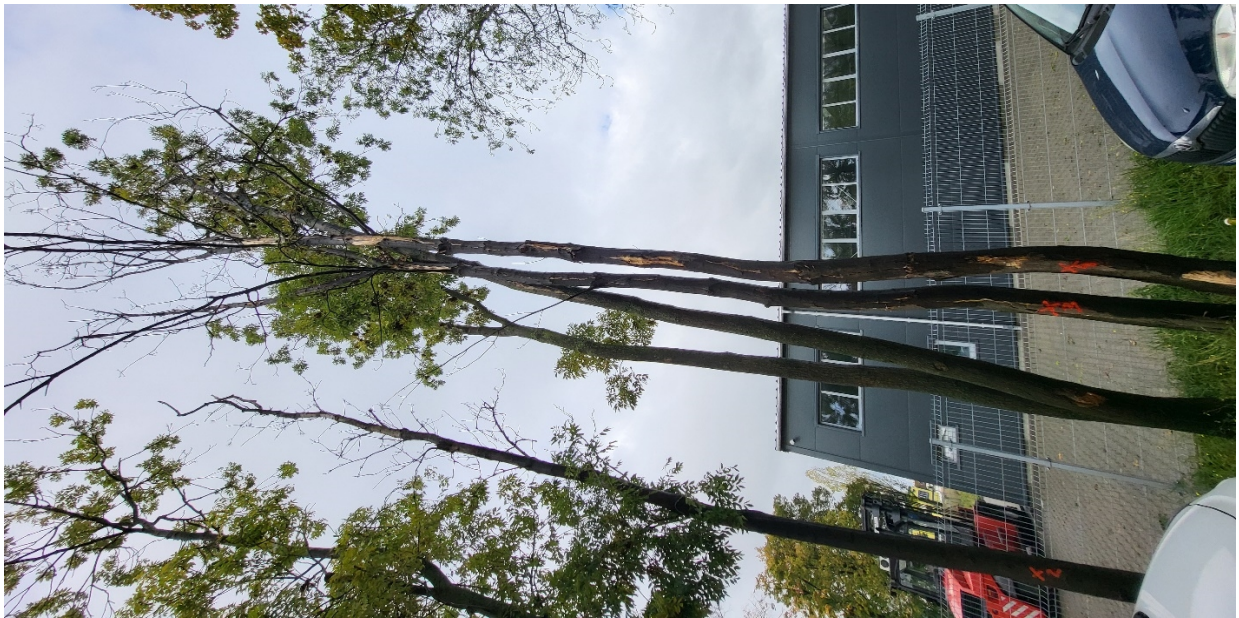
Dokumentacja fotograficzna drzewa nr 2, 3 i 4